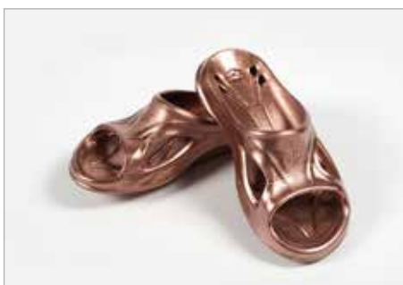
LENA SKOLIK Tytuł pracy: Color steps PLSP Częstochowa / Projektowanie multimedialne