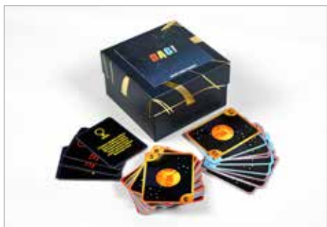
AGNIESZKA KOŁODZIEJCZYK Tytuł pracy: Dag! PLSP Częstochowa / Projektowanie graficzne