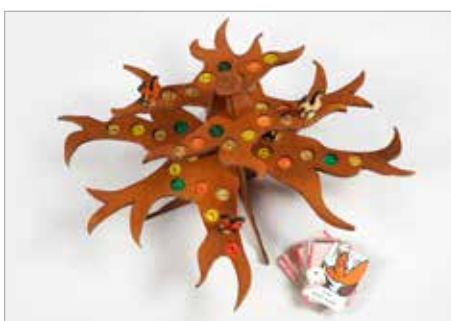
ALICJA WÓJCICKA Tytuł pracy: Wiewiórgedon PLSP Szczecin / Projektowanie wyrobów artystycznych