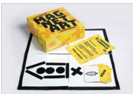
ZUZANNA STEFANEK Tytuł pracy: Magnet Art PLSP Częstochowa / Projektowanie graficzne