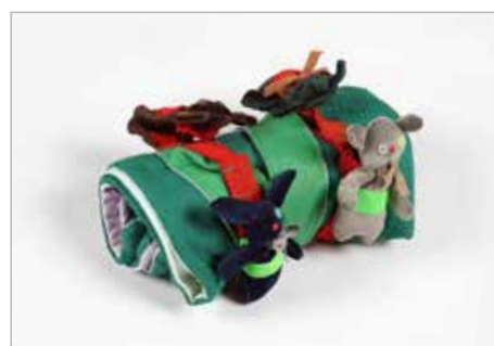
EMILIA ROMANIAK Tytuł pracy: Pleciuchy-pogaduchy PLSP Kraków / Projektowanie przestrzeni