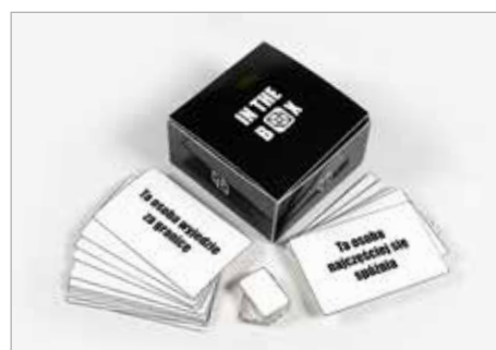
MAJA CZAJKOWSKA Tytuł pracy: In the box PLSP Częstochowa / Projektowanie graficzne