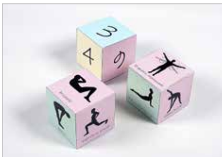
JULIA STOLARSKA Tytuł pracy: Rzut formą PLSP Częstochowa / Projektowanie graficzne