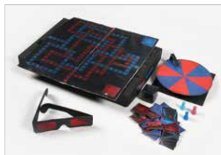
SEBASTIAN BARON Tytuł pracy: Trzeci wymiar PLSP Częstochowa / Projektowanie graficzne