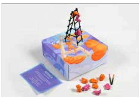
ALICJA BOJAKOWSKA Tytuł pracy: Drabina do nieba LSP Słupsk / Wzornictwo artystyczne