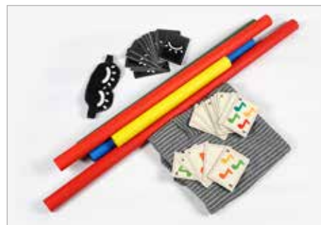
JULIA SKUZA Tytuł pracy: EchoRurki PLSP Częstochowa / Projektowanie graficzne