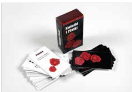
OLIWIA MUGAJ Tytuł pracy: Kwiatki i płatki PLSP Częstochowa / Projektowanie graficzne