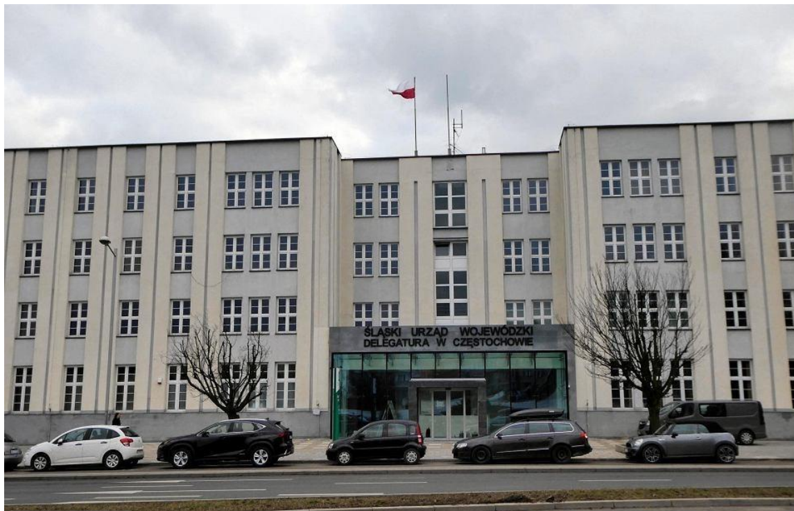
Wejście od ul. Korczaka