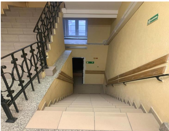
Zdj. 4. Droga do wyjścia ewakuacyjnego z poziomu POK

Ewakuacja z budynku odbywa się przez hol główny, w kierunku podwórza, gdzie wyznaczone jest miejsce zbiórki w przypadku ewakuacji. By opuścić budynek tą drogą należy pokonać schody / zdj 4/. Budynek jest wyposażony w system alarmu pożarowego.