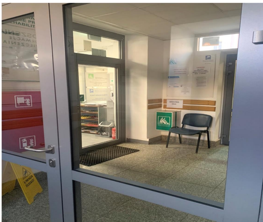
Zdj. 2. Hol przed wejściem do Biura Powiatowego