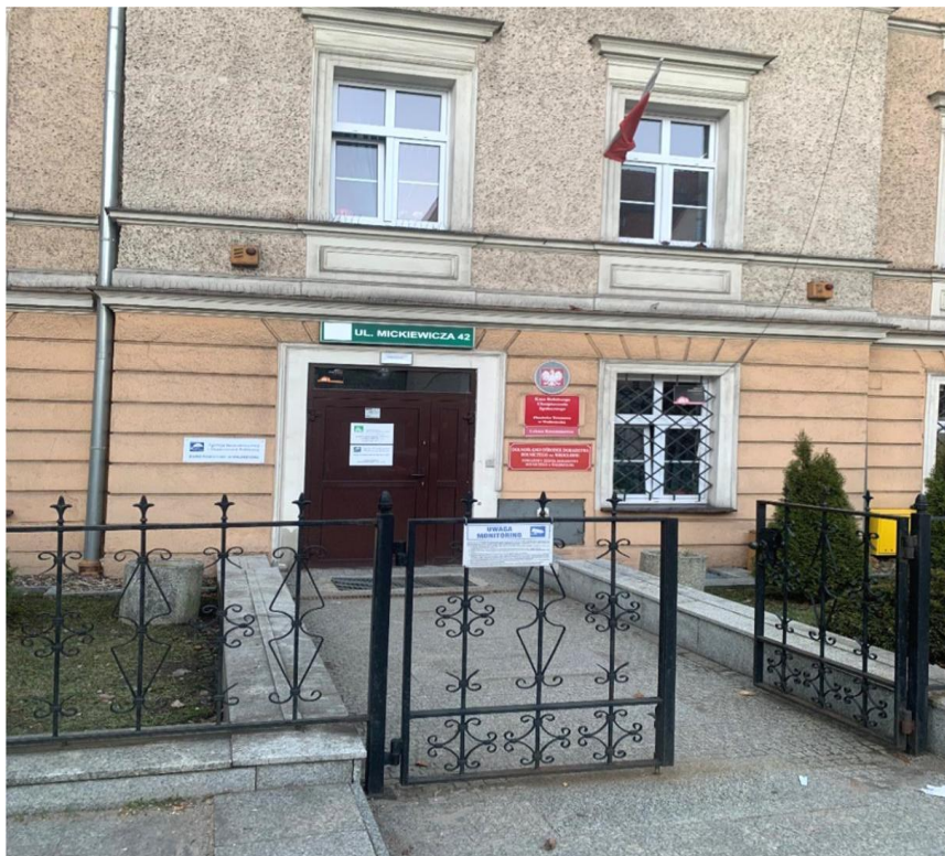
Zdj. 1. Wejście do siedziby ARiMR w Wałbrzychu od frontu