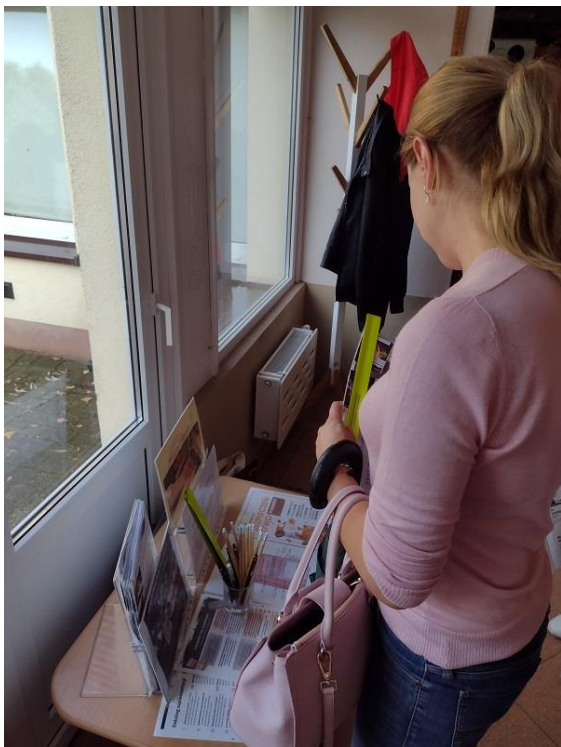
Przedszkole nr 14 Maluszek w Ostrowie Wielkopolskim – 3 zdjęcia