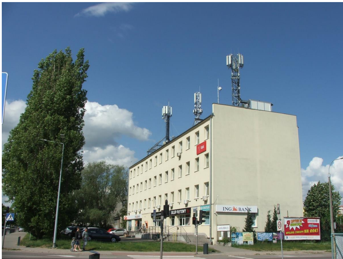
Fot. 1: Widok anten stacji bazowych ID: GDA0008B, ID: BT43288 oraz ID: 4971/5677 (6420)/(40182N), zlokalizowanych przy ul. Jagiellońskiej 13 w Gdańsku