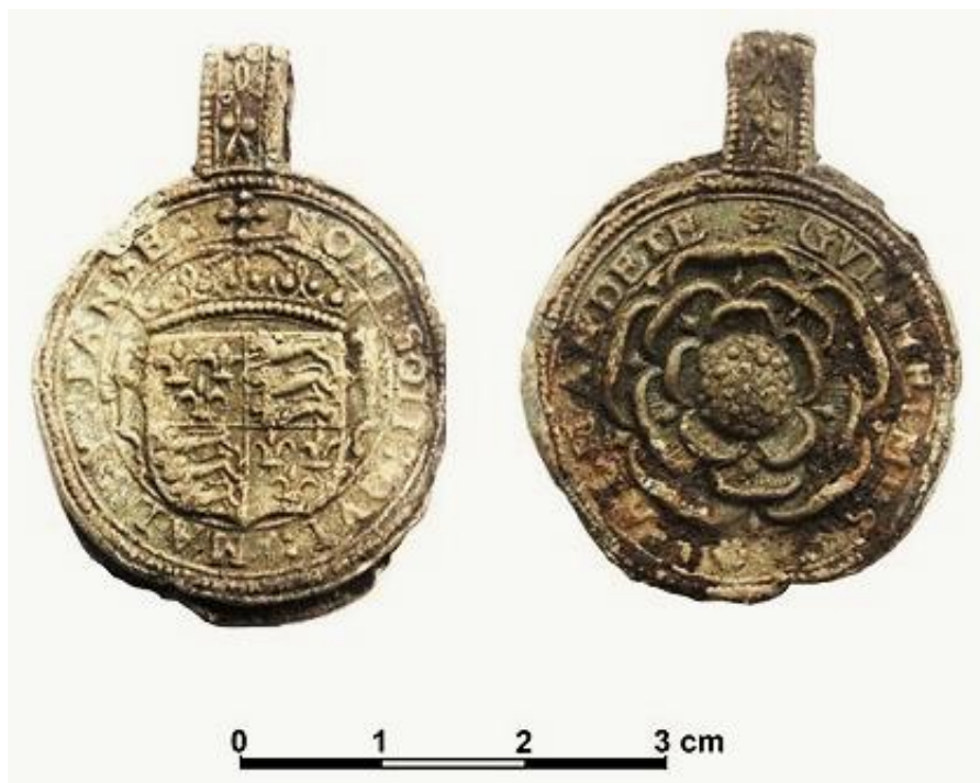
Ryc. 1. Ołowiana plomba handlowa Koprzywnica, gm. Koprzywnica.

Plomby tekstylne to średniowieczne i nowożytny znaki towarowe umieszczane na tkaninach eksportowanych za granicę, potwierdzające ich jakość, pochodzenie i spełnienie wymogów celnych (opłacenie cła).