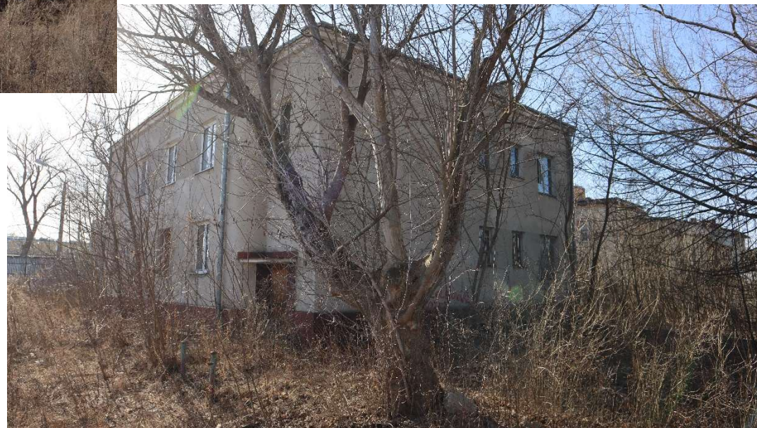
Widok od strony wschodniej

Opracowanie załącznika: Arkadiusz Bojczuk, maj 2026 r. (data i podpis)