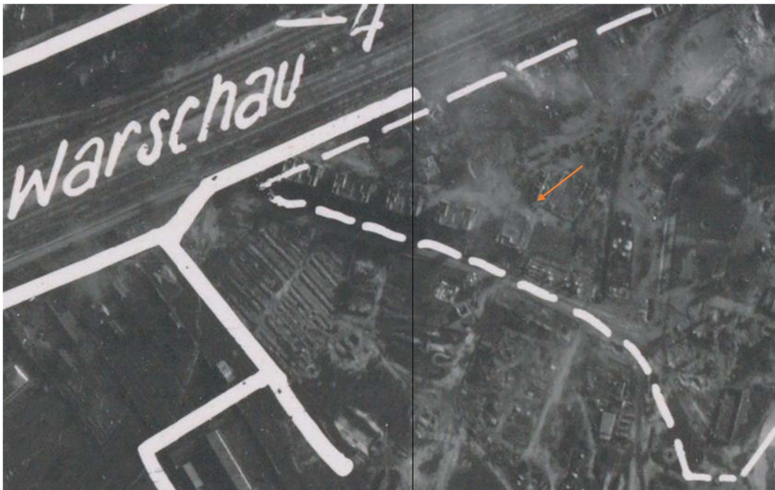
Fotografia lotnicza z 1944 r.

Opracowanie załącznika: Arkadiusz Bojczuk, maj 2026 r. (data i podpis)