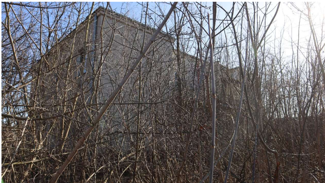
Widok od strony północnej