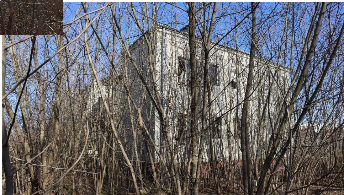
Widok od strony zachodniej

Opracowanie załącznika: Arkadiusz Bojczuk, maj 2026 r. (data i podpis)