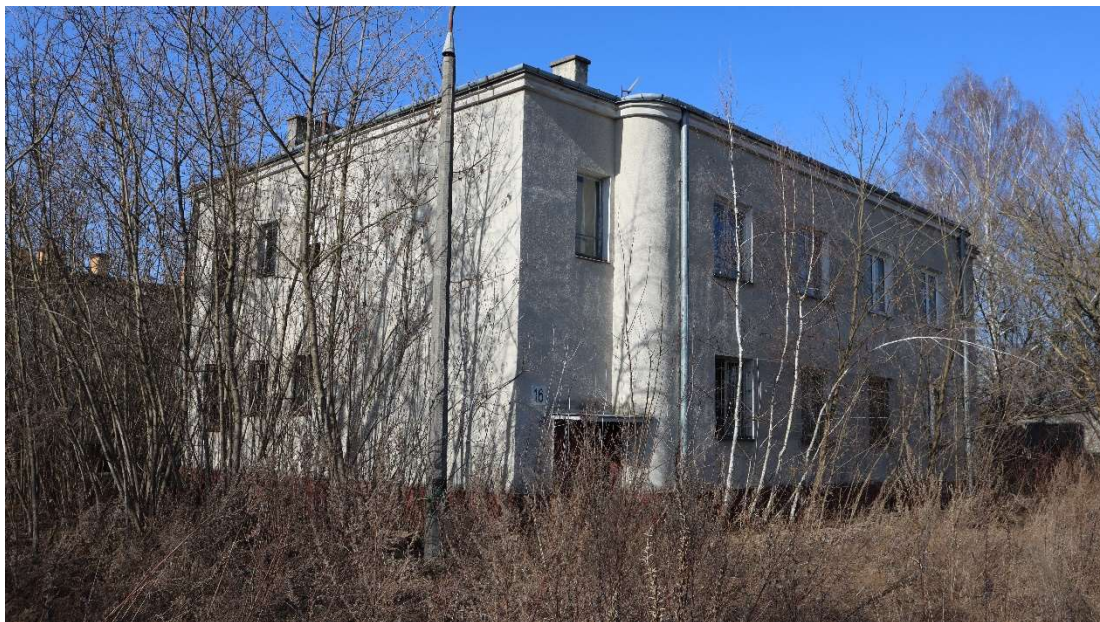
Widok od strony południowej