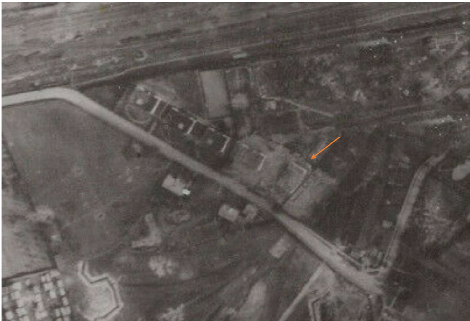
Fotografia lotnicza z września 1939 r.

Opracowanie załącznika: Arkadiusz Bojczuk, maj 2026 r. (data i podpis)