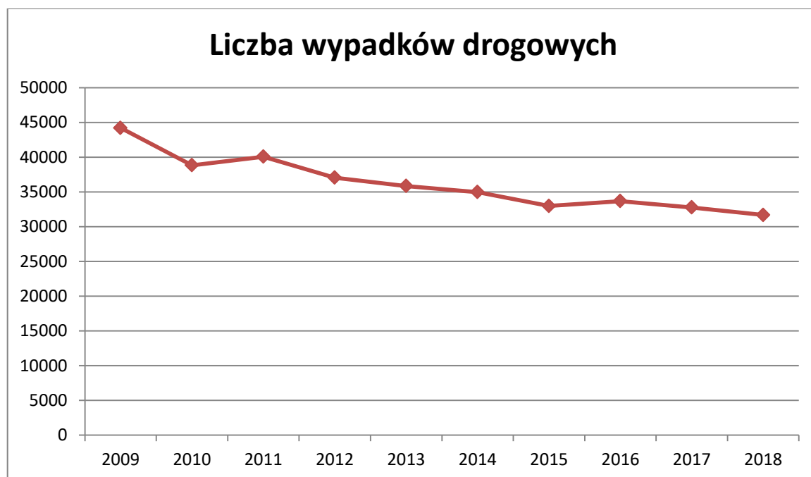
Wykres 1 Liczba wypadków drogowych w latach 2009-2018.

Pomimo tych pozytywnych trendów, Polska nadal zajmuje niekorzystne miejsce w rankingu bezpieczeństwa państw Unii Europejskiej. W 2017 r. ze wskaźnikiem ponad 8,6 osoby zabitej na 100 wypadków byliśmy krajem o najwyższym poziomie zagrożenia życia w ruchu drogowym. Tymczasem w 2004 r., wstępując do Unii Europejskiej, Polska zobowiązała się do realizacji polityki unijnej również w zakresie bezpieczeństwa drogowego. Działania na rzecz poprawy bezpieczeństwa ruchu prowadzone są w ramach Narodowego Programu Bezpieczeństwa Ruchu Drogowego 2013-2020.