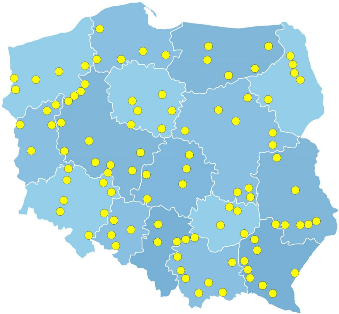
Rysunek 2 Program Budowy 100 Obwodnic - Plan realizacyjny

ekspresowej; te dla których zostały rozpoczęte prace przygotowawcze oraz te, które są najpilniejsze z uwagi na obecną i prognozowaną ocenę pod względem poziomu natężenia ruchu ogółem, ruchu ciężarowego oraz ruchu osobowego a także poziomu wypadkowości (liczby wypadków, liczby rannych oraz liczby zabitych).