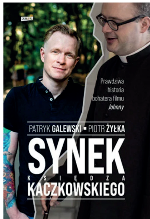
Fot. Dorota Malecha

Dorota Malecha Rzecznik Praw Pacjenta Szpitala Psychiatrycznego woj. dolnośląskie