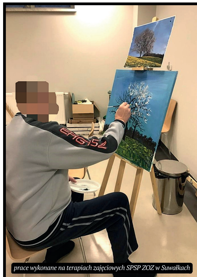
prace wykonane na terapiach zajęciowych SPSP ZOZ w Suwałkach

BŁ: Terapia zajęciowa sprzyja niewątpliwie zdrowieniu poprzez odbudowę ról społecz-