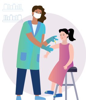
Szczepienia nastolatków przeciw HPV

W celu ochrony kobiet przed niszczącymi skutkami raka szyjki macicy WHO apeluje o: