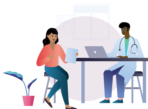
Regularne badania przesiewowe w kierunku HPV oraz odpowiednie leczenie