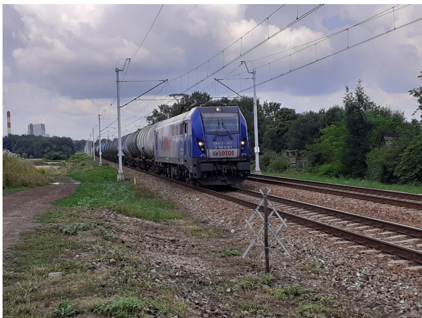
Fot. 3. Siemianowice Śląskie, ul. Marcina Watoły, RB1. Badany odcinek LK161, w kierunku Chorzowa.

W wyznaczonym rejonie badań, równoległe do pomiarów hałasu, rejestrowano strukturę i natężenie ruchu pojazdów szynowych. Umożliwiło to wyznaczenie poziomów równoważnych dźwięku na podstawie wyliczonych poziomów ekspozycyjnych i liczby przejazdów pojazdów szynowych zakwalifikowanych do odpowiednich klas.