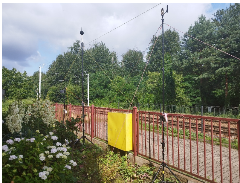
Fot. 1. Siemianowice Śląskie, ul. Józefa Bema, RB1. Lokalizacja punktu pomiarowego w rejonie LK161.

Szczegóły instalacji mikrofonu w punkcie pomiarowym wraz z danymi określającymi położenie mikrofonu w przestrzeni, zawarte są w dokumentacji technicznej CLB Oddział w Katowicach. Lokalizację stanowiska pomiarowego oraz przebieg badanego odcinka linii kolejowej przedstawiają fotografie 1 – 3.