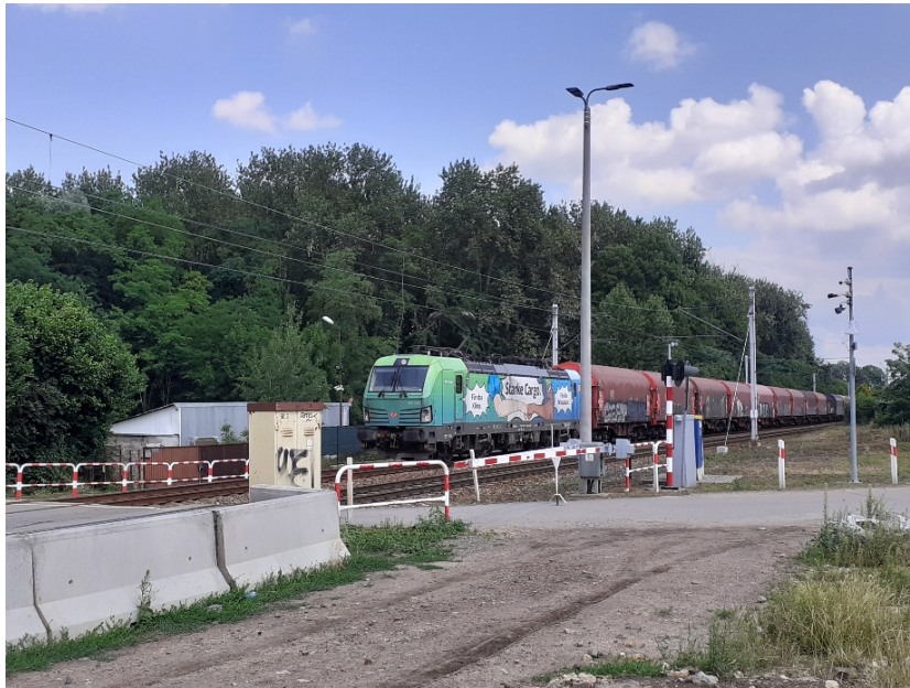
Fot. 2. Siemianowice Śląskie, ul. Marcina Watoły, RB1. Badany odcinek LK161, w kierunku Katowic.