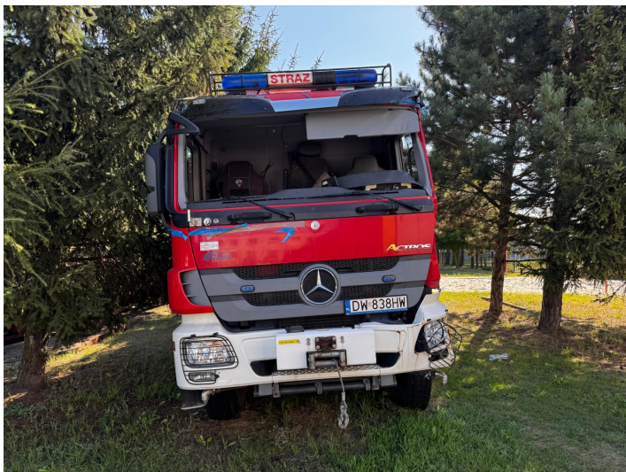
Zdj cie WhatsApp 2025-09-02 o 15