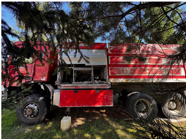
Zdj cie WhatsApp 2025-08-22 o 14