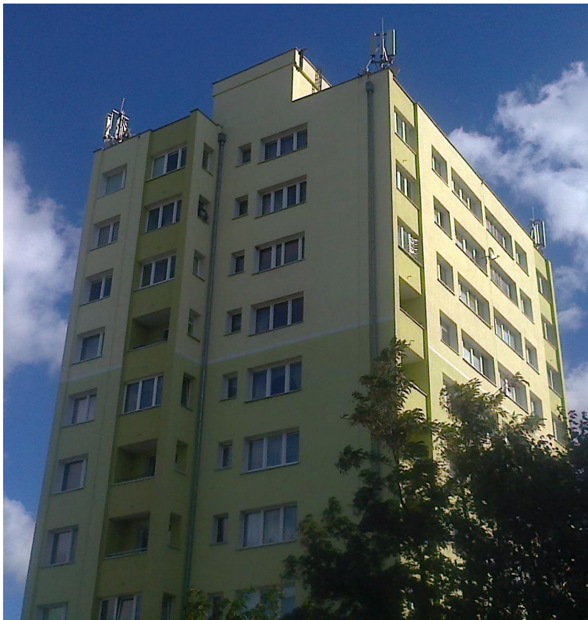
Fot. 1: Widok anten stacji bazowej ID: GDA0033D, zlokalizowanej przy ul. Siennickiej 10 w Gdańsku