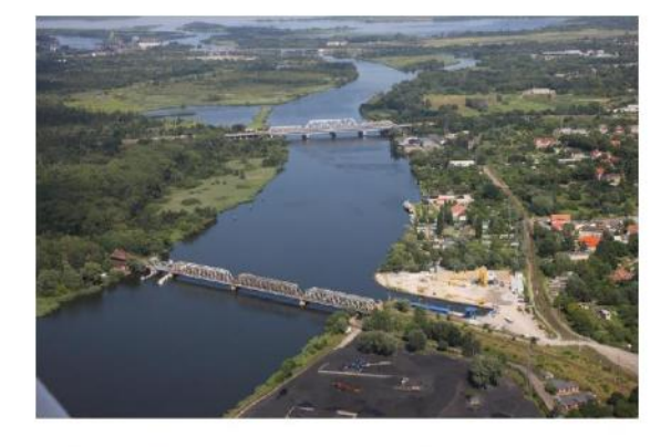
Zgodnie z wymaganiami Banku Światowego (polityki operacyjnej OP 4.12), Instytucji współfinansującej realizację Projektu Ochrony Przeciwpowodziowej w Dorzeczu Odry i Wisły

15.06.2020 09:52 / ostatnia modyfikacja: 15.06.2020 09:54