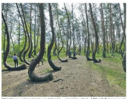
Wyjątkowa przyrodnicza osobliwość – skupisko około 100 zdeformowanych sosen rosnących na obszarze około 0,30 ha.

uznawany za ewenement w skali światowej. Na czym polega jego unikatowość? Tuż nad ziemią pnie sosen zamiast rosacj pionowo skręcają pod kątem 90 st. i wyginają się szerokim tukiem ku gorze. Wszystkie pnie wygięte są w kieruniku północnym. Widok, jaki tworzą te drzewa, jest niesamowity. Doskoła tego miejsca rosną proste sosny, zatem – choć istnieje wiele mniej lub bardzie j nieprawdopodobnych teorii – wiele wskazujen na to, że ktoś kiedyś musiał się przyczynić do pokrzywienia drzew. Czy deformacja sosen była zamierzona? Taki charatter krzywizn pni sosny pospolitej jest bardzo rzadko spotykany. Widać na nich wyrażnie, że powstały w wyniku mechanicznych uzskodzeń. Wygięcia mają długość oł jednego do trzech metrów. Nad fukiem pnie pną się już pionowo do góry. Sosny, pomimo swojego wieku, są