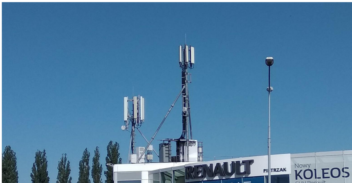
Fot. 1: Widok anten stacji bazowych ID: BT_24813 oraz ID KAT0062, zlokalizowanych przy ul. Bocheńskiego 125 w Katowicach