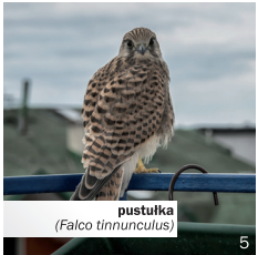
pustułka ( Falco tinnunculus )