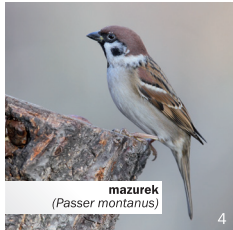
mazurek ( Passer montanus )