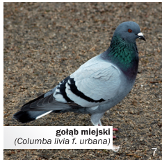
gołąb miejski ( Columba livia f. urbana )