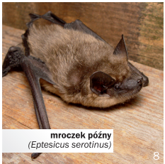
mroczek późny ( Eptesicus serotinus )