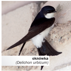
oknówka ( Delichon urbicum )