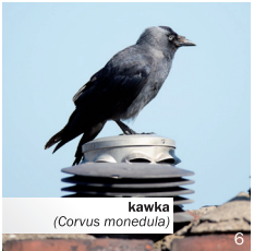
kawka ( Corvus monedula )