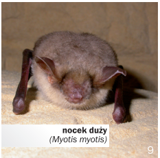
noczek duży ( Myotis myotis )