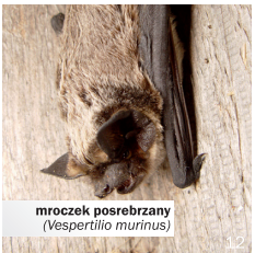
mroczek posrebrzany ( Vespertilio murinus )