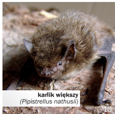
karlik wielki ( Pipistrellus nathusii )