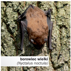
borowiec wielki ( Nyctalus noctula )