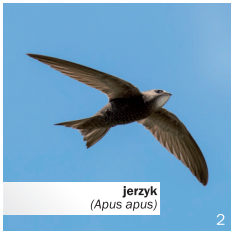
jerzyk ( Apus apus )