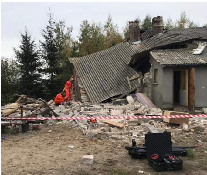
Wybuch gazu w Dąbrówce

propan-butan. Gruzowisko pod kątem obecności osób pod gruzami sprawdzili geofonem i kamerą wziernikową Specjalistyczna Grupa Poszukiwawczo-Ratownicza. Nadzór budowlany określił, że budynek nie nadaje się do użytku i nakazał jego rozbiórkę. Wójt Gminy Kikół zapewnił kwaterę tymczasową dla osób mieszkających w zniszczonym budynku. W akcji trwającej 5 godzin brały udział 4 zastępy PSP oraz 1 zastęp OSP.