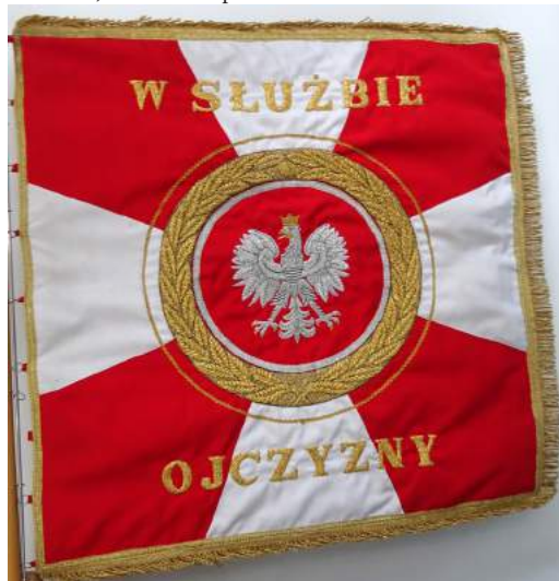
Sztandar JRG PSP w Lipnie z 1996 r.