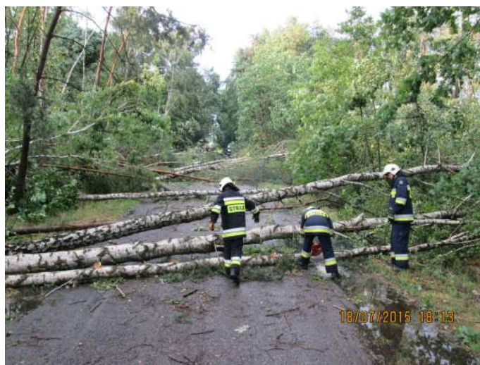
Wichury i nawałnice w powiecie lipnowskim

4) 19 października 2015 r., Złotopole, gm. Lipno. Pożar na całej powierzchni kurnika. W środku nie było zwierząt. Palila się słomiana ściółka w kurniku oraz zgromadzona słoma na poddaszu części technicznej kurnika. Ogień obejmował również drewnianą konstrukcję dachu. Podano 5 prądów wody w natarciu, pożar ugaszono. Spaleniu uległ cały budynek inwentarski z wyposażeniem i około 60 ton słomy. W działaniach udział brało 15 zastępów straży pożarnej. Szacunkowe straty wyniosły 1.500 tys. zł, uratowano mienie wartości 50 tys. zł.