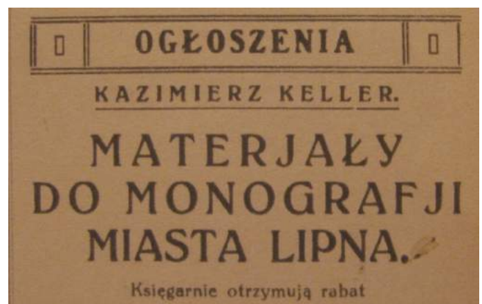
Ogłoszenie z Gazety Lipnowskiej o wydaniu monografii Lipna