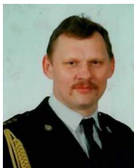
01 IX 1990 - 30 VI 1992 Komendant Rejonowy Straży Pożarnych 1 VII 1992 - 31 XII 1998 Komendant Rejonowy PSP w Lipnie 1 I 1999 - 3 I 2009 Komendant Powiatowy PSP w Lipnie