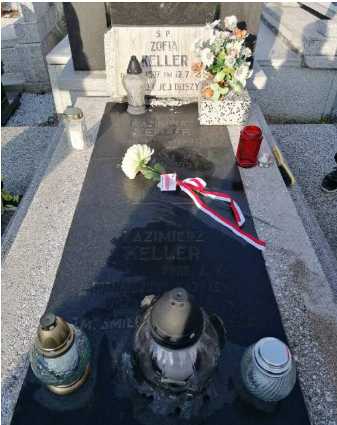
Miejsce spoczynku K. Kellera na cmentarzu w Lipnie