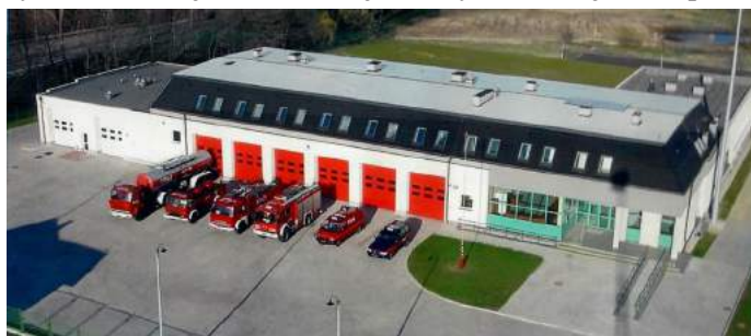
Budynek główny Komendy w 2004 r.

Wychodząc naprzeciw nowym zadaniom stawianym przed Państwową Strażą Pożarną, w dniu 3 października 2000 r. w Lipnie przy ulicy Sportowej został wmurowany kamień węgielny w nowo budowanej strażnicy, która ostatecznie została oddana do użytku w 2004 r. i od tego czasu stanowi siedzibę Komendy Powiatowej Państwowej Straży Pożarnej w Lipnie.