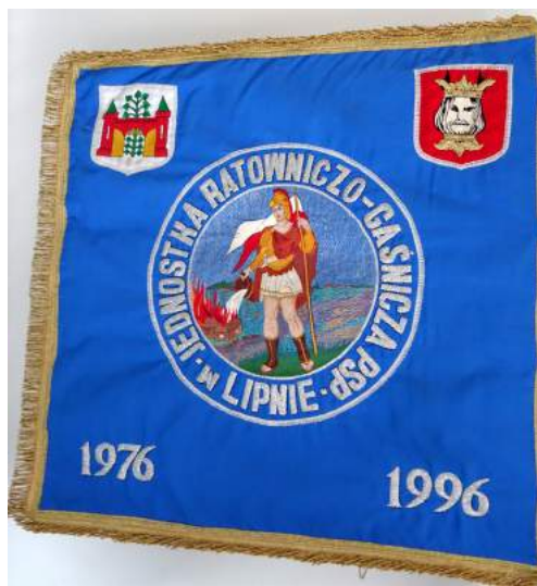
Sztandar JRG PSP w Lipnie z 1996 r.

Ważnym wydarzeniem w dziejach Państwowej Straży Pożarnej w Lipnie było nadanie sztandaru Jednostce Ratowniczo-Gaśniczej w Lipnie. Wydarzenie to przypadało w 115. rocznicę istnienia i działalności Ochotniczej Straży Pożarnej w Lipnie oraz w 20. rocznicę powołania na terenie miasta Lipna struktur zawodowej straży pożarnej. Uroczystość odbyła się dnia 29 czerwca 1996 r. na Placu Dekerta w Lipnie. Sztandary strażackie są symbolem, są znakami, które gromadzą wokół siebie ludzi złączonych ideałem służenia pomocą bliźniemu w chwili żywiołowych klęsk i zagrożeń życia.