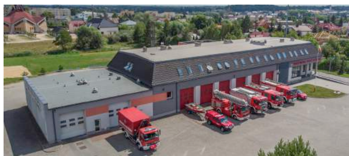
Budynek główny Komendy po termomodernizacji w 2015 r.

Z dniem 5 stycznia 2009 r. na stanowisko Komendanta Powiatowego Państwowej Straży Pożarnej w Lipnie powołany zostaje młodszy brygadier mgr inż. Ireneusz Poturalski, który w kolejnych latach prowadzi działania na rzecz modernizacji taboru samochodowego oraz wyposażenia w sprzęt i urządzenia ratownicze. W latach 2010-2019 oprócz inwestycji w sprzęt i wyposażenie Jednostki Ratowniczo-Gaśniczej nastąpił znaczny rozwój jednostek OSP KSRG. W okresie tym 8 jednostek OSP spośród 14 włączonych do Krajowego Systemu Ratowniczo-Gaśniczego, pozyskało nowe samochody ratowniczo-gaśnicze, co przełożyło się pozytywnie na wzmocnienie gotowości operacyjnej, a tym samym poprawę bezpieczeństwa w powiecie lipnowskim. Kolejnym dużym przedsięwzięciem zrealizowanym w 2015 r. było przeprowadzenie gruntownej termomodernizacji budynku Komendy Powiatowej PSP w Lipnie, której wartość wyniosła ponad 850 tys. zł.