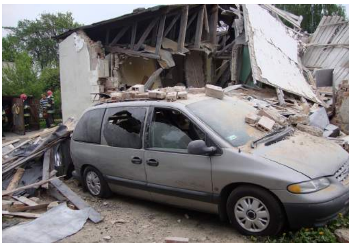
Wybuch gazu Lipno, ul. Komunalna

2) 3 sierpnia 2014 r., Trzcianka, gm. Tłuchowo. Pożar rżyska oraz pożar poszycia w lesie. Podano 8 prądów wody w natarciu na palące się rżysko oraz poszycie leśne, którymi pożar ugaszono. Spaleniu uległo 6 ha rżyska i 3 ha poszycia leśnego. W działaniach udział brało 9 zastępów straży pożarnej.