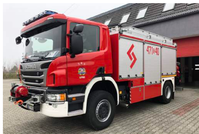
Samochód ratownictwa technicznego SRT Scania

Na wyposażeniu Komendy Powiatowej PSP w Lipnie znajduje się łącznie 9 samochodów o różnym przeznaczeniu oraz szereg sprzętu gaśniczego i specjalistycznego niezbędnego do prawidłowej realizacji zadań. Corocznie staraniem kierownictwa Komendy, sukcesywnie pozyskiwany jest nowy sprzęt ratowniczo-gaśniczy, który skutecznie podnosi poziom wyposażenia Jednostki Ratowniczo-Gaśniczej oraz efektywność i skuteczność prowadzonych działań.