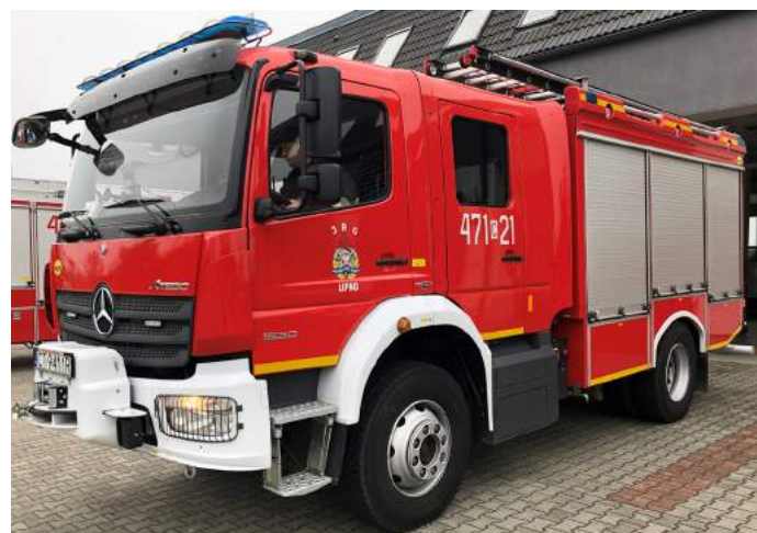
Średni samochód ratownictwa technicznego GBARt 2,516Mercedes