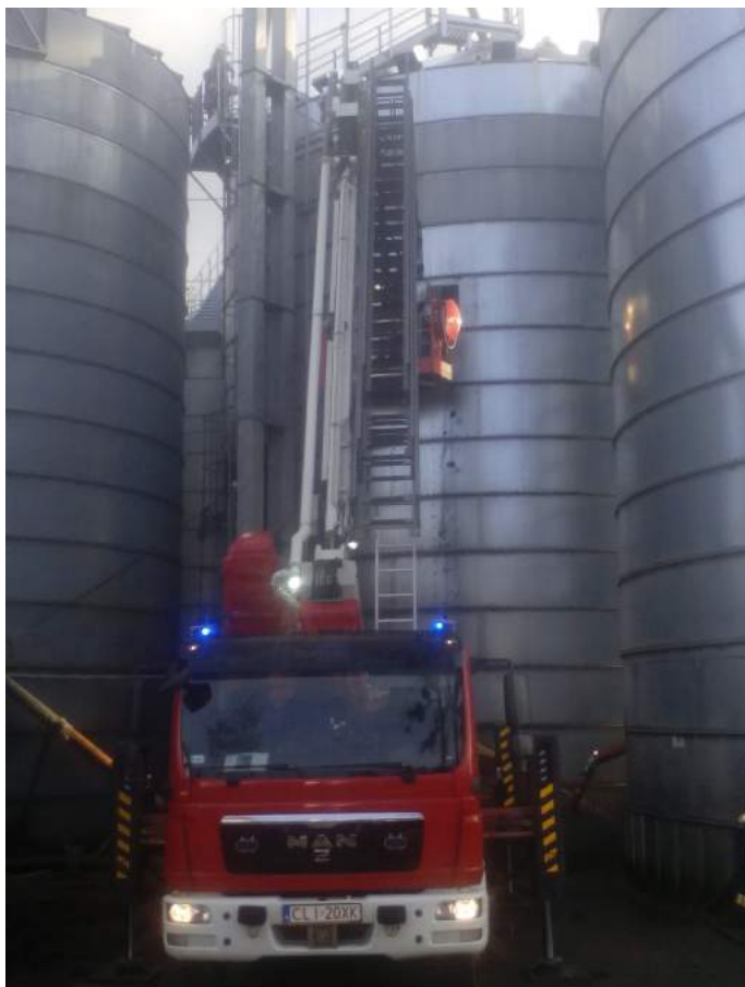
Pożar silosu, Chalin

7) 2-3 luty 2018 r., Chalin, gm. Dobrzyń nad Wisłą. Pożar rzepaku w silosie zbożowym. Pożar na wysokości ok. 12 m. Był to 2 w kolejności silos w kompleksie składającym się z 10 podobnych zbiorników. Wewnątrz silosu panowało zadymienie uniemożliwiające lokalizację źródła ognia. Obserwacja zbiornika przy pomocy kamery termowizyjnej, jak i organoleptyczne sprawdzenie temperatury powierzchni silosu, również nie wskazały miejsca pożaru. W celu dotarcia do potencjalnego miejsca pożaru w poszyciu zbiornika wycinano otwory, przez które wysypywano zboże. Po wysypaniu ziaren okazało się, że wewnątrz silosu tli się rzepak w postaci zbrylonej masy o kształcie wysokiej kolumny. Przy pomocy bosaka rozbijano i wygarniano zbrylony rzepak, gorące i tłące się grudy zalewano prądami wody. Wysypywany na zewnątrz rzepak wywożony był przy pomocy ładowarki teleskopowej, będącej własnością właściciela obiektu. Szukając alternatywnych sposobów ugaszenia zbrylonej zawartości silosu zadysponowano specjalistyczny samochód gaśniczy, wyposażony w system piany sprężonej CAFS. Działania ratownicze wykonywane były przez będące na miejscu zastępy OSP i JRG wymieniane po kilku godzinach pracy. W działaniach trwających ponad 25 godzin udział brało 14 zastępów straży pożarnej. Szacunkowe straty wyniosły 1.100 tys. zł, uratowano mienie wartości 400 tys. zł.