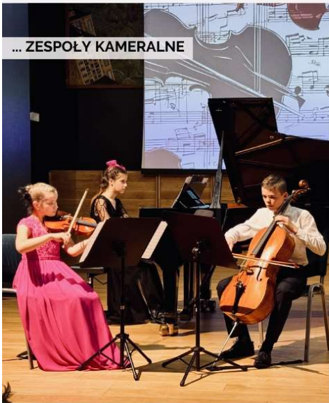
... ZESPOŁY KAMERALNE