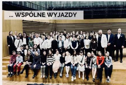
... WSPÓLNE WYJAZDY