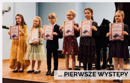
... PIERWSZE WYSTĘPY