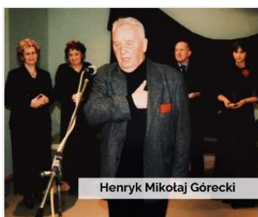
Henryk Mikołaj Górecki

Nieskromnie mówiąc Państwowa Szkoła Muzyczna I i II st. im. Karola i Antoniego Szafranków w Rybniku dąży do zapewnienia najwyższego poziomu kształcenia artystycznego, wspierając rozwój i pasję naszych uczniów, na miarę współczesnych czasów.