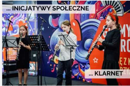
... INICJATYWY SPOŁECZNE