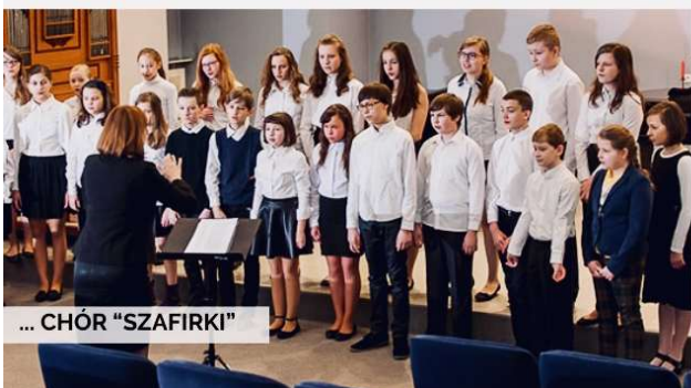
... CHÓR "SZAFIRKI"