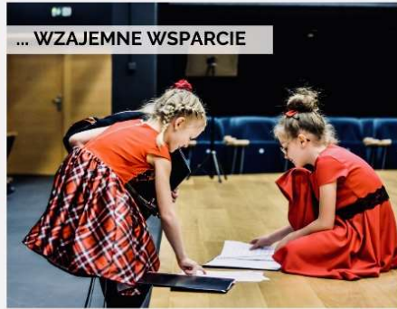
... WZAJEMNE WSPARCIE