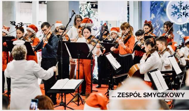
... ZESPÓŁ SMYCZKOWY