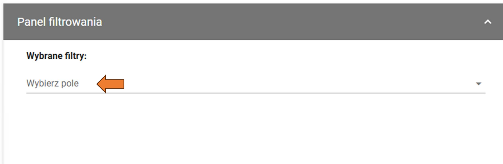
Rysunek 15 Panel filtrowania

Poniżej prezentowana jest tabela przedstawiająca możliwości filtrowania wydarzeń: