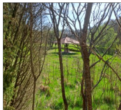
Widok na działkę nr 493