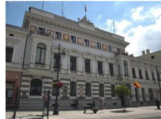
Łódzki Urząd Wojewódzki w Łodzi

Łódzki Urząd Wojewódzki w Łodzi jest na Piotrkowskiej 104