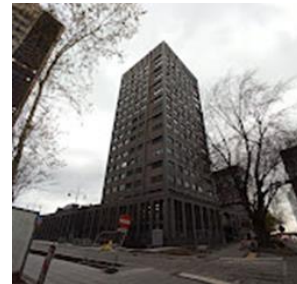
Wydział Spraw Obywatelskich i Cudzoziemców