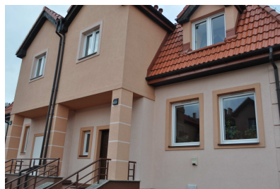
Filia Domu Dziecka Nr 3, ul. Suwalska 193/195 przeznaczona początkowo dla 10 wychowanków