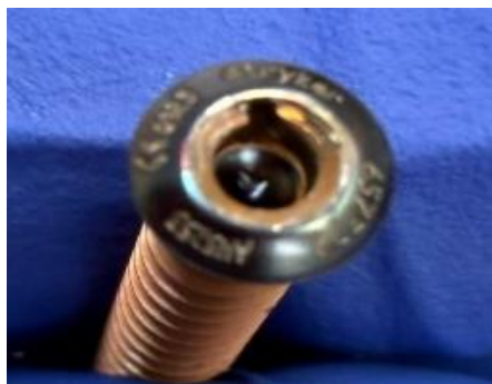
Ilustracja 1: Śruba VariAx 2 Locking Screw bez sześciokątnego wyżłobienia.

Zagrożeniem związanym z tym problemem jest utrata funkcjonalności implantu oraz utrudnione dokręcanie za pomocą odpowiedniego śrubokręta.