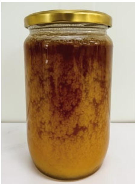
Miód częściowo skrysztalizowany

Obecność pęcherzyków powietrza czy zanieczyszczeń w miodzie, takich jak części roślin lub owadów mogą również działać jako „zarodki krystalizacji”, wpływając na przyspieszenie tworzenia kryształów w miodzie. Na krystalizację wpływa nie tylko obecność, ale i liczba centrów krystalizacji, głównie ziaren pyłku, dlatego też miód filtrowany ma znacznie mniejszą tendencję do krystalizacji.