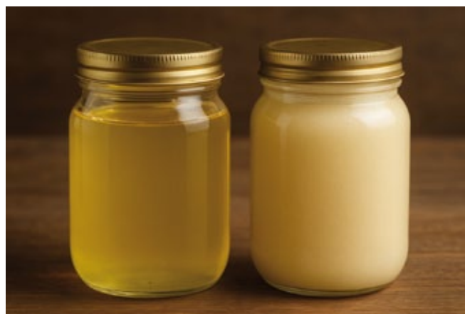
Miód przed i po krystalizacji

Krystalizacja miodu to jeden z najbardziej charakterystycznych i naturalnych procesów, który wpływa na wygląd, konsystencję i akceptację produktu przez konsumentów. Miód, który zbierany jest jako płynny, wkrótce staje się gęsty i nieprzejrzysty – nie świadczy to jednak o pogorszeniu wartości odżywczych, lecz o jego właściwościach fizykochemicznych. Miód jest w dużym uproszczeniu roztworem przesyconym cukrów, a każda substancja rozpuszczona w rozpuszczalniku powyżej jego nasycenia krystalizuje. Poznanie mechanizmu i czynników wpływających na krystalizację jest kluczowe dla pszczelarzy, przetwórców i technologów żywności, którzy dążą do kontrolowania tej cechy w procesach produkcyjnych i przechowalniczych, ale ważne jest też, żeby konsumenci rozumieli naturalność procesów zachodzących w miodzie w trakcie ich przechowywania.