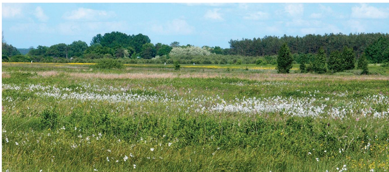
Mozaika torfowisk

Zbiorowiska roślinne torfowisk wysokich budowane są przez bardzo nieliczną, ekologicznie bardzo wyspecjalizowaną grupę roślin, głównie mchy (w tym torfowce), krzewinki, zielne byliny o trawiastym pokroju, sporadycznie gatunki krzewiaste i drzewiaste. Cechuje je stałe wysokie uwilgotnienie, często kwaśny odczyn. Obecnie głównym problemem, powodującym redukcję powierzchni torfowisk, jest zaniechanie ich użytkowania oraz odwadnianie. Tradycyjne użytkowanie polega na prowadzeniu ekstensywnej gospodarki łąkarskiej.