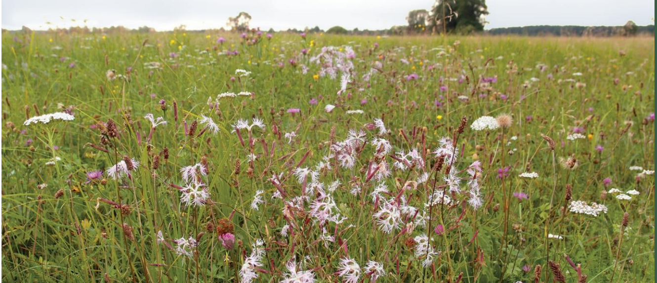
Łąka trzęślicowa

Zmiennowilgotne łąki trzęślicowe należą do najcenniejszych i obecnie najsilniej zagrożonych siedlisk łąkowych. Występują najczęściej na niewielkich wyniesieniach pośród bagien lub na ich obrzeżach, na siedliskach charakteryzujących się wysokim poziomem wód gruntowych wiosną. Najważniejszą cechą tych zbiorowisk jest zmienny poziom wody gruntowej – na początku okresu wegetacyjnego jest on bardzo wysoki i łąki mogą być zalane, a w lecie opada nisko, często poza zasięg systemu korzeniowego wielu roślin. Zagrożeniem dla omawianego typu łąk jest intensyfikacja użytkowania, pozostawianie skoszonej biomasy na łące oraz zmiany stosunków wodnych.