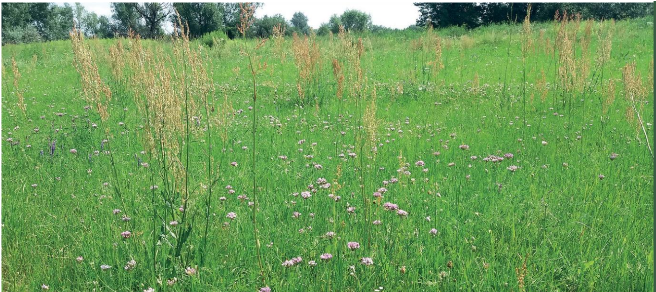
Łąka selernicowa

Łąki selernicowe należą do najcenniejszych półnaturalnych zbiorowisk roślinnych w Polsce. Najczęściej występują w dolinach dużych rzek, miejscach okresowo lub regularnie zalewanych. Słonorośla z kolei występują w zasięgu działania wód słonych i słonawych wód powierzchniowych lub podziemnych. Tradycyjna gospodarka na łąkach selernicowych i słonoroślach to ekstensywne użytkowanie kośne lub pastwiskowe lub kośno-pastwiskowe.