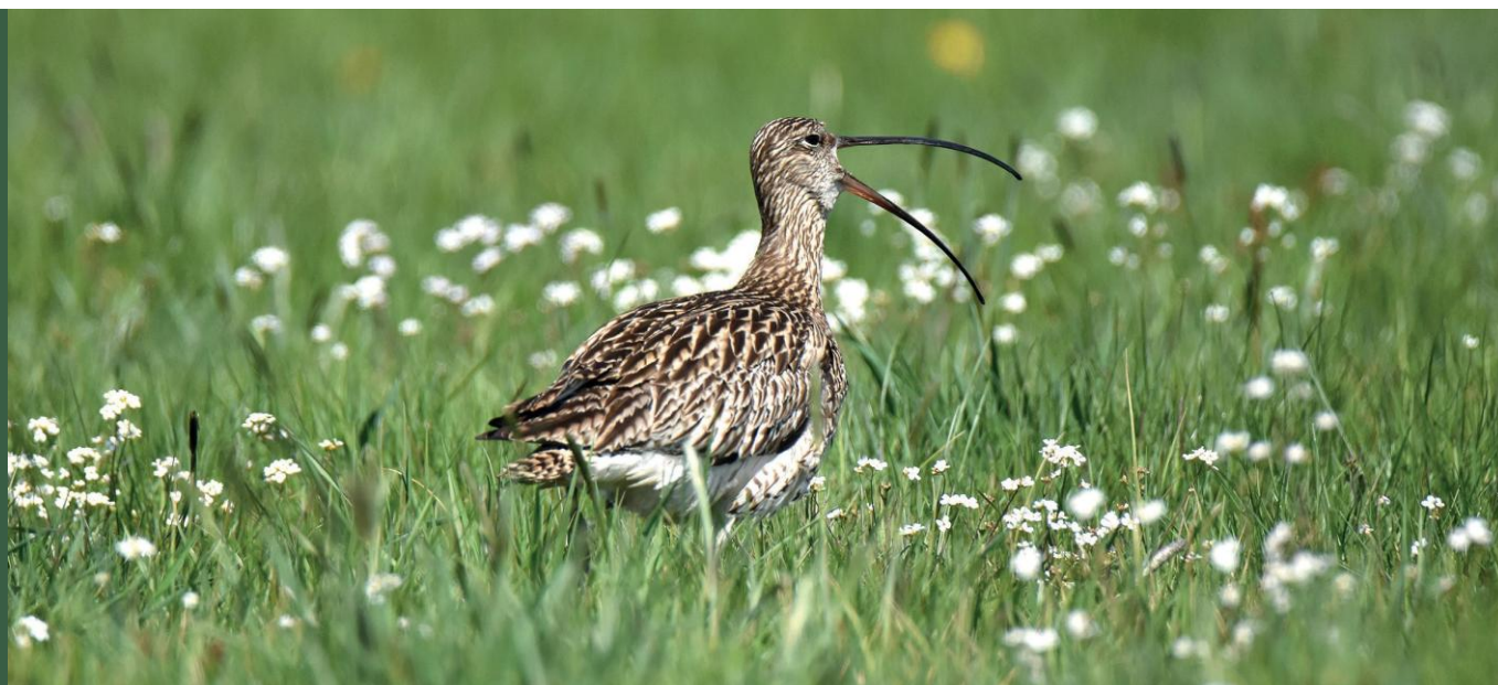
Kulik wielki