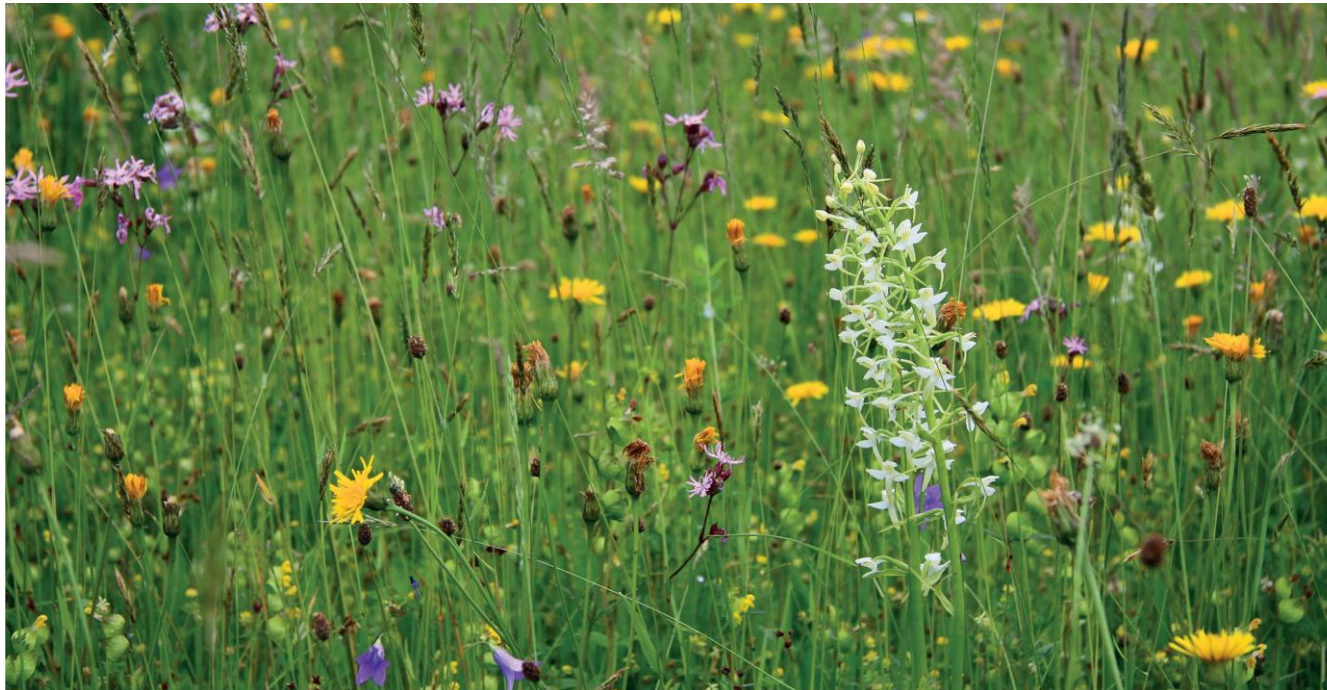
Łąka świeża

Łąki świeże to antropogeniczne zbiorowiska użytków zielonych wykształcone na żyznych, niezabagnionych siedliskach mineralnych. Należą one do najlepszych użytków zielonych pod względem gospodarczym. Zarówno ograniczenie użytkowania, jak i jego intensyfikacja prowadzi do przekształcania się łąk świeżych w inne typy użytków zielonych. Brak koszenia sprzyja odkładaniu się obumarłych szczątków roślin, co prowadzi do zubożenia składu gatunkowego. Pozostawianie skoszonego siana natomiast powoduje ekspansję wysokich bylin i eutrofizację siedliska. Tradycyjne użytkowanie polega przede wszystkim na dwukrotnym koszeniu.