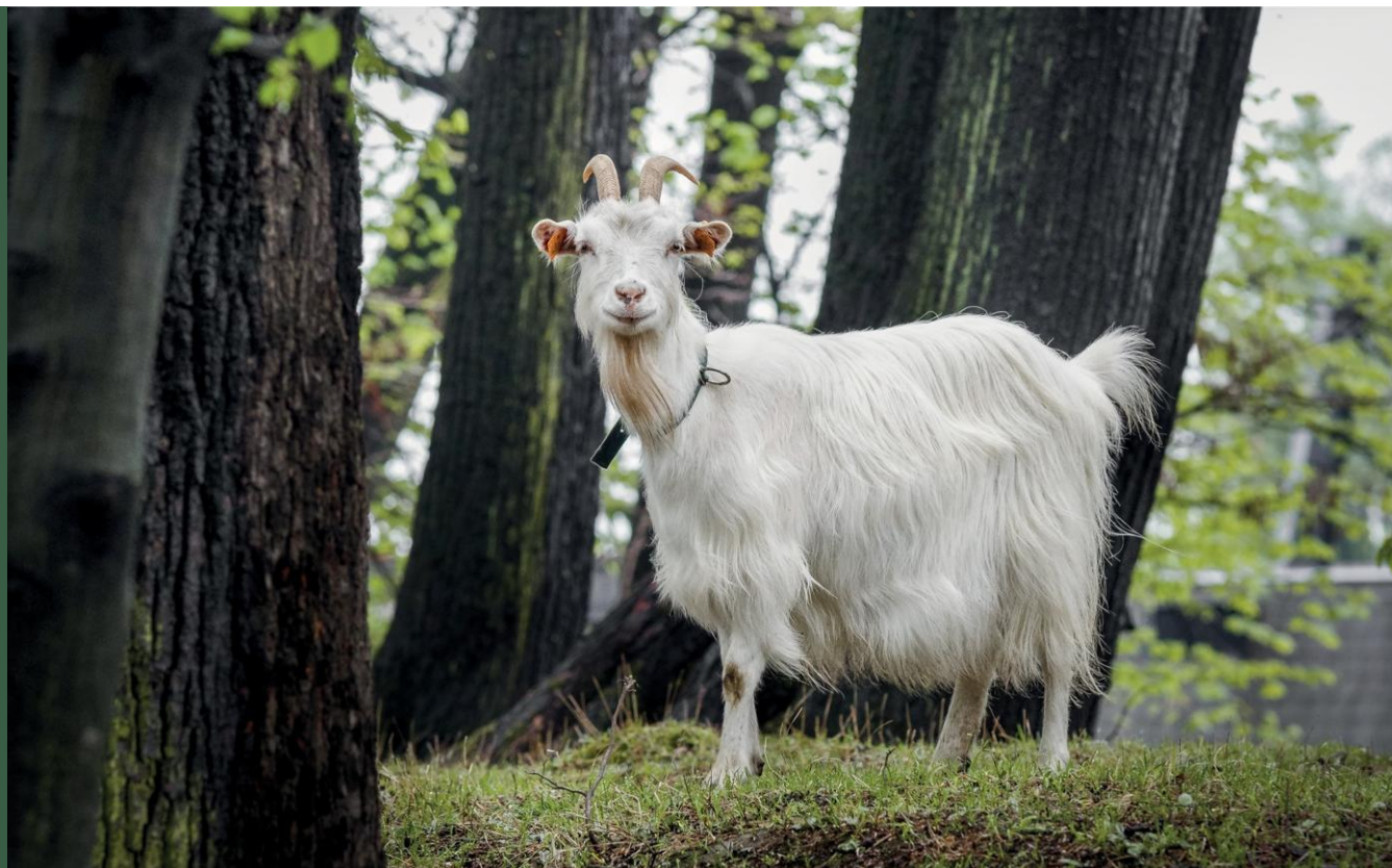
Koza karpacka

Kozy (wsparcie do samic; stawka płatności uwzględnia utrzymanie samców): kozy karpackie, kozy sandomierskie i kozy kazimierzowskie.