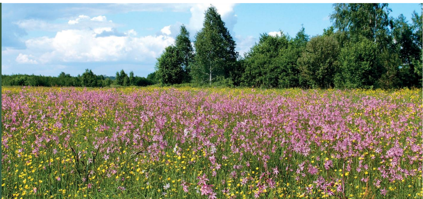
Łąka wilgotna

Cechą swoistą łąk wilgotnych jest duży udział okazałych bylin i ziołorośli. Pod względem gospodarczym należą one do ekstensywnych, dość wydajnych użytków zielonych. Zbiorowiska te powinny być koszone najwyżej dwa razy w roku. W miarę zwielokrotnienia koszenia wzrasta w składzie ich runi udział traw, ale zmniejsza się liczba gatunków. Tradycyjne użytkowanie polega na maksymalnie dwukrotnym koszeniu, ograniczonym nawożeniu oraz użytkowaniu kośnym, w uzasadnionych przypadkach kośno-pastwiskowym.