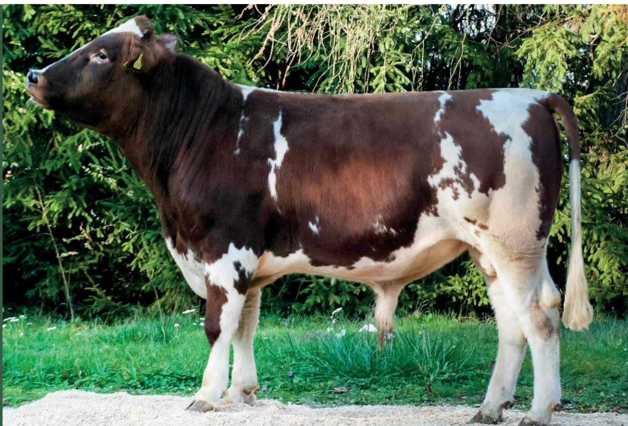
Buhaj rasy polskiej czerwono białej