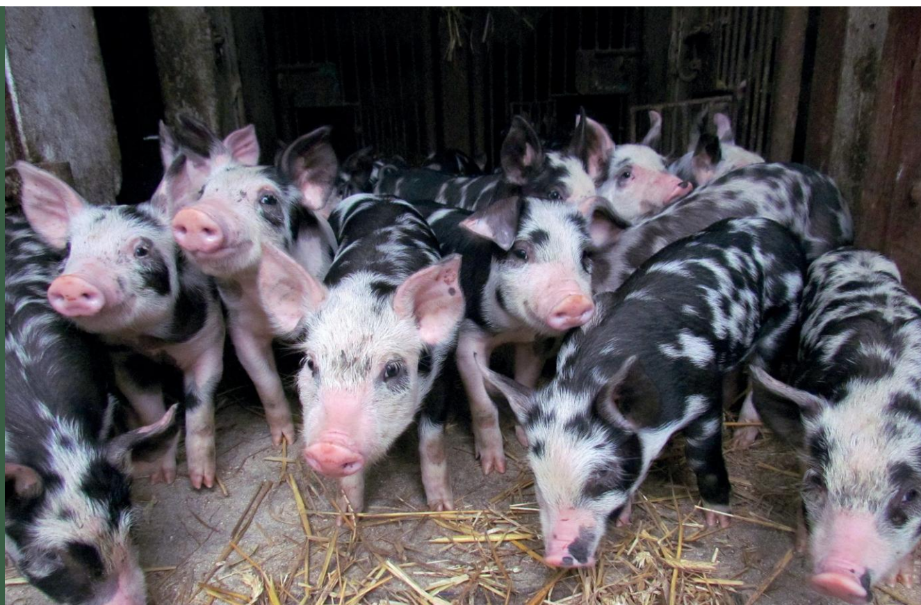
Świnie puławskie

Świnie (wsparcie do samic i samców): puławskie, złotnickie białe, złotnickie pstre.