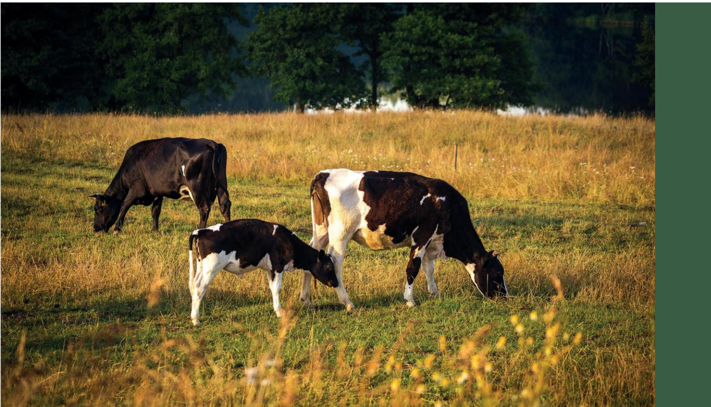
Łąka użytkowana ekstensywnie

Interwencję można wdrażać na trwałych użytkach zielonych położonych na obszarach Natura 2000, na których nie występują przedmioty ochrony wspierane w ramach Interwencji 1. Ochrona cennych siedlisk i zagrożonych gatunków na obszarach Natura 2000 (konkretne siedliska i gatunki ptaków) tj. położonych poza granicami warstw cyfrowych opracowanych przez GDOŚ lub GIOŚ. W interwencji tej beneficjenci zobowiązani są do realizacji wymogów związanych z ekstensywnym rolniczym użytkowaniem obejmującym w szczególności stosowanie odpowiedniej liczby pokosów, ekstensywny wypas zwierząt, dostosowanie terminu koszenia/wypasu do potrzeb ochrony przyrody.