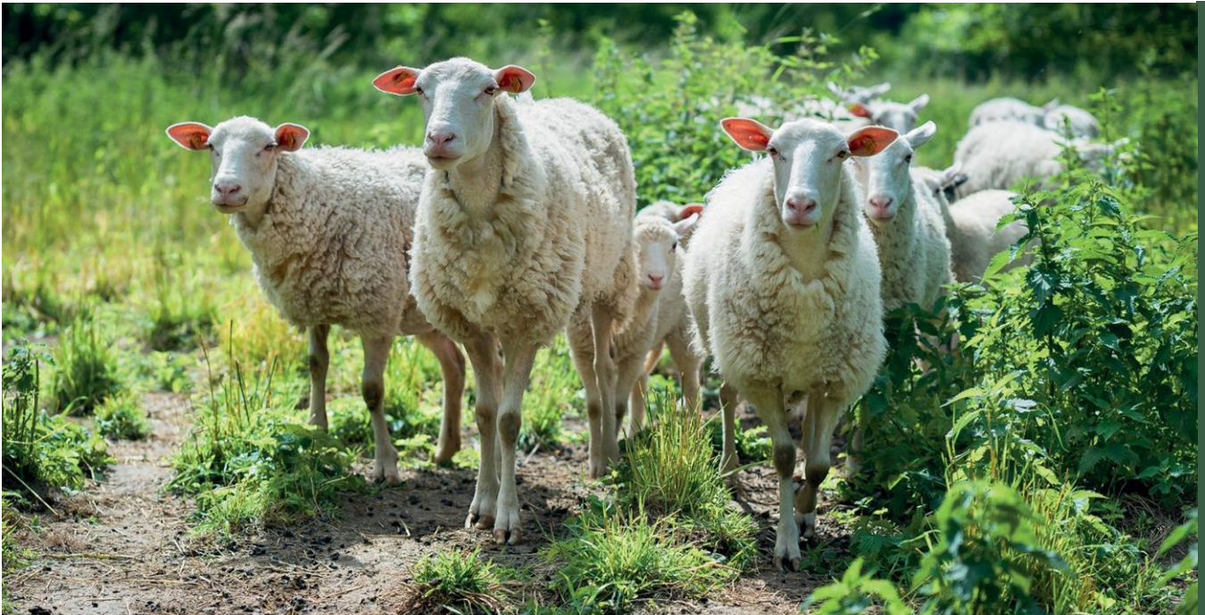
Owce olkuskie

Owce (wsparcie do samic; stawka płatności uwzględnia utrzymanie samców): wrzosówki, świniarki, olkuskie, polskie owce górskie odmiany barwnej, merynosy odmiany barwnej, uhruskie, wielkopolskie, żelaźnieńskie, korideil, kamienieckie, pomorskie, cakle podhalańskie, merynosy polskie w starym typie, czarnogłówki, polskie owce pogórza, polskie owce górskie i białołowe owce mięsne.