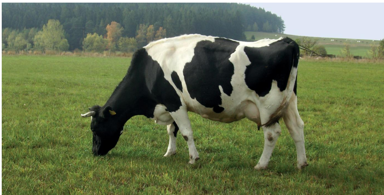
Krowa rasy polskiej czarno-białej

Bydło (wsparcie do samic i samców w użytkowaniu mlecznym i mięsnym): polskie czerwone, biało-żółte, polskie czerwono-białe, polskie czarno-białe.