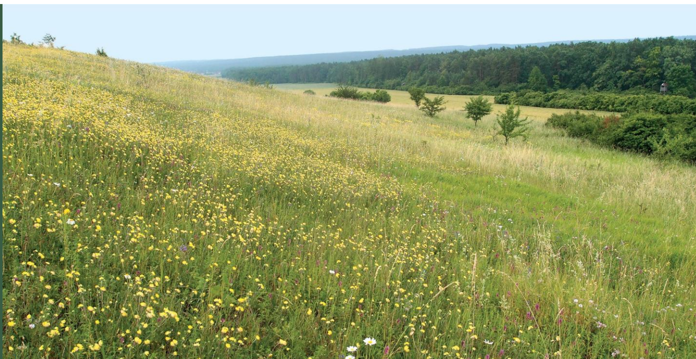
Murawy kserotermiczne

Murawy to ciepłolubne zbiorowiska trawiaste o wyraźnie kępowej budowie oraz bogatym i zróżnicowanym składzie gatunkowym. Są to jedne z najrzadszych zbiorowisk roślinnych Polski o szczególnym znaczeniu dla zachowania różnorodności biologicznej. Zachowanie ciepłolubnych muraw napiaskowych zależy w dużej mierze od ekstensywnej gospodarki pasterskiej.