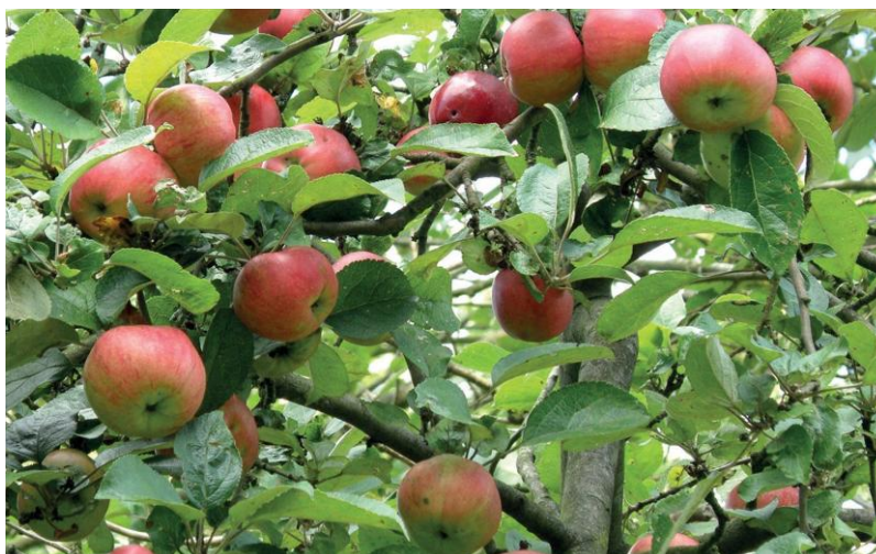
Kantówka Gdańska

W ramach zobowiązania beneficjent musi utrzymywać sad, w którym jest co najmniej 12 starych, tj. co najmniej 15-letnich drzew, z czterech różnych odmian lub gatunków, rozmnażanych