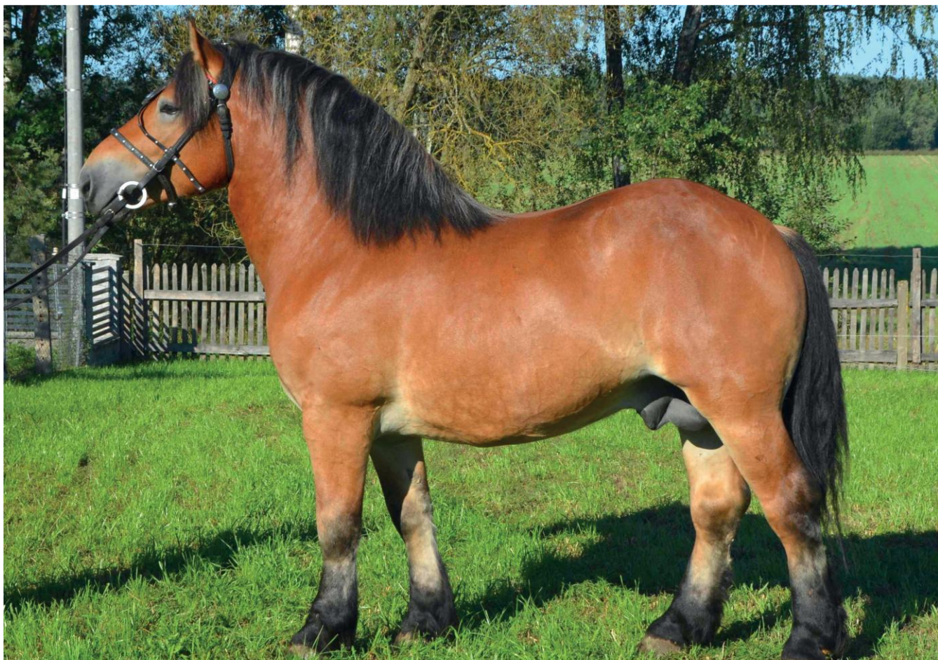
Ogier sokólski

Konie (wsparcie do samic i samców): huculskie, małopolskie, śląskie, wielkopolskie, sokólskie, sztumskie oraz koniki polskie.