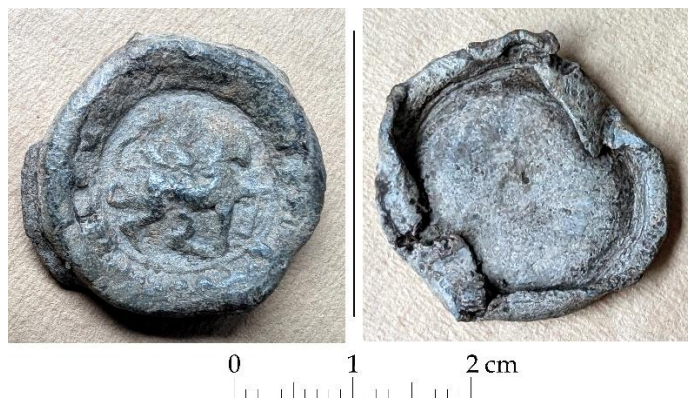
Ryc. 1 – ołowiany kapsel pojemnika leku theriaca z Rębowa (nr inw. A.296).

Teriak największą popularność w Europie osiągnął w XVI i XVII wieku. Przygotowywano go w wielu miastach, zazwyczaj publicznie, raz w roku, w obecności władz oraz mieszkańców. Był to farmaceutyk bardzo drogi jak na ówczesne czasy, poszukiwany w całej Europie, zwłaszcza w okresach zarazy. Theriaka stała się jednym z głównych źródeł dochodu dla niektórych państw i miast włoskich, takich jak Republika Wenecka, Neapol i Bolonia.