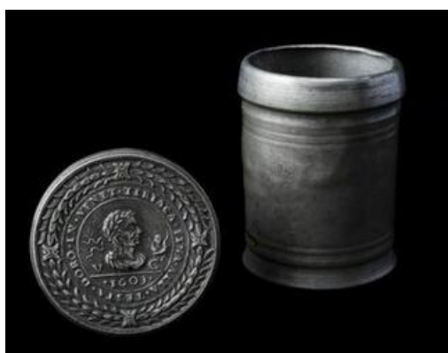
Ryc. 2 – przykład ołowianego pojemnika na teriak - theriaca testa d'oro , Wenecja.

Szczególną renomą cieszył się teriak wenecki, dlatego zachowywano daleko posuniętą ostrożność, aby nie dochodziło do oszustw ani uchybień w produkcji tego medykamentu. Nadzór nad jego wytwarzaniem powierzano specjalnym radom (kolegiom) lub najlepszym aptekarzom (por. CROSTA 2025, 17; MASSEI, 3; VINCENTI 2021/2022, 44-45).