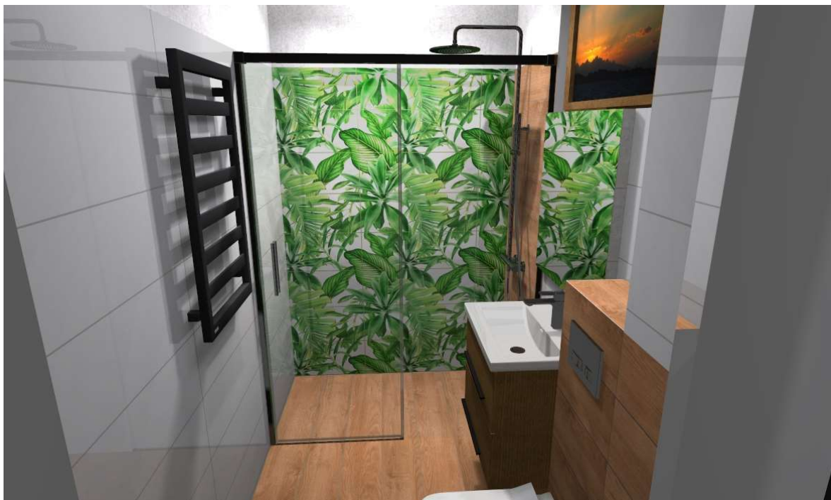
Wiz.2 Widok łazienki