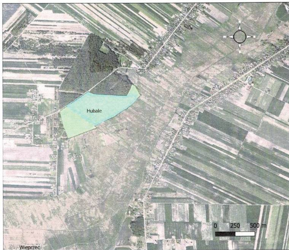
Mapa z lokalizacją działań ochronnych w rezerwacie przyrody „Hubale”

Załącznik nr 3 do zarządzenia nr 1312026 Regionalnego Dyrektora Ochrony Środowiska w Lublinie z dnia 18 czerwca 2026 r.