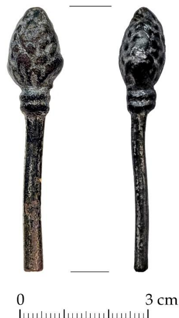
Ryc. 3. Łyżka zakończona guzkiem z Rębowa, gm. Kije. nr inv. A.326

Masowa w zachodniej Europie produkcja łyżek oraz długotrwałe użytkowanie form odlewniczych prowadziły do ujednoczenia sposobu przedstawiania apostołów. Identyfikację poszczególnych postaci utrudnia dodatkowo fakt, że poszczególni apostołowie bywali ukazywani z różnymi atrybutami. Przedstawienie apostoła na łyżce z Kulczyzny nie posiada czytelnego atrybutu. W prawej ręce dostrzec można element przypominający księgę lub skrzynkę, która sugerowałaby, że figurka przedstawia postać Judasza Iskarioty – taki wybór patrona dla nowonarodzonego dziecka wydaje się jednak nader niefortunny.