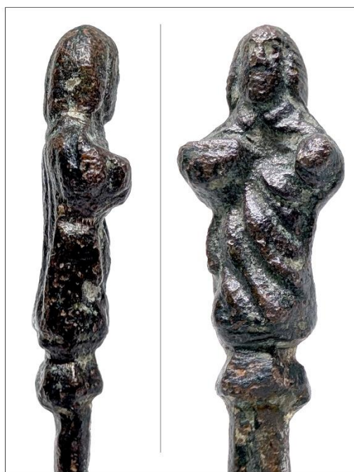
Ryc. 1. Łyżka apostolska z Kulczyzny, gm. Jędrzejów. nr inv. A.325 Ryc. D. Czernek.

Figurka stanowi zwieńczenie szczątkowo zachowanej rączki łyżki należącej do grupy tzw. łyżek apostolskich. Tego rodzaju łyżki, zdobione przedstawieniami dwunastu apostołów, były rozpowszechnione w późnośrednio-wiecznej Europie Zachodniej, szczególnie w Anglii. Produkowano je także w Niderlandach, Niemczech, Szwajcarii oraz we Włoszech (RUPERT 1929, 5). Przyjmuje się, że mogły być wytwarzane również w lokalnych warsztatach (IMMONEN 2002, 55). Łyżki apostolskie ozdobiły