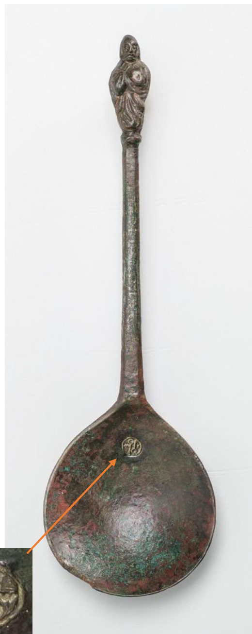
Ryc. 2. Łyżka apostolska (długość 17,9 cm) z nabitym stemplem angielskiego wytwórcy (inicjały „IW” oraz dwie skrzyżowane łyżki), datowana na połowę XVII wieku, odkryta w Sendenhorst (Nadrenia Północna-Westfalia). fot.: LWL-Archeologia Westfalii / S. Brentführer. Za: HOLTFESTER, THIER 2024, 181, Abb. 3.

figurki dwunastu apostołów oraz Chrystusa i Marii (IMMONEN 2002, 57). Były to luksusowe wyroby rzemieślnicze, wykonywane głównie ze srebra lub różnych stopów miedzi. Często stanowiły dar chrzestnych z okazji chrztu, a przedstawiony święty odpowiadał patronowi ochrzczonego dziecka (HOLTFESTER, THIER 2024, 181; IMMONEN 2002, 56). Świadectwem tego zwyczaju jest popularne w Anglii powiedzenie „urodzić się ze srebrną łyżeczką w ustach” znaczącym tyle co urodzić się w bogatej, uprzywilejowanej rodzinie.