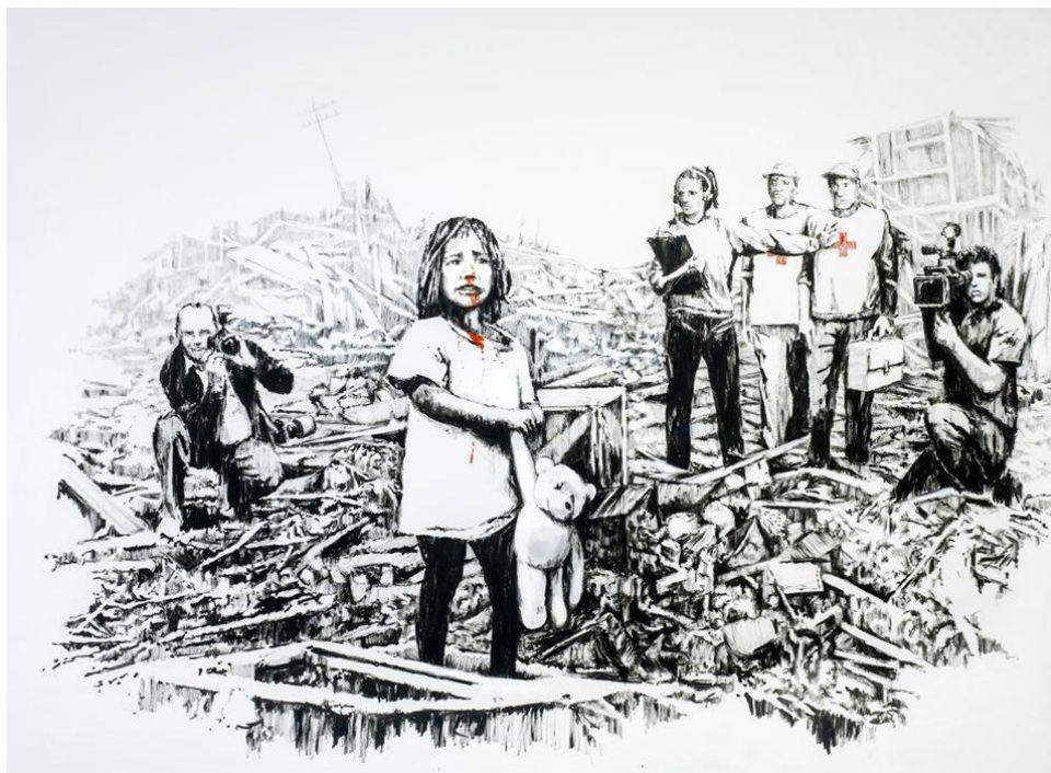
Banksy*, Media canvas . 2006. Wystawa The Art of Banksy. Without Limits , Warszawa 2021.

*Banksy – anonimowy brytyjski artysta sztuki ulicznej (street-artu), prowokator znany na całym świecie.