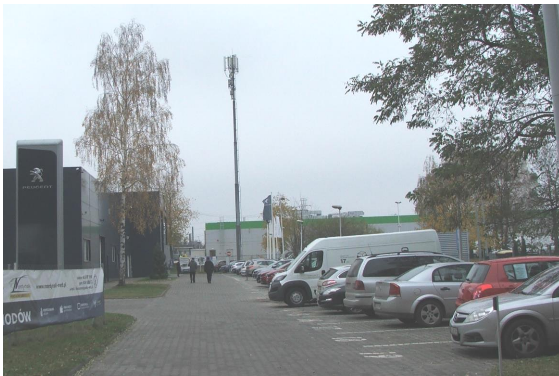
Fot. 1: Widok anten stacji bazowej: ID: LOD1103B zlokalizowanej przy ul. Snowalnianej 3 w Łodzi