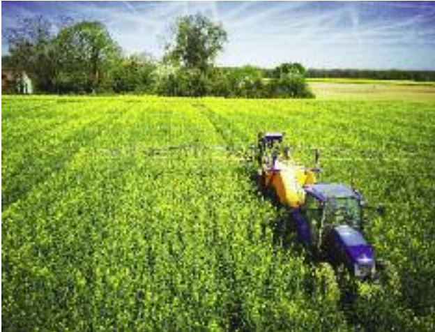
Produkowana w Polsce żywność jest wolna od przekroczeń najwyższych dopuszczalnych poziomów pozostałości środków ochrony roślin, a więc jest w pełni bezpieczna dla konsumenta

nych metod ochrony roślin, pozwoli na zmniejszenie zależności produkcji roślinnej od chemicznych środków ochrony roślin, co w efekcie pozwoli ograniczyć ryzyko związane z ich użyciem. Realizacja planu zapewni zatem bezpieczeństwo konsumentów produktów rolnych oraz poprawi jakość życia na terenach rolniczych, na których użycie tych preparatów jest najwyższe.