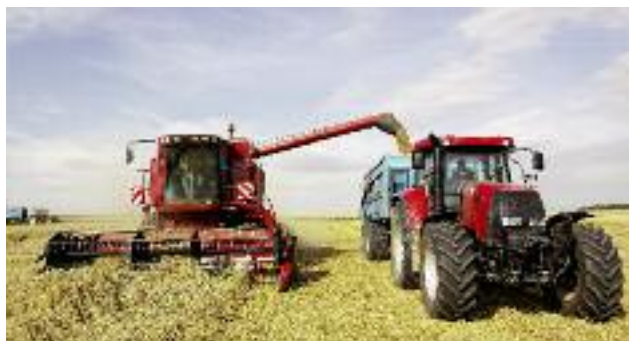
Opracowywana w MRiRW ustawa o spółdzielniach rolników przyczyni się do poprawy efektywności gospodarowania na obszarach wiejskich oraz zwiększy poziom zorganizowania producentów rolnych

ści, stwarza realne szanse na aktywność gospodarzą i społeczną poprzez budowanie spójności i integralności społecznej obszarów wiejskich. Ponadto, wnosi ona do gospodarki rynkowej czynniki poprawiające funkcjonowanie rynku, takie jak: aktywizowanie zdrowej konkurencji czy wzmacnianie pozycji rynkowej podmiotów o relatywnie niższym potencjale ekonomicznym poprzez stwarzanie im możliwości szerszego uczestniczenia w obrocie gospodarczym.