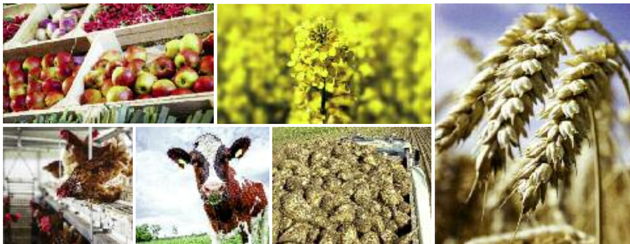
Opracowany w MRiRW „Program rozwoju głównych rynków rolnych w Polsce na lata 2016-2020” koncentruje się na dziewięciu głównych rynkach rolnych: zbóż, rzepaku, wieprzowiny, wołowiny, drobiu, mleka i przetworów mlecznych, cukru, owoców i warzyw oraz tytoniu

Istotne będzie podejmowanie skoordynowanych działań w celu zagwarantowania zestawu narzędzi zarządzania ryzykiem w produkcji rolnej i stabilizujących dochody. Skracanie łańcucha dostaw realizowane będzie poprzez: rozwój lokalnych rynków rolnych, rolniczego handlu detalicznego, sprzedaży bezpośredniej, sprzedaży produktów pochodzenia zwierzęcego w ramach działalności marginalnej, lokalnej i ograniczonej (MOL), w tym poprzez: znoszenie barier administracyjnych, promocję lokalnych produktów, budowę internetowego portalu sprzedaży produktów zbywanych w ramach rolniczego handlu detalicznego, sprzedaży bezpośredniej, budowę infrastruktury technicznej lokalnych rynków, budowę struktur ułatwiających koncentrację podaży i popytu.