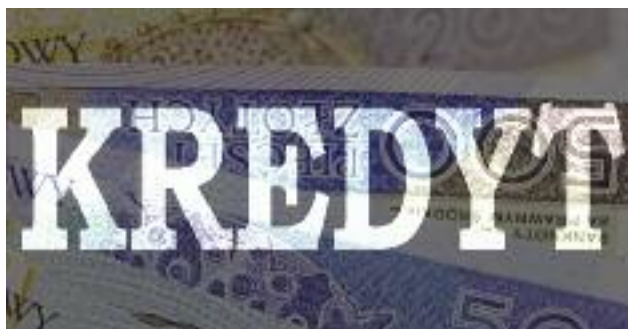
Jedną z form pomocy zadłużonym gospodarstwom rolnym będzie udzielanie przez ARiMR pożyczek na spłatę zadłużenia

Restrukturyzacją objęte będą podmioty prowadzące gospodarstwa rolne, które są niewypłacalne w rozumieniu przepisów ustawy z dnia 28 lutego 2003 r. Prawo upadłościowe (Dz. U. z 2017 r. poz. 2344) lub są zagrożone niewypłacalnością w rozumieniu przepisów ustawy z dnia 15 maja 2015 r. prawa restrukturyzacyjne (Dz. U. z 2017 r. poz. 1508).