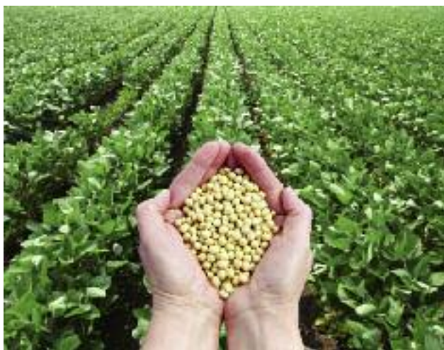
W 2017 r. powołany został w MRiRW „Zespół do spraw alternatywnych źródeł białka”