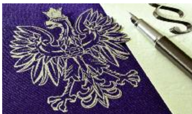
Założenia „Paktu dla obszarów wiejskich na lata 2017-2020 (2030)” zostały przyjęte we wrześniu ub.r.

We wrześniu 2017 r. Kierownictwo MRiRW przyjęło założenia Paktu dla obszarów wiejskich na lata 2017-2020 (2030) . Dokument ten ma integrować w sposób kompleksowy działania systemowe (zmiany legislacyjne, instytucjonalne, programowe) oraz inwestycyjne, związane z procesem zarządzania obszarami wiejskimi. Pakt będzie prezentował projekty strategiczne, jakie planują realizować różne resorty, w tym MRiRW, w kolejnych latach. Będą to zarówno projekty wskazane już w SOR, jak również nowe projekty.