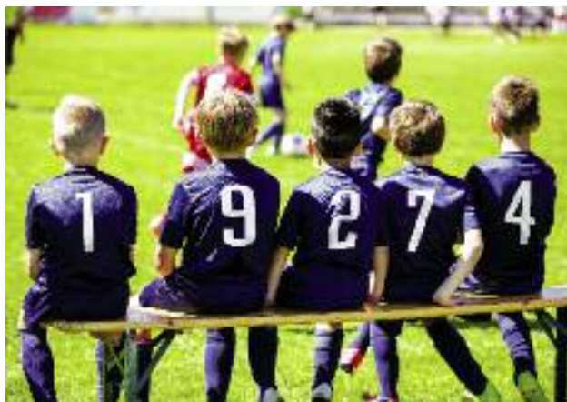
Na nieodpłatnie przekazanych samorządom przez KOWR gruntach mogą być realizowane m.in. przedsięwzięcia w zakresie kultury fizycznej i sportu tj. boiska sportowe, siłownie plenerowe, ścieżki edukacyjne

Ożywienie małych miast, będzie się mogło odbywać również z udziałem Krajowego Ośrodka Wsparcia Rolnictwa. Jednym z działań, które w dalszym ciągu będą podejmowane przez KOWR, jest nieodpłatne przekazywanie mienia wchodzącego w skład Zasobu Własności Rolnej Skarbu Państwa na rzecz jednostek samorządu terytorialnego. W ramach prowadzonych przez KOWR działań, władze samorządowe będą mogły realizować przedsięwzięcia ukierunkowane na poprawę warunków bytowych lokalnego społeczeństwa. W szczególności,