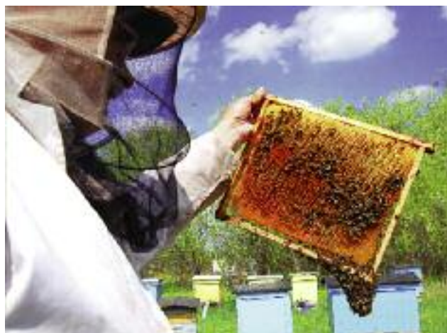
Trwa realizacja „Krajowego programu wsparcia pszczelarstwa w Polsce na lata 2016/2017, 2017/2018, 2018/2019”

Trwa realizacja Krajowego programu wsparcia pszczelarstwa w Polsce na lata 2016/2017; 2017/2018; 2018/2019 . Beneficjentami pomocy są gospodarstwa pasieczne i indywidualni pszczelarze.