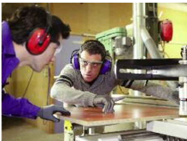
Celem głównym projektu „Nowe szanse dla wsi” jest aktywizacja zawodowa rolników oraz osób związanych z rolnictwem dla potrzeb pozarolniczego rynku pracy

W realizację przedmiotowego projektu strategicznego zaangażowane jest Ministerstwo Inwestycji i Rozwoju