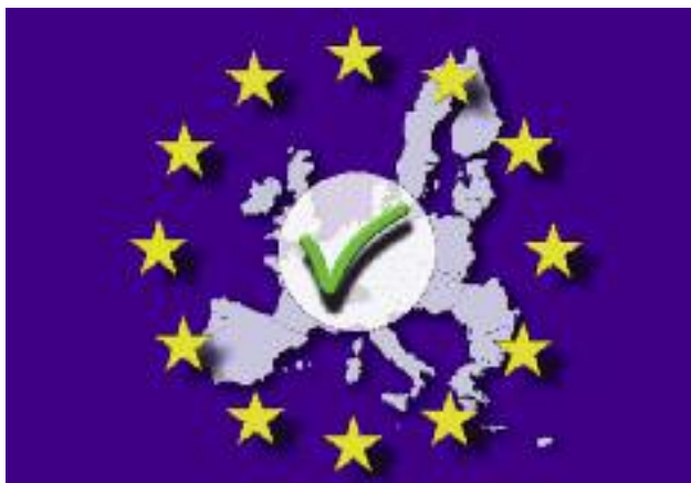
Projekty aktów prawnych dotyczące przyszłej WPR przedstawione zostaną jeszcze w pierwszej połowie 2018 r.

Opublikowany przez KE w listopadzie 2017 r. komunikat pn. Przyszłość żywności i rolnictwa UE (COM (2017) 713) rozpoczął formalną dyskusję pomiędzy instytucjami UE na temat kierunków zmian WPR po roku 2020. W pierwszym półroczu 2018 r. MRiRW będzie aktywnie uczestniczył w zaplanowanej przez Prezydencję bułgarską dyskusji na forum Rady UE ds. Rolnictwa i Rybołówstwa nad tym dokumentem i zawartymi w nim propozycjami. MRiRW zabiegać będzie, aby dyskusja ta została odpowiednio podsumowana (najlepiej w for-