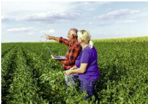
Zgodnie z przepisami UE od 2018 r. wszystkie wnioski o przyznanie płatności bezpośrednich oraz płatności obszarowych w ramach PROW muszą być składane na elektronicznym formularzu geoprzestrzennego wniosku

Jednym z ważniejszych wyzwań 2018 r. jest przeprowadzenie kampanii elektronicznego składania wniosków obszarowych (tj. wniosków o przyznanie płatności bezpośrednich oraz płatności obszarowych w ramach PROW). Zgodnie z przepisami UE 1 wymagane jest bowiem, aby od 2018 r. wszystkie wnioski o przyznanie pomocy w ramach systemów pomocy obszarowej oraz wnioski o płatność w ramach środków wsparcia obszarowego były składane na elektronicznym formularzu geoprzestrzennego wniosku (GSAA).