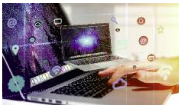
Komisja Europejska w swoim programie prac wskazuje na konieczność stworzenia warunków do budowania społeczeństwa informacyjnego na obszarach wiejskich

Priorytety wyznaczone przez Radę Europejską oraz program prac Komisji Europejskiej determinują także główne tematy współpracy z państwami UE w formule dwu- i wielostronnej (poszerzona Grupa Wyszehradzka, Trójkąt Weimarski, państwa nadbałtyckie). Dialog dwu- i wielostronny służy pogłębianiu współpracy między krajami naszego regionu, wymianie informacji, zbliżaniu stanowisk celem wspólnego występowania na forum UE w ważnych dla regionu kwestiach, na rzecz osiągnięcia wspólnych celów lub rozwiązania wspólnych problemów w obszarze rolnictwa, a także wpływa na umacnianie się pozycji naszego regionu Europy podczas dyskusji na forum UE.