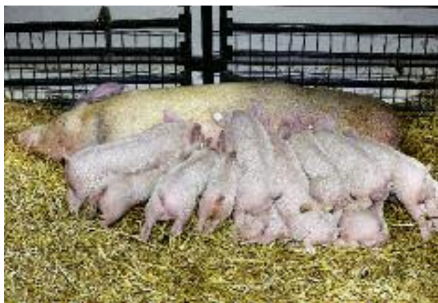
W zależności od rozwoju sytuacji na rynku wieprzowiny w Polsce, Minister Rolnictwa podejmował będzie działania na forum unijnym i krajowym mające na celu jej stabilizację

W związku ze spadkiem cen żywca wieprzowego Minister Rolnictwa i Rozwoju Wsi będzie regularnie omawiał na posiedzeniach Rady Ministrów ds. Rolnictwa i Rybołówstwa sytuację na rynku wieprzowiny.