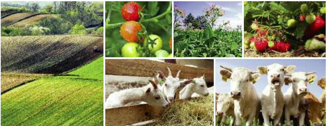
W latach 2018-2019 rolnicy nadal będą mogli ubiegać się o przyznanie m.in.: jednolitej płatności obszarowej, płatności za zazielenienie, płatności dla młodych rolników, płatności dodatkowej, płatności związanych z produkcją do upraw oraz płatności związanych z produkcją do zwierząt

Ponadto z II filaru WPR kontynuowane będą płatności w ramach działań obszarowych PROW: Płatności dla obszarów z ograniczeniami naturalnymi lub innymi szczególnymi ograniczeniami, Działanie rolno-środo-