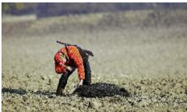
W związku z koniecznością ograniczania zagrożeń epizootycznych wynikających z wystąpienia na terenie Polski afrykańskiego pomoru świń, prowadzona jest w sposób ciągły redukcja populacji dzików