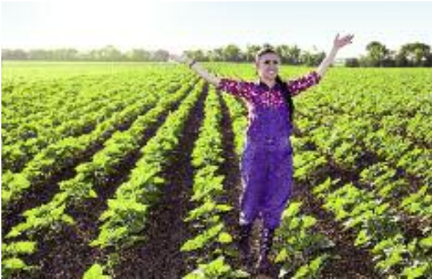
Po przeprowadzeniu uzgodnień z reprezentantami producentów rolnych utworzony zostanie w roku bieżącym jeden fundusz stabilizacji przychodów producentów owoców i warzyw

twórstwa czy też świadczyć usługi na rzecz swoich członków związane z wytwarzaniem przez nich produktów. Instrumentem mającym zachęcać producentów rolnych do zakładania spółdzielni rolników ma być m.in. możliwość skorzystania z określonych zwolnień podatkowych. Oczekuje się, że wprowadzenie nowych rozwiązań pozwoli na poprawę efektywności gospodarowania na obszarach wiejskich.