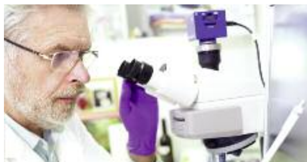
Nadzorowane przez Ministra Rolnictwa i Rozwoju Wsi instytuty badawcze realizują m.in. zadania w formie 8 programów wieloletnich

Zaplecze badawcze resortu rolnictwa jest dobrze ocenione przez Komisję Ewaluacji Jednostek Naukowych i Ministra Nauki i Szkolnictwa Wyższego. Z obecnie nadzorowanych przez Ministra Rolnictwa i Rozwoju Wsi 10 instytutów badawczych, aż 5 z nich zostało zakwalifikowanych do kategorii A, a wśród nich 1 ma najwyższą kategorię A+. Ponadto 6 instytutów resortu posiada status Państwowego Instytutu Badawczego, który nadaje się ustawą dla najlepszych jednostek naukowych.