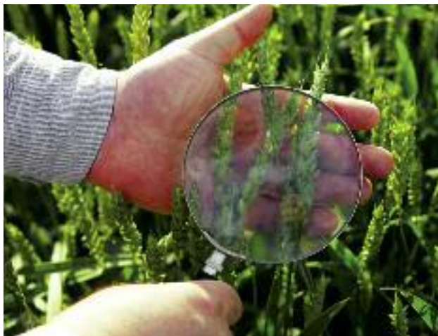
„Program wsparcia hodowli roślin w Polsce” będzie realizowany w pierwszym etapie do roku 2020, z perspektywą do roku 2030

nostki naukowo-badawcze prowadzące hodowlę roślin tj. IHAR – PIB, Instytut Ogrodnictwa, Instytut Uprawy Nawożenia i Gleboznawstwa – PIB, Instytut Włókien Naturalnych i Roślin Zielarskich oraz jednostki i organizacje współpracujące: Centralny Ośrodek Badania Odmian Roślin Uprawnych, Państwowa Inspekcja Ochrony Roślin i Nasiennictwa, Izby Rolnicze i Polska Izba Nasienna.