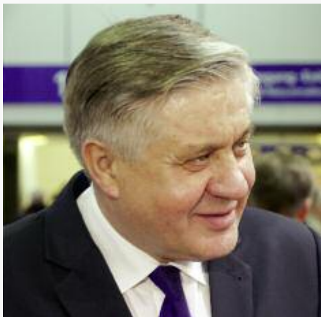
Krzysztof Jurgiel, minister rolnictwa i rozwoju wsi