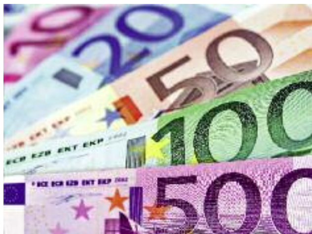
W maju 2018 r. KE przedstawi propozycję dotyczącą alokacji środków budżetu UE na realizację polityki rozwoju obszarów wiejskich na lata 2021-2027

Ministerstwo Rolnictwa i Rozwoju Wsi (MRiRW) będzie brało aktywny udział w procesie negocjacji WRF, przede wszystkim przez zaangażowanie w prace działającego w ramach Komitetu do Spraw Europejskich (KSE) Zespołu roboczego do spraw przeglądu Wieloletnich Ram Finansowych budżetu UE na lata 2014-2020 i negocjacji Wieloletnich Ram Finansowych po 2020 r. MRiRW wspierać będzie Ministerstwo Spraw Zagranicznych (wiodące dla spraw WRF) w dyskusji na forum instytucji UE (Rada Europejska i Rada UE). Resort śledzić