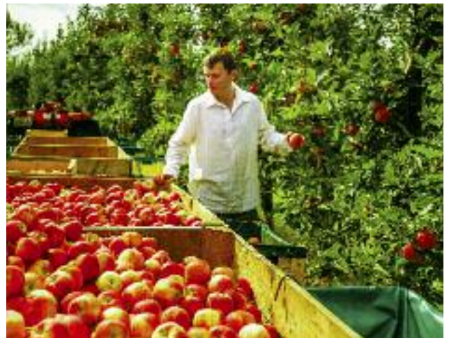
Przyjęta w lipcu 2017 r. ustawa o przeciwdziałaniu nieuczciwemu wykorzystywaniu przewagi kontraktowej w obrocie produktami rolnymi i spożywczymi stanowi jedną z szeregu inicjatyw ustawodawczych, mających na celu wzmocnienie pozycji rolnika w łańcuchu dostaw żywności

kłada się na dochodowość w rolnictwie. Z dniem 12 lipca 2017 r. weszła w życie ustawa o przeciwdziałaniu nieuczciwemu wykorzystywaniu przewagi kontraktowej w obrocie produktami rolnymi i spożywczymi. Ustawa, w celu ochrony interesu publicznego, określa zasady przeciwdziałania praktykom polegającym na nieuczciwym wykorzystywaniu przewagi kontraktowej przez nabywców produktów rolnych lub spożywczych lub dostawców tych produktów. Stanowi ona jedną z szeregu inicjatyw ustawodawczych mających na celu wzmocnienie pozycji rolnika w łańcuchu dostaw żywności.