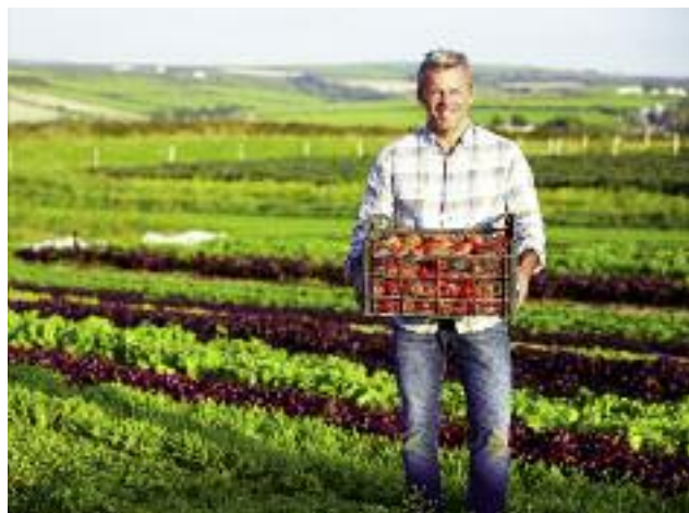
Naturalne metody produkcji stosowane przez gospodarstwa rodzinne umożliwiają szeroki rozwój rolnictwa ekologicznego w Polsce

Wsparcie sektora rolnictwa ekologicznego realizowane jest poprzez wsparcie producentów rolnych w ramach działań Programu Rozwoju Obszarów Wiejskich na lata 2014-2020 (PROW 2014-2020), jak i rozwój nauki służącej rolnictwu ekologicznemu – corocznie dotowane są badania prowadzone na rzecz tego sektora.