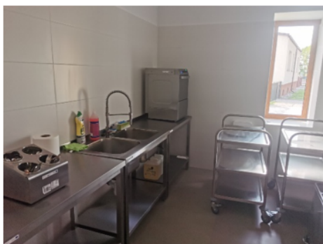
Zdjęcie nr 4 - Zmywalnia