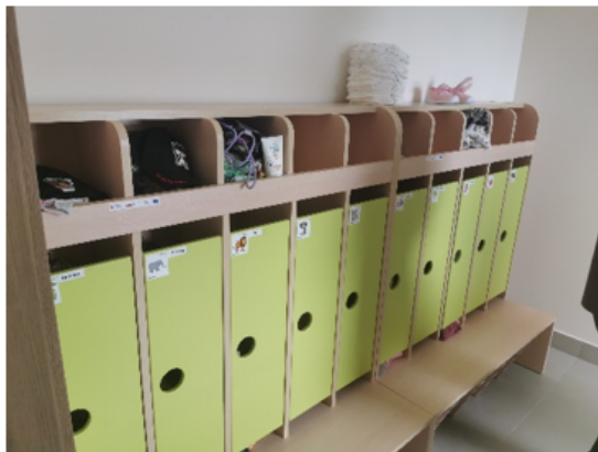
Zdjęcie nr 1 - Szatnia