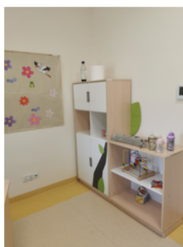
Zdjęcie nr 7 - Sala dzieci