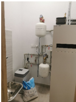
Zdjęcie nr 11 – Pomieszczenie techniczne