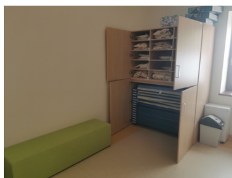
Zdjęcie nr 8 - Sypialnia