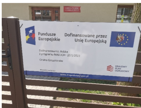
Zdjęcie nr 13 – Tablica Informacyjna

W ramach oględzin Żłobka, zespół kontrolerów potwierdził, że Gmina Goszczanów eksponowała źródło dofinansowania poprzez zamieszczenie naklejek 11 , o których mowa w § 12 ust. 10 w przedmiotowej Umowie oraz dopełnienie przez jednostkę kontrolowaną warunków informacyjno – promocyjnych zawartych w § 12 ust. 2 Umowy o dofinansowanie, tj. umieszczenie tablicy informującej o korzystaniu z dofinansowania z Programu MALUCH+ 2022-2029.