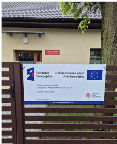
Zdjęcie nr 14 – tablica informacyjna

Gmina Goszczanów w dniu 7 maja 2026 r. przekazała dokumentację zdjęciową, przedstawiającą właściwą tablicę informacyjną.