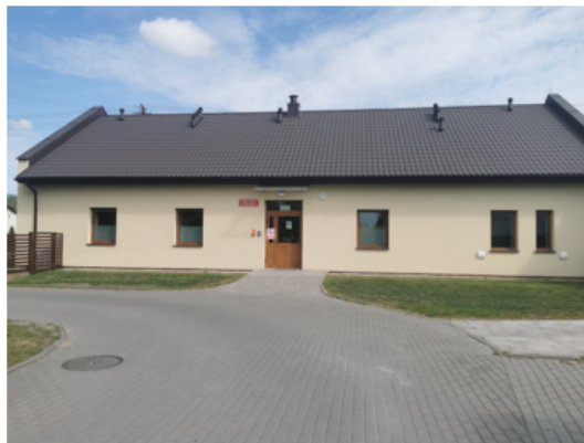
Zdjęcie nr 12 – Budynek Gminnego Żłobka w Goszczanowie

W ramach oględzin Żłobka, zespół kontrolerów potwierdził, że Gmina Goszczanów eksponowała źródło dofinansowania poprzez zamieszczenie naklejek 11 , o których mowa w § 12 ust. 10 w przedmiotowej Umowie oraz dopełnienie przez jednostkę kontrolowaną warunków informacyjno – promocyjnych zawartych w § 12 ust. 2 Umowy o dofinansowanie, tj. umieszczenie tablicy informującej o korzystaniu z dofinansowania z Programu MALUCH+ 2022-2029.