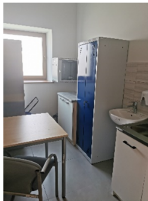
Zdjęcie nr 2 - Pomieszczenie socjalne