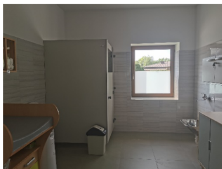
Zdjęcie nr 5 - Toaleta dla dzieci