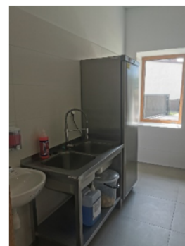
Zdjęcie nr 6 - Rozdzielnia