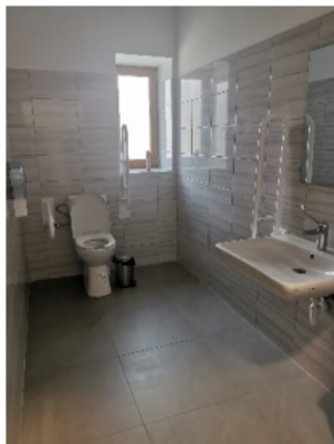
Zdjęcie nr 10 – Toaleta dla personelu