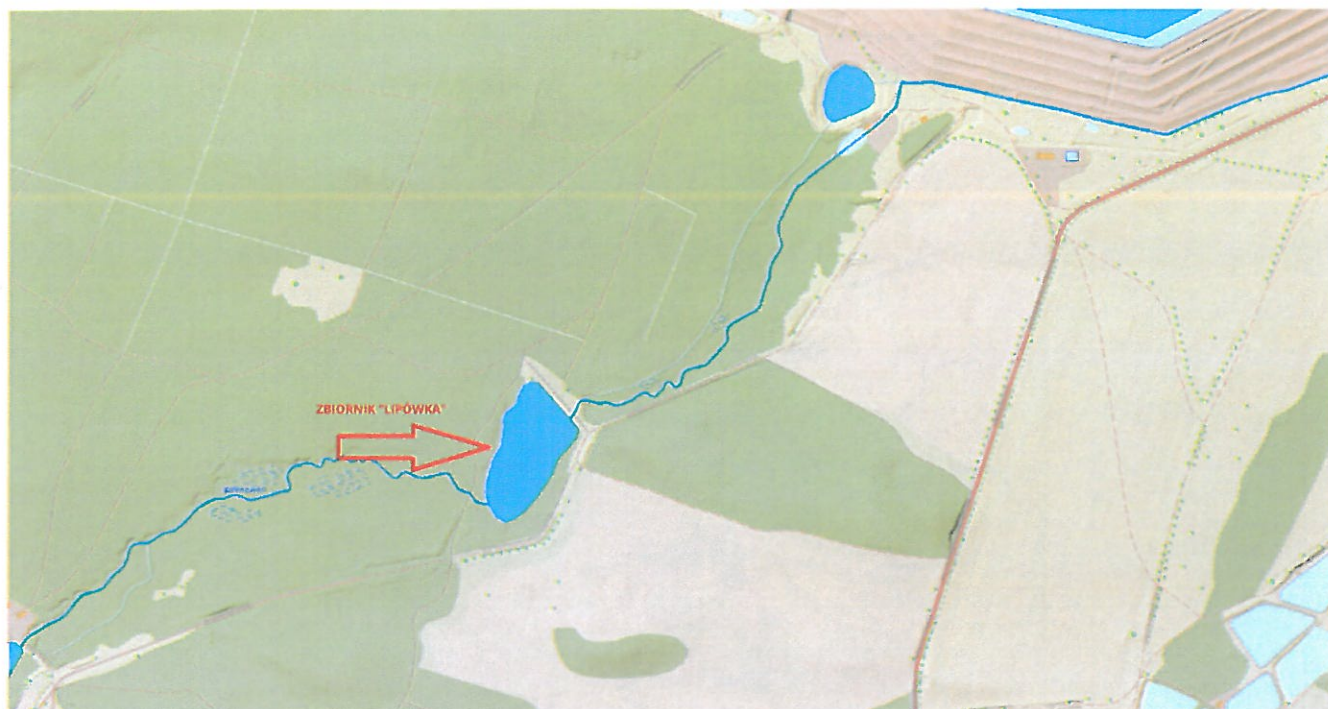
Rys. 2 Przebieg ciek Kalinówka (być może Lipówka) oznaczony w Hydroportalu https://wody.isok.gov.pl/imap_kzgw/?gpmmap=gpPGW

Tymczasem ciek po opuszczeniu zbiornika „Lipówka” biegnie tak jak na mapie załączonej do niniejszego pisma, tj. ze zbiornika „Lipówka” woda kierowana jest do rurociągu grawitacyjnego \Phi 1200 mm i dalej poprzez komorę rozdzielczo-przelewową rurociągami \Phi 1000 mm i \Phi 800 mm i kanałami otwartymi do potoku Kalinówka w km 0+950 lewostronnego dopływu rzeki Rudna.