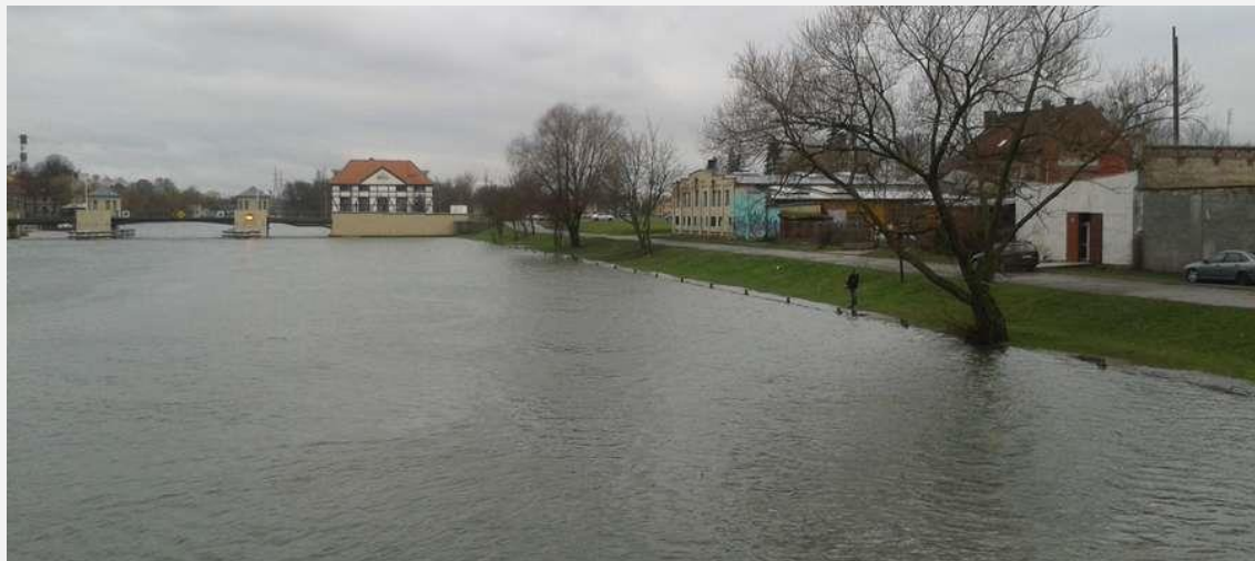
Wezbranie rzeka Elbląg 28.12.2015

Wezbranie – znaczny wzrost stanów wody w ciekach i jeziorach, wywołany zwiększonym zasilaniem (opady, topnienie śniegu) lub zahamowaniem odpływu (zatory lodowe lub śryżowe, wiatr wiejący przeciwnie do kierunku przepływu wody).