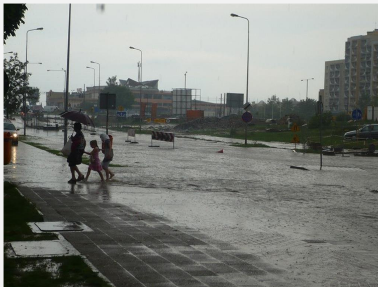
Podtopienie ul. Nowowiejska Elbląg 07.2011

Podtopienia – zalania terenów z innych przyczyn niż powódź. Przyczynami podtopień mogą być np.: wypełnienie retencji gruntowej zlewni, duże opady deszczu oraz przesiąki wody przez wały przeciwpowodziowe.