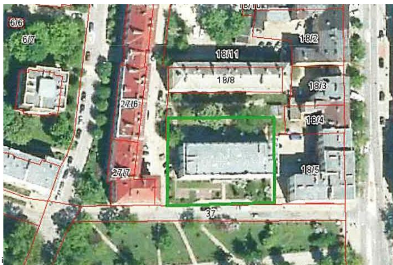
Położenie działki na tle miasta