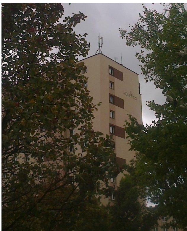
Fot. 1a, b: Widoki anten stacji bazowej ID: 24008(96007N!), zlokalizowanej przy ul. Mickiewicza 42 w Białymstoku