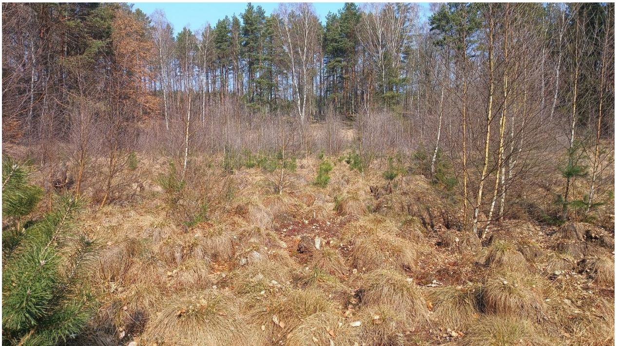
Fot. 4. Zdjęcia pogładowe powierzchni do wycinki