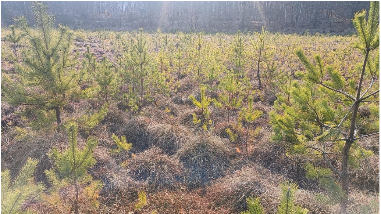
Fot. 7. Zdjęcia pogładowe powierzchni do wycinki