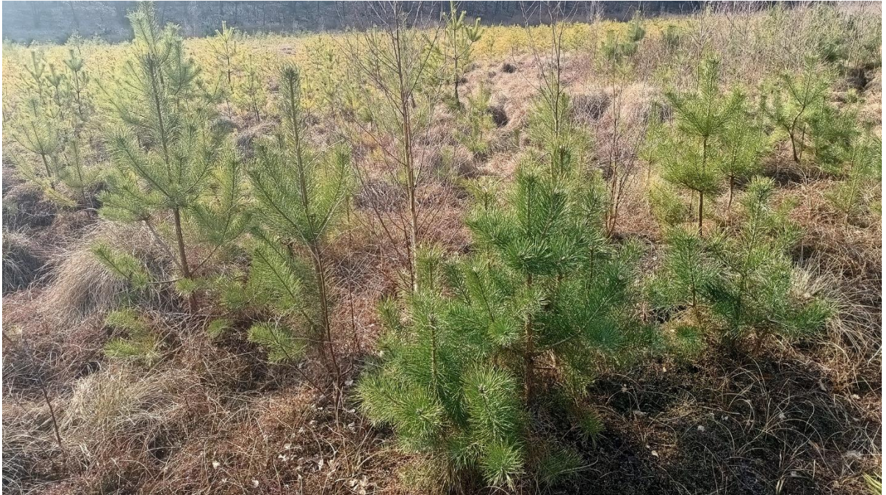
Fot. 3. Zdjęcia pogładowe powierzchni do wycinki