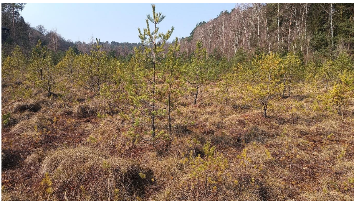
Fot. 2. Zdjęcia poglądowe powierzchni do wycinki