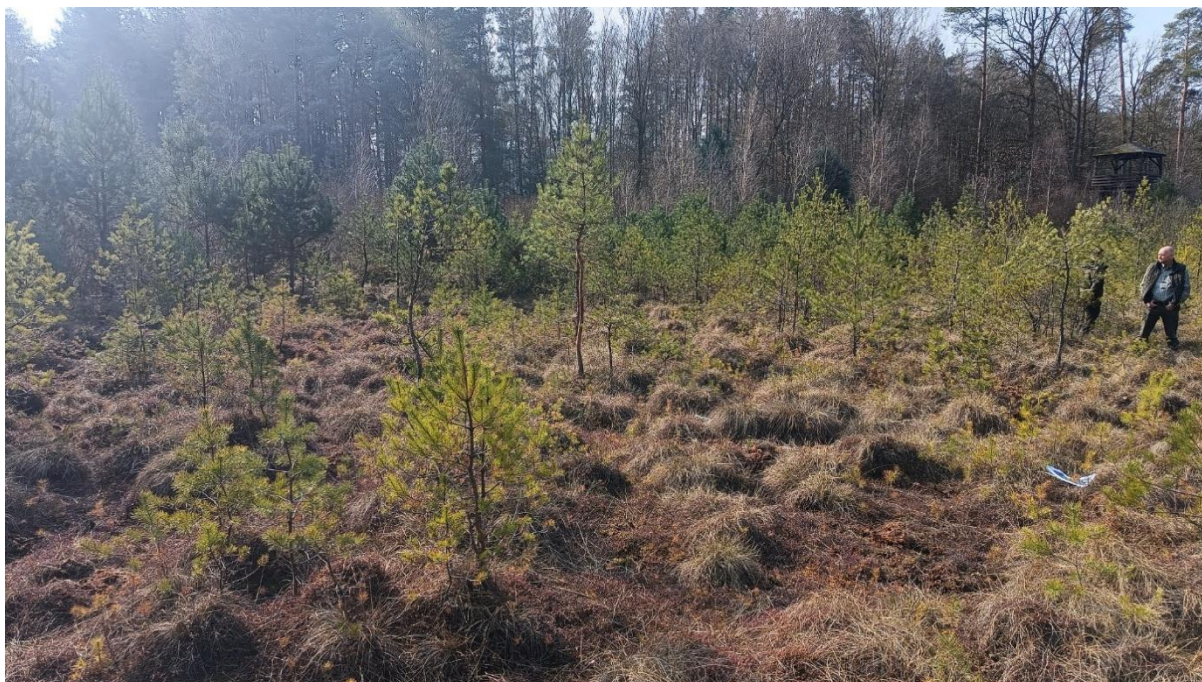
Fot. 1. Zdjęcia poglądowe powierzchni do wycinki

Stan powierzchni wskazanej do ochrony czynnej na terenie rezerwatu przyrody "Torfowisko Ustronie" (zdjęcia według stanu na dzień 15.03.2025 r.):