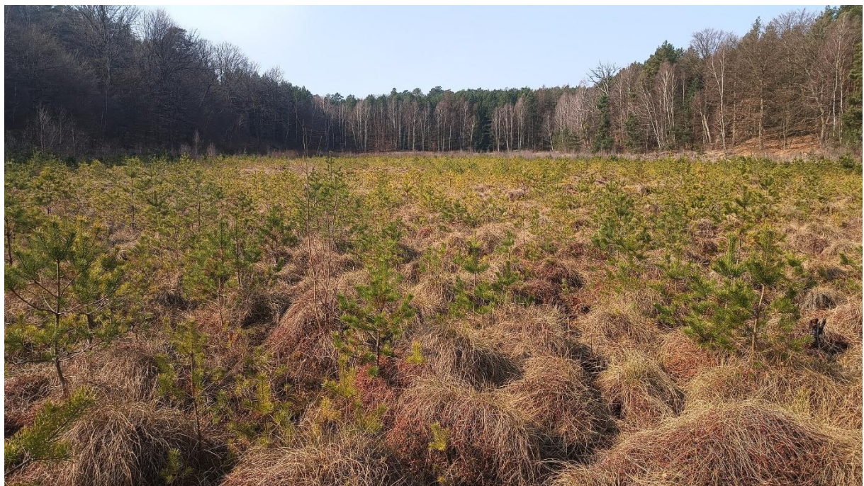
Fot. 6. Zdjęcia poglądowe powierzchni do wycinki