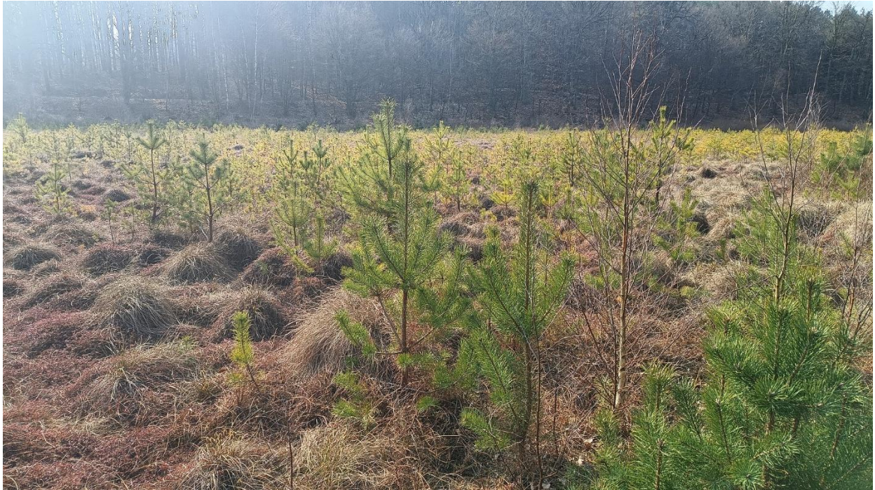
Fot. 5. Zdjęcia poglądowe powierzchni do wycinki