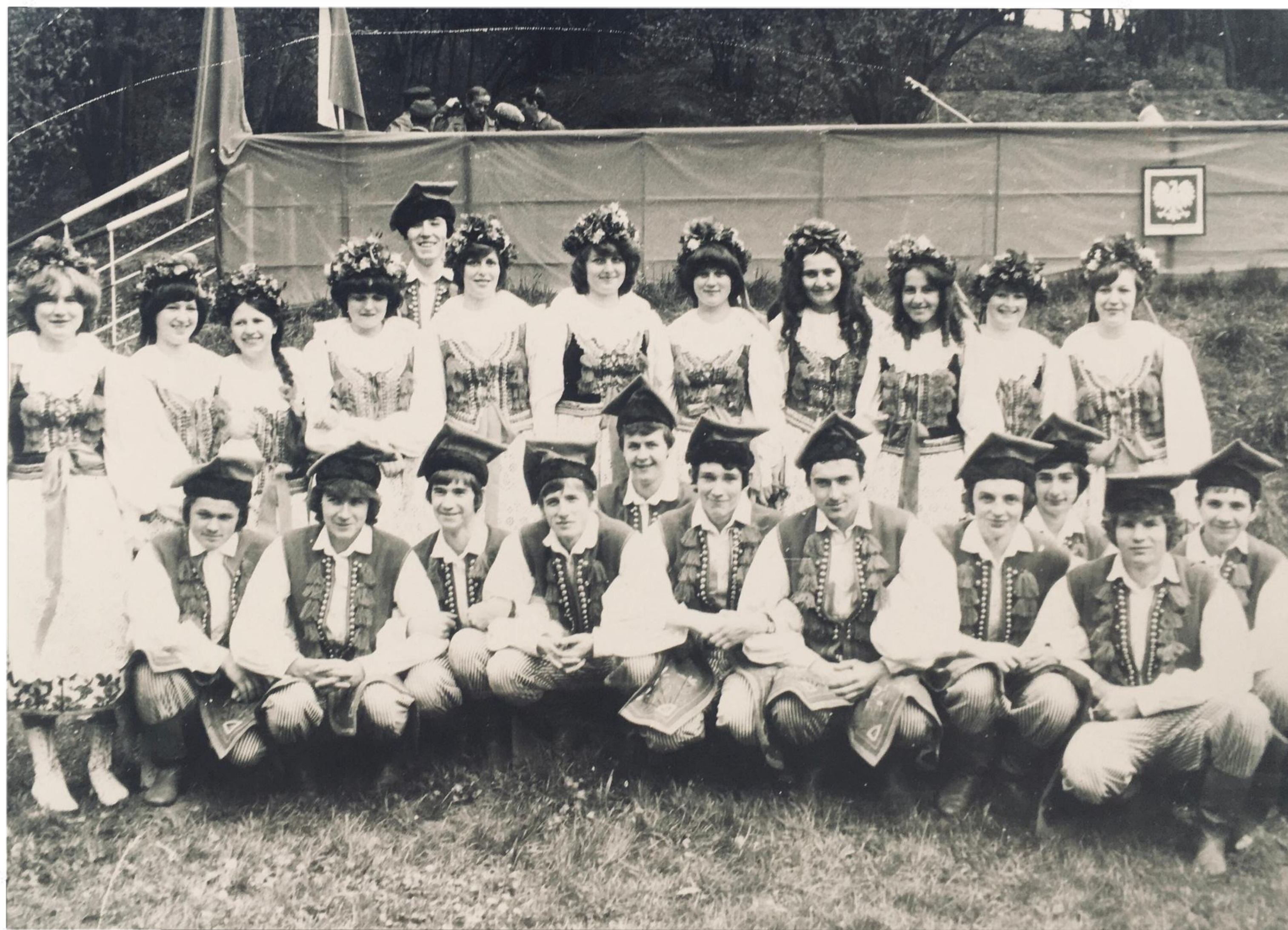
Zespół Pieśni i Tańca "Złote Kłosa"