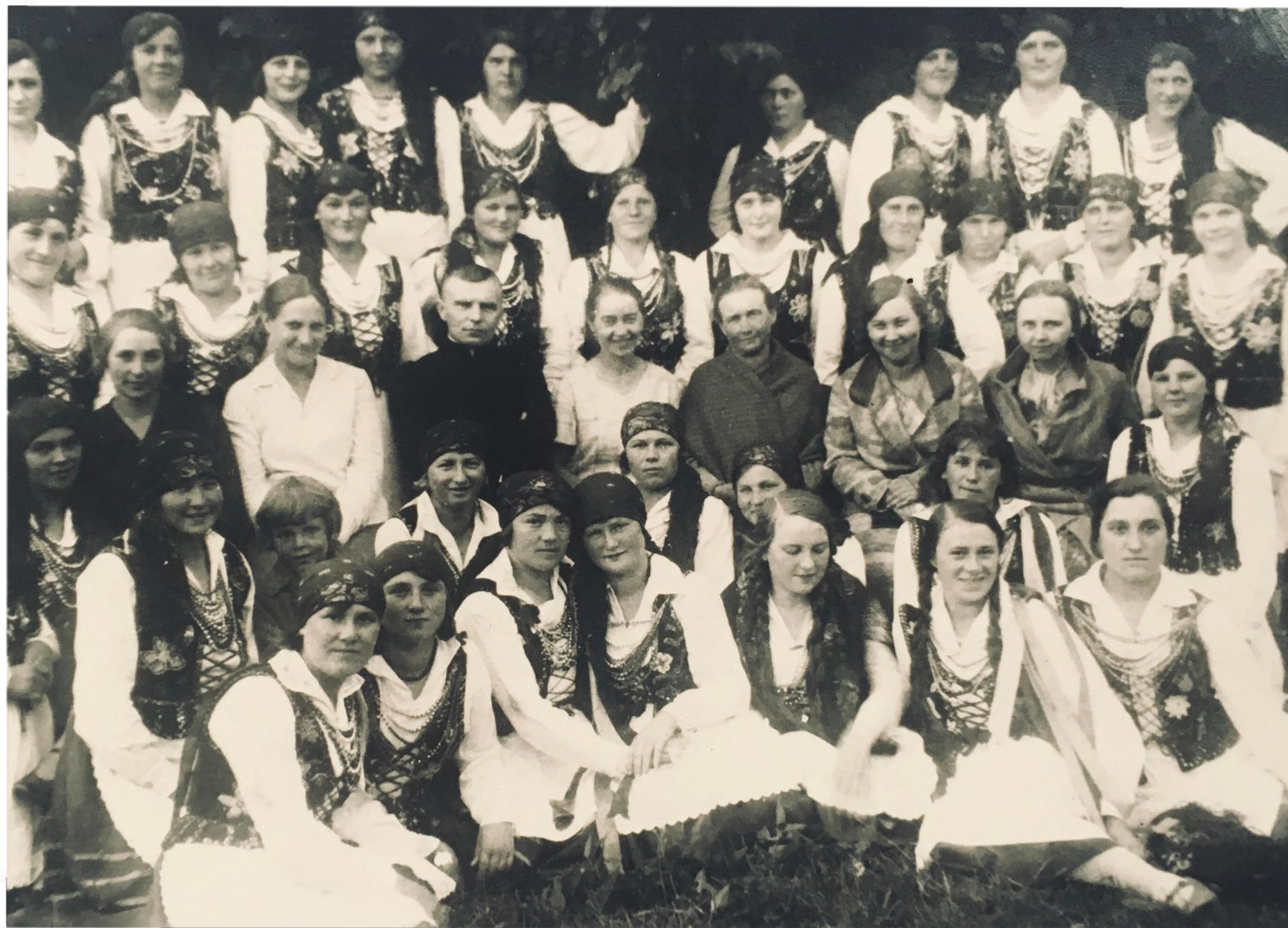
Uczennice i nauczyciele