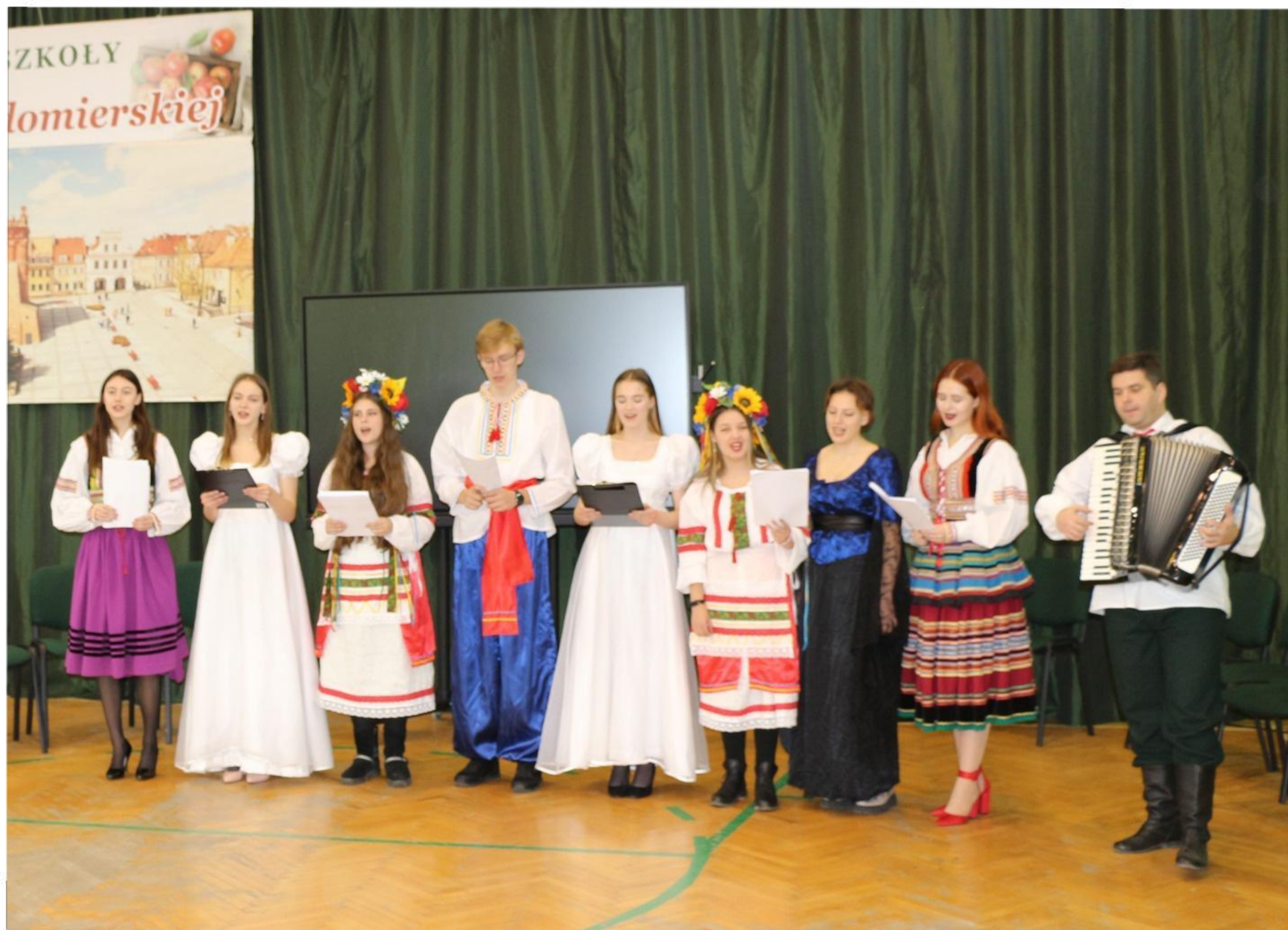
Zespół Pieśni i Tańca "Mokoszynianie" w piosence: "Sandomierzanin"