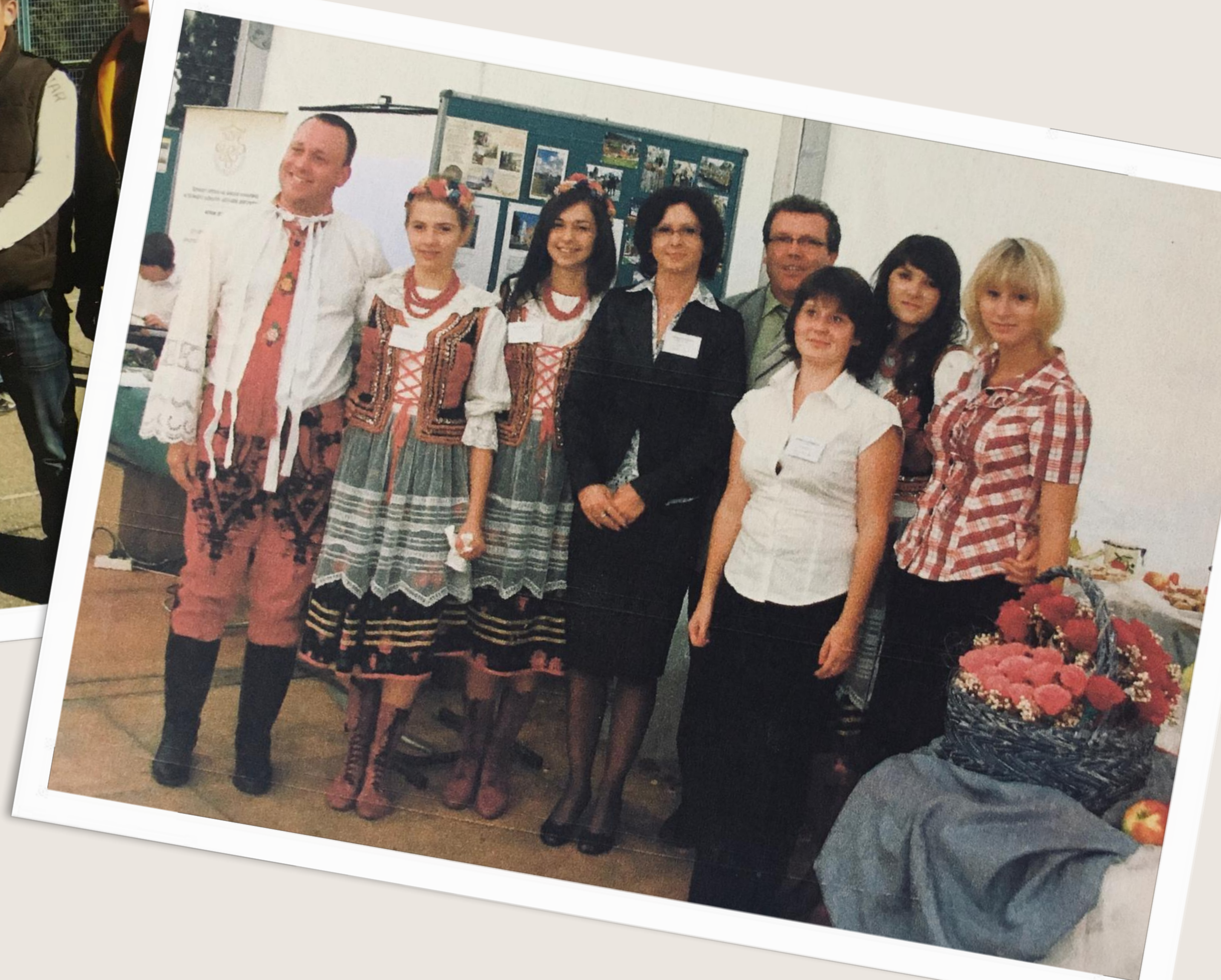
Udział w projekcie Comenius - spotkania z partnerską szkołą w Saksonii