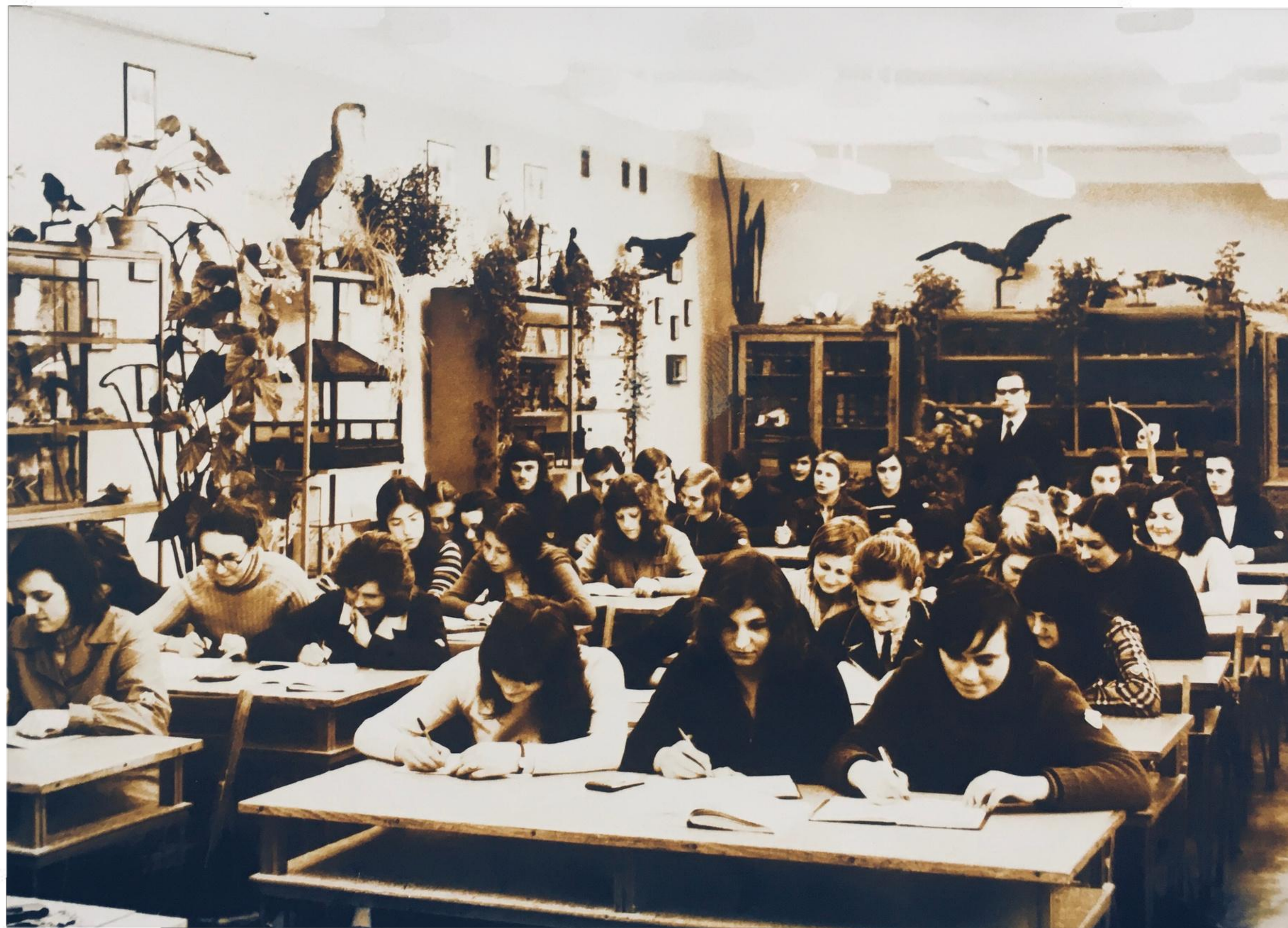
W pracowni biologicznej