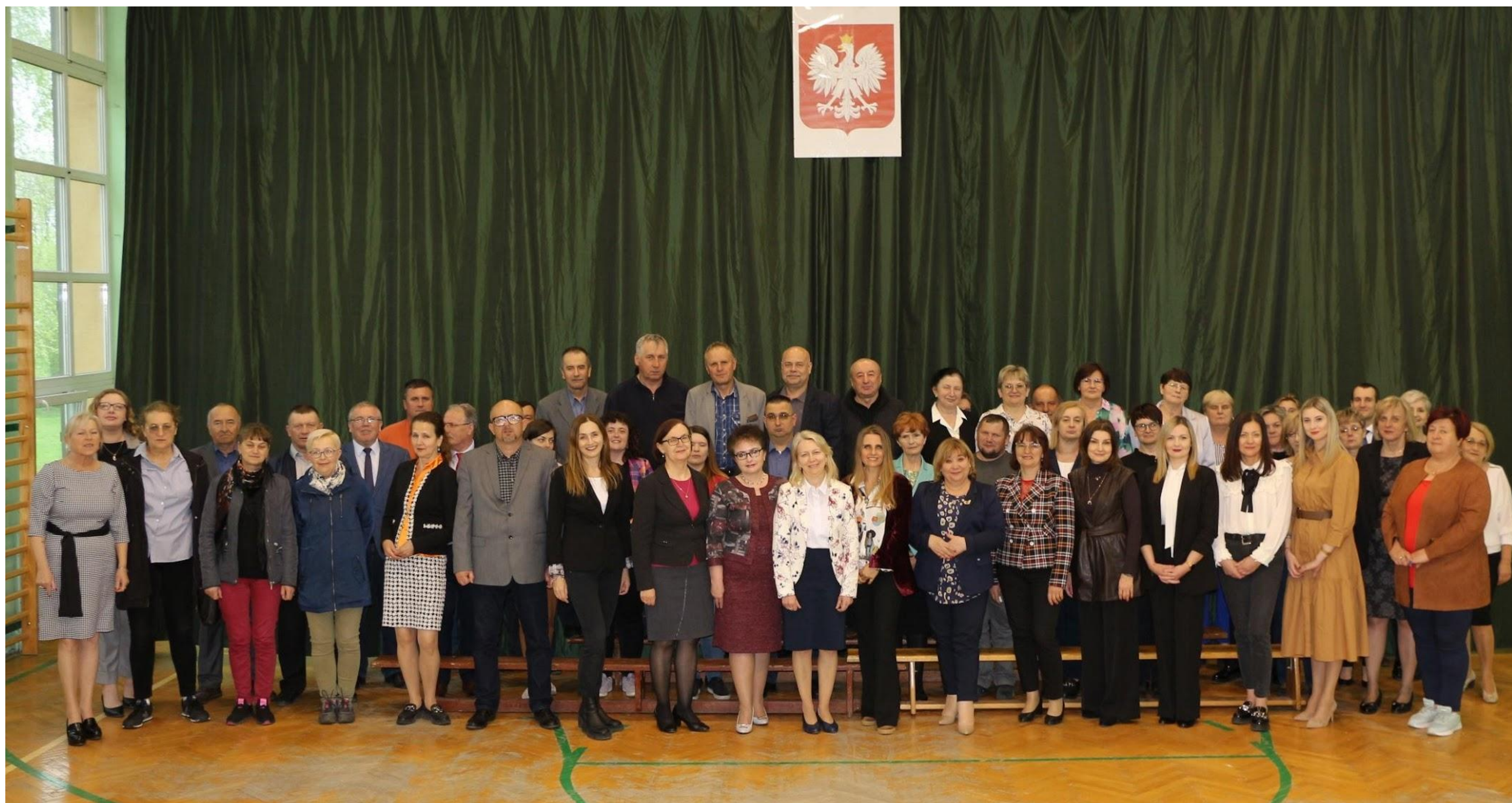
Kadra nauczycieli, wychowawców, pracowników administracji i obsługi - maj 2023