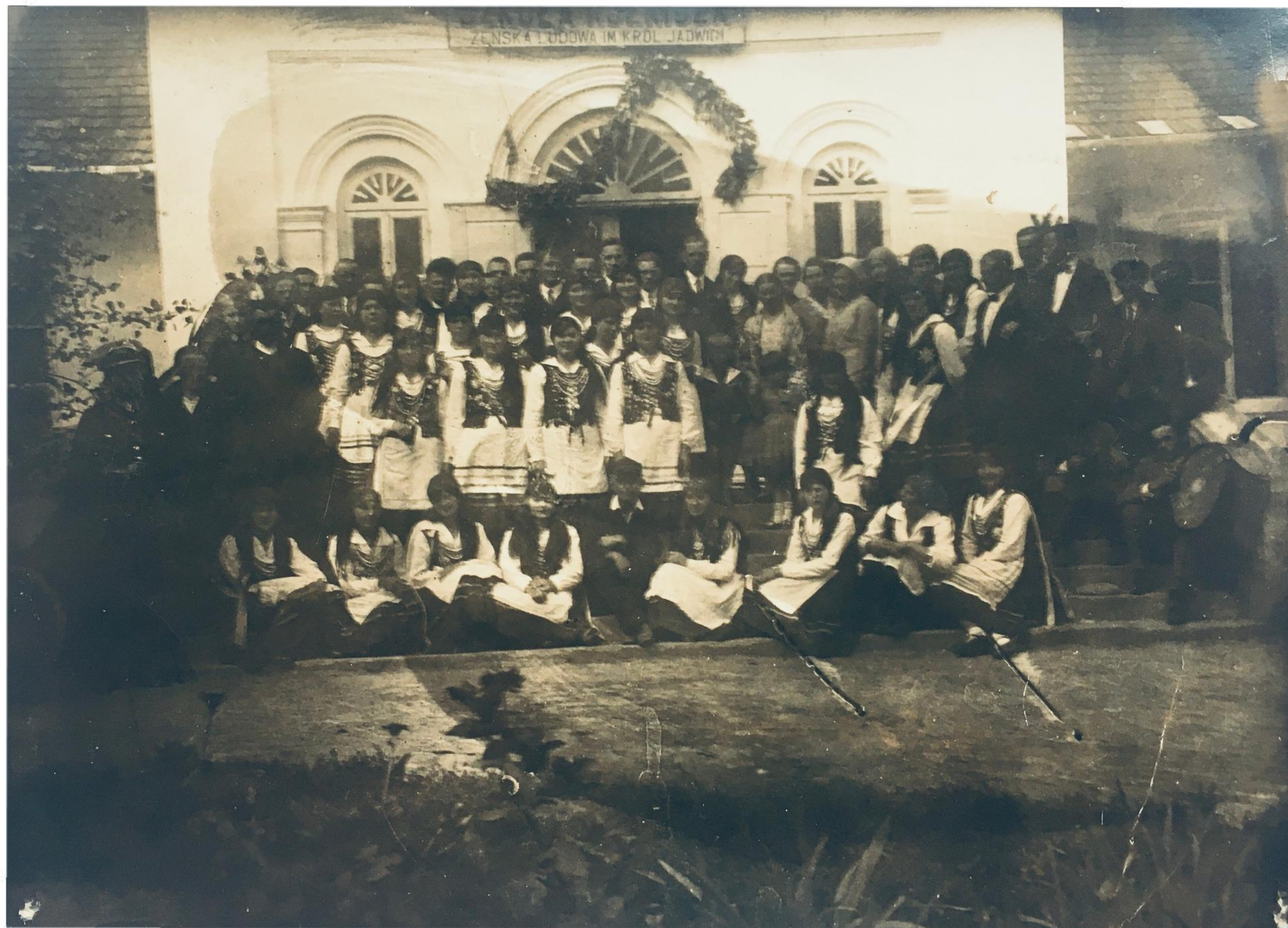
Nauczycielki z uczennicami - lata 30.