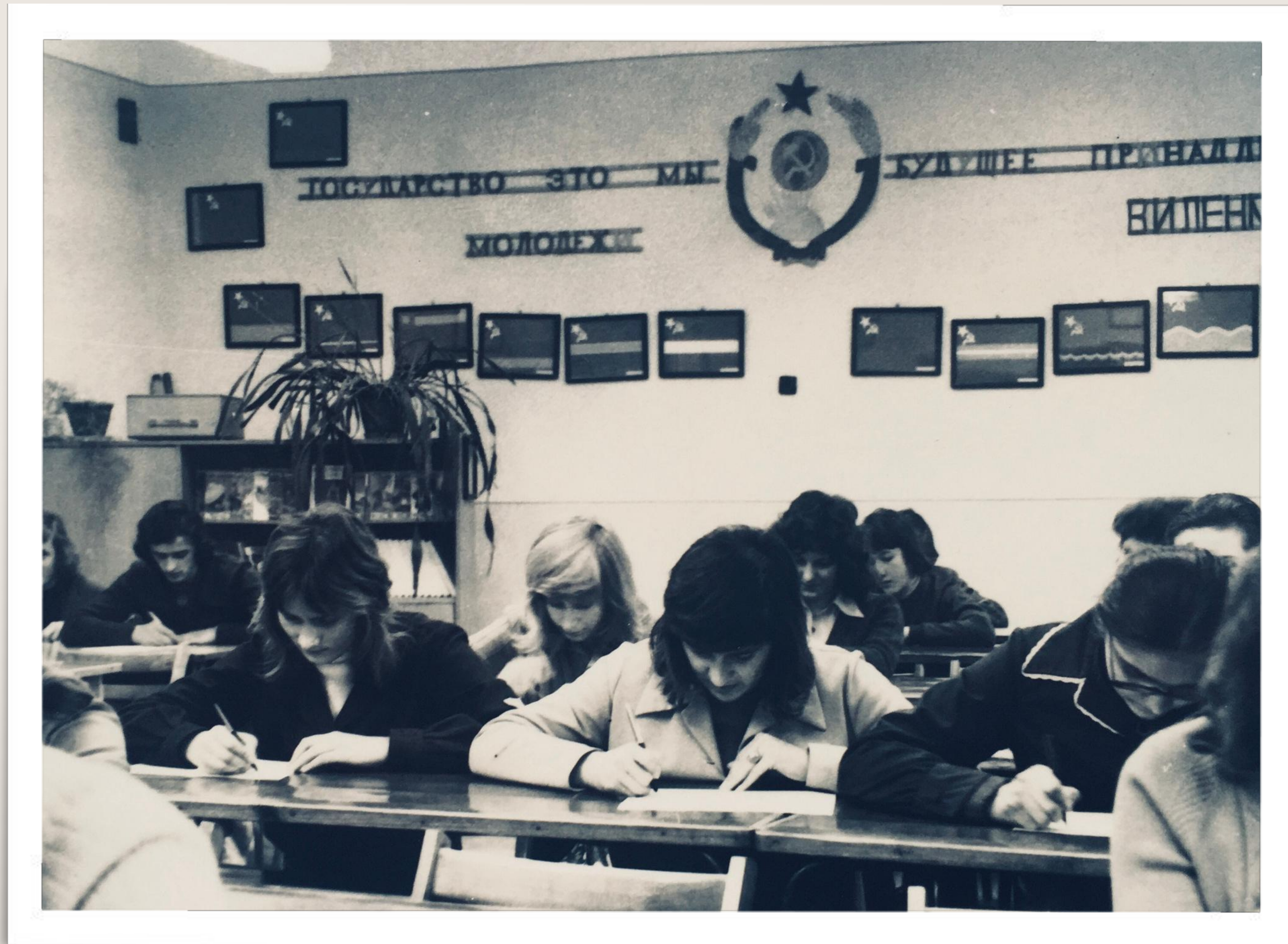
W pracowni języka rosyjskiego