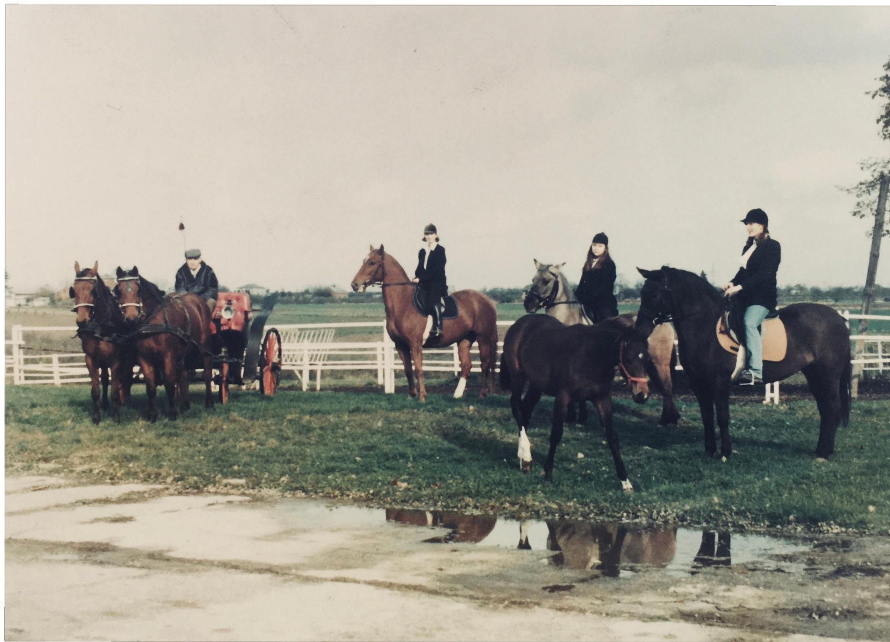
Uczennice klasy 3 THK podczas szkolnego Hubertusa