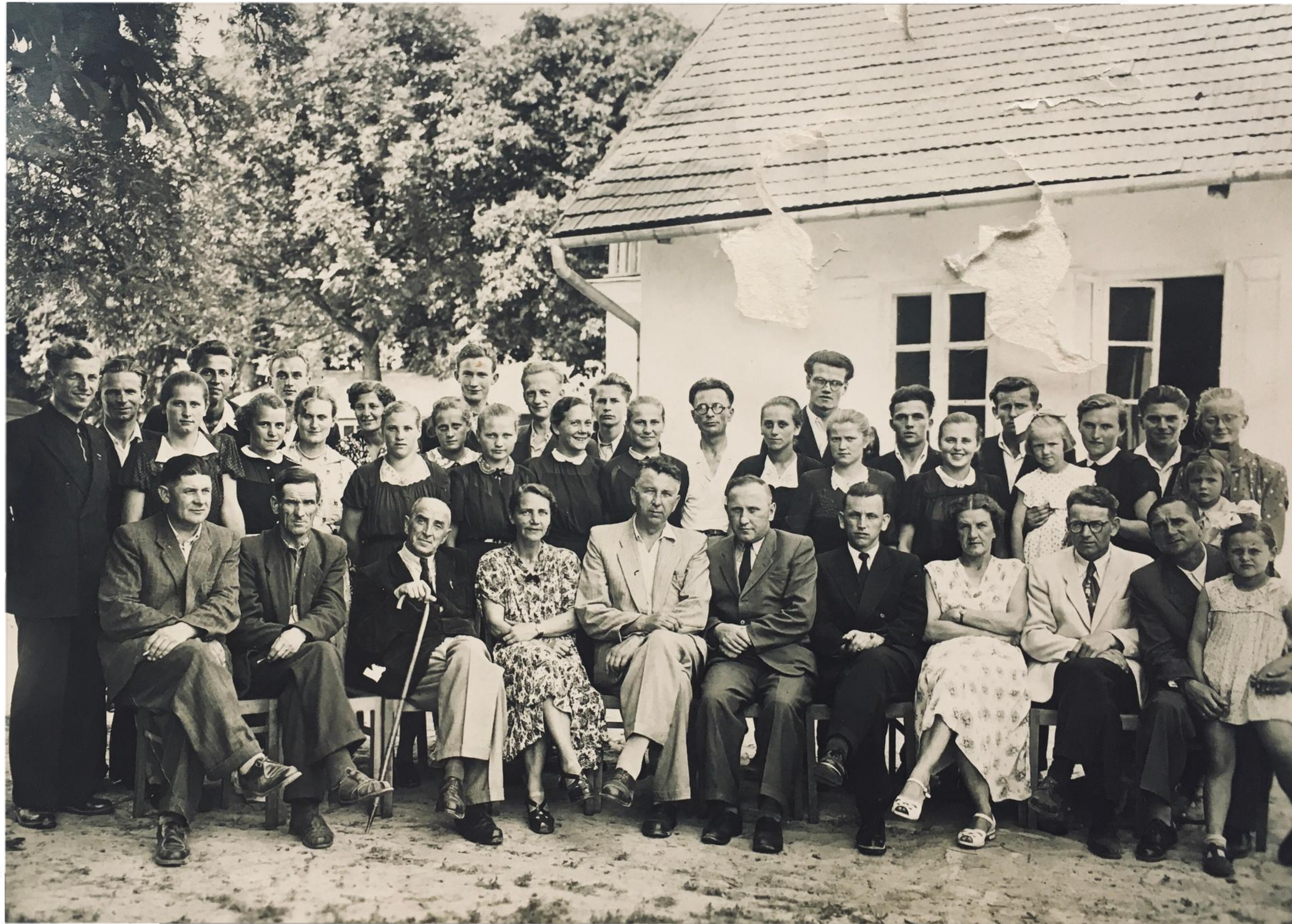
Nauczyciele, pracownicy i uczniowie - 1952