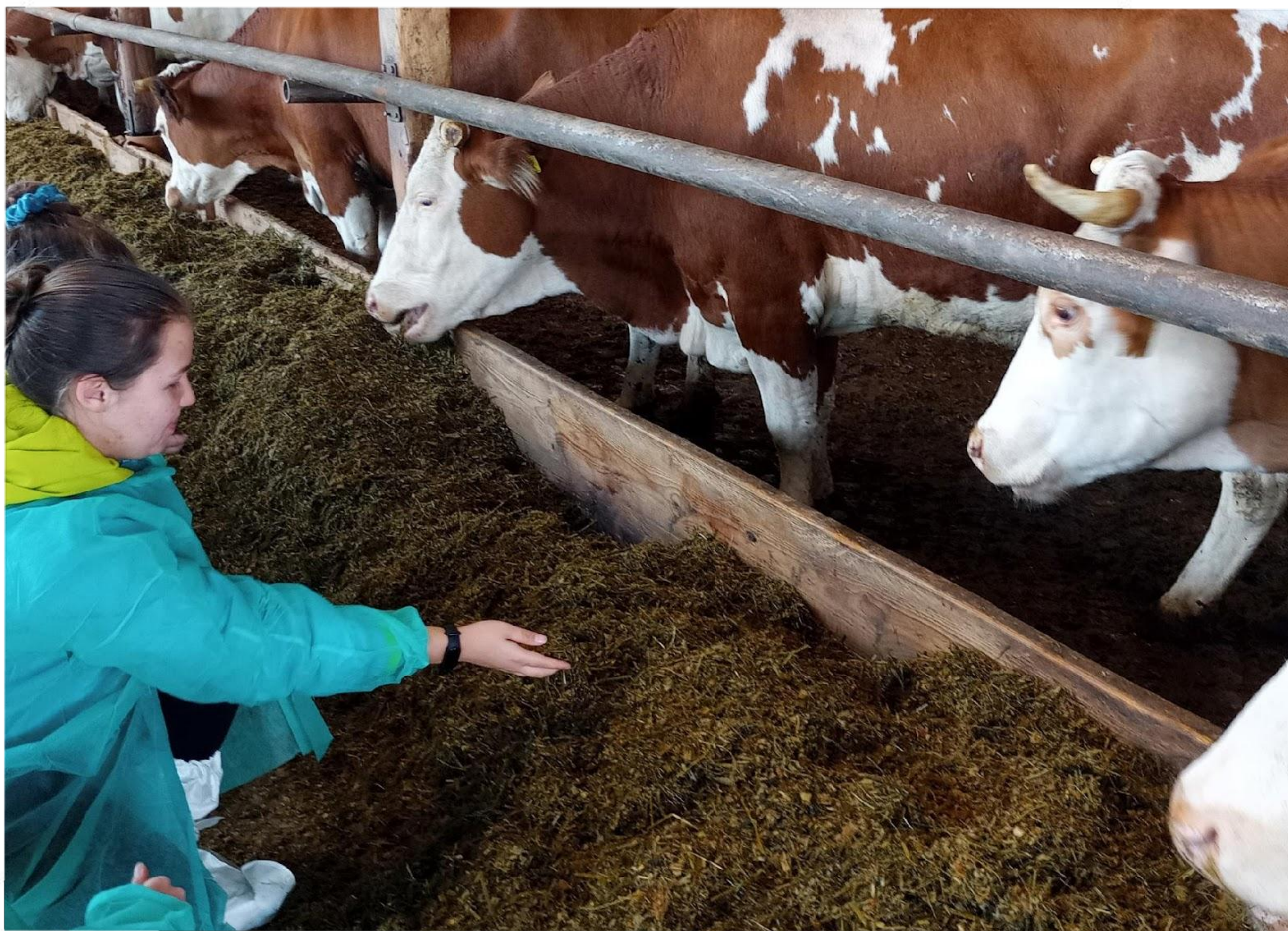
Zajęcia praktyczne uczniów Technikum w zawodzie technik weterynarii