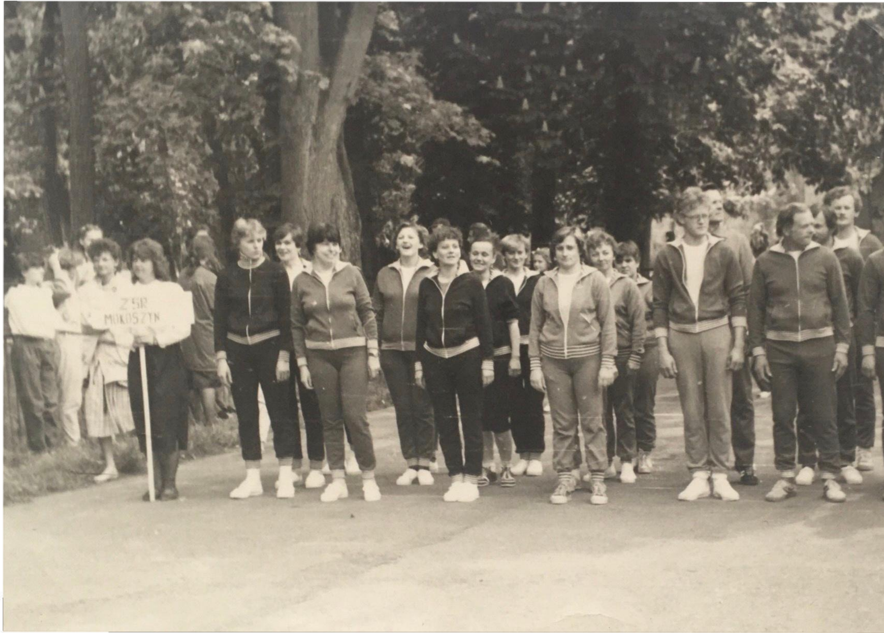
Nauczyciele i pracownicy szkoły na zawodach sportowych w Sichowie - 1986 r.