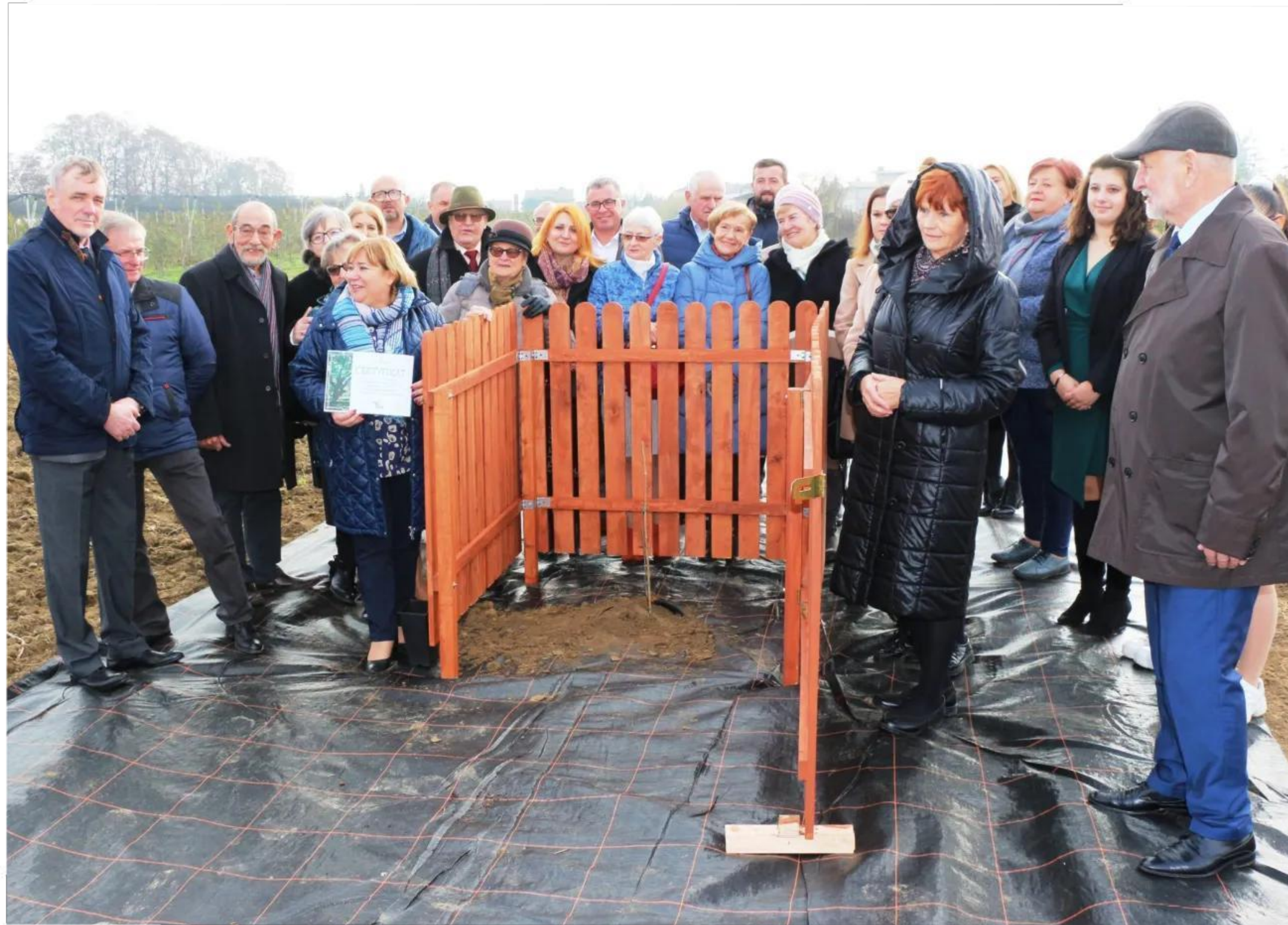
Posadzenie sadzonki - potomka Dębu Bartek - listopad 2022 r.