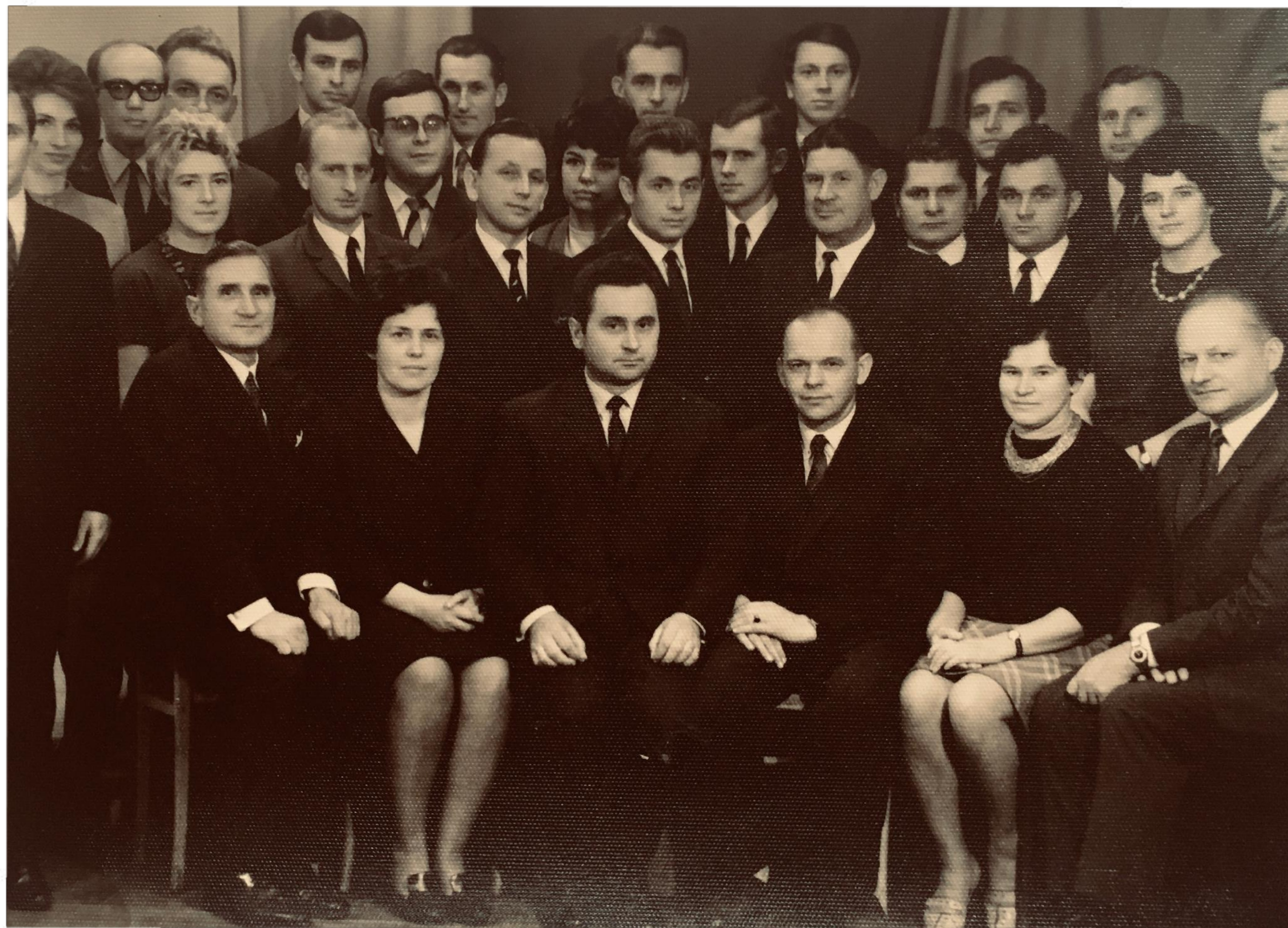
Rada Pedagogiczna - lata 70.