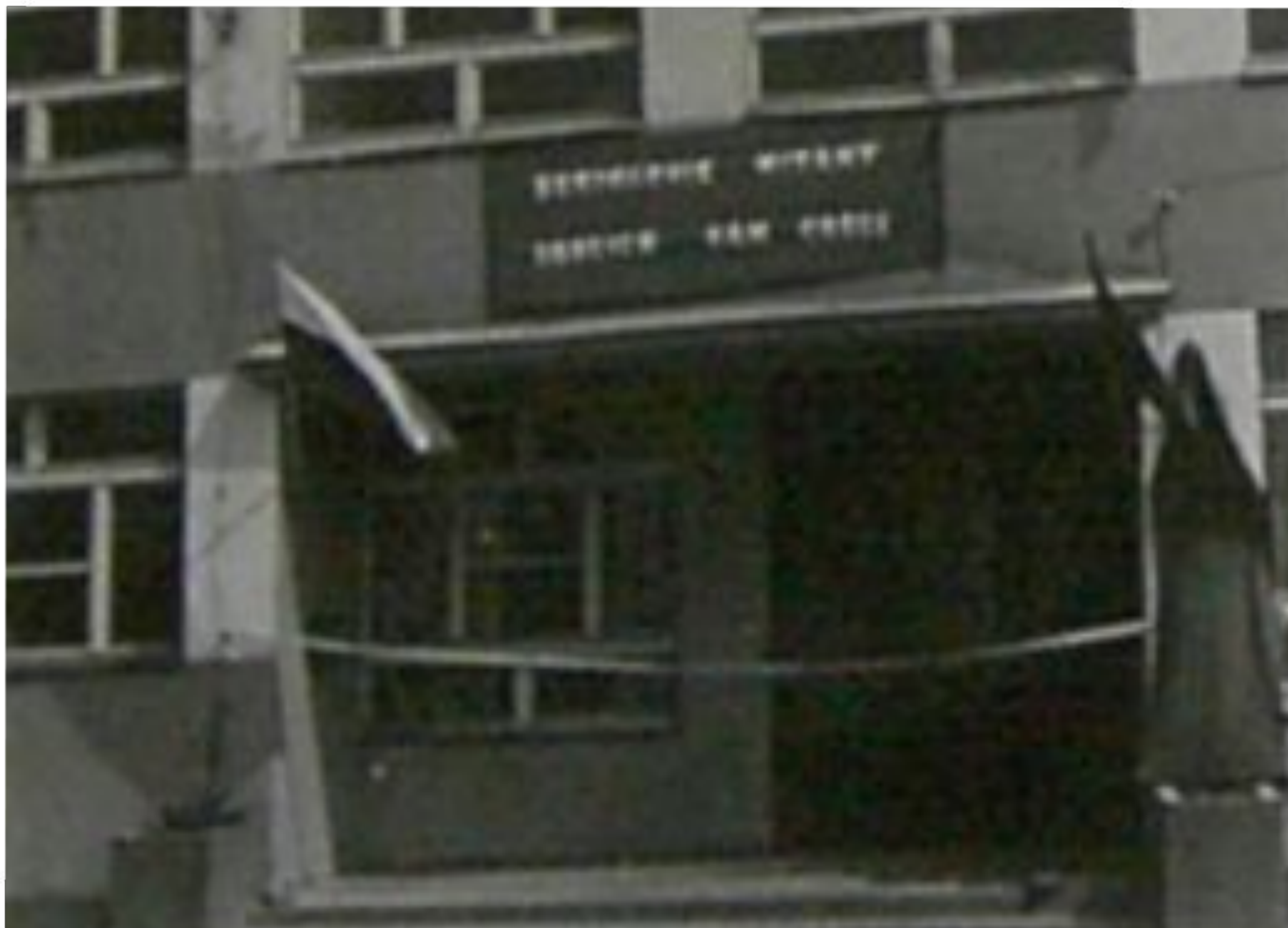
Odświętnie udekorowany budynek szkoły czeka na uroczyste przecięcie wstęgi - 19 maja 1968 r.