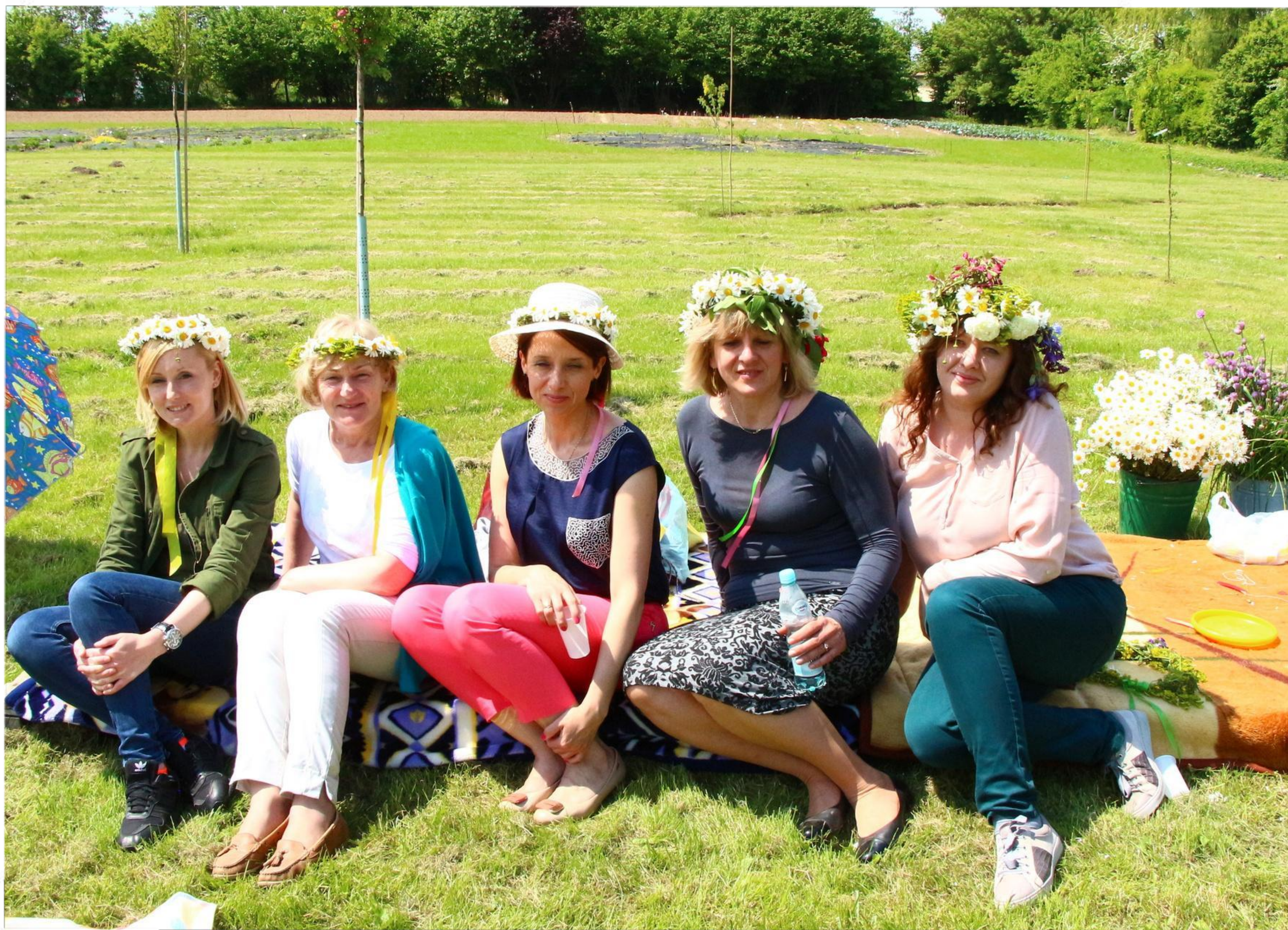
1 Mokozyńska Majówka - 2012 r.