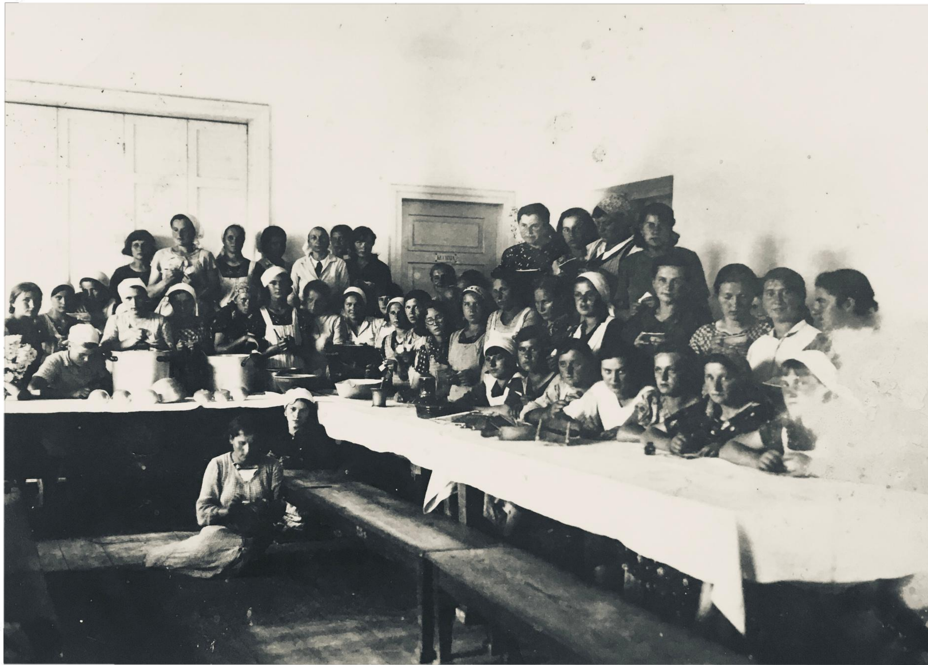
Jadalnia szkolna - 1937