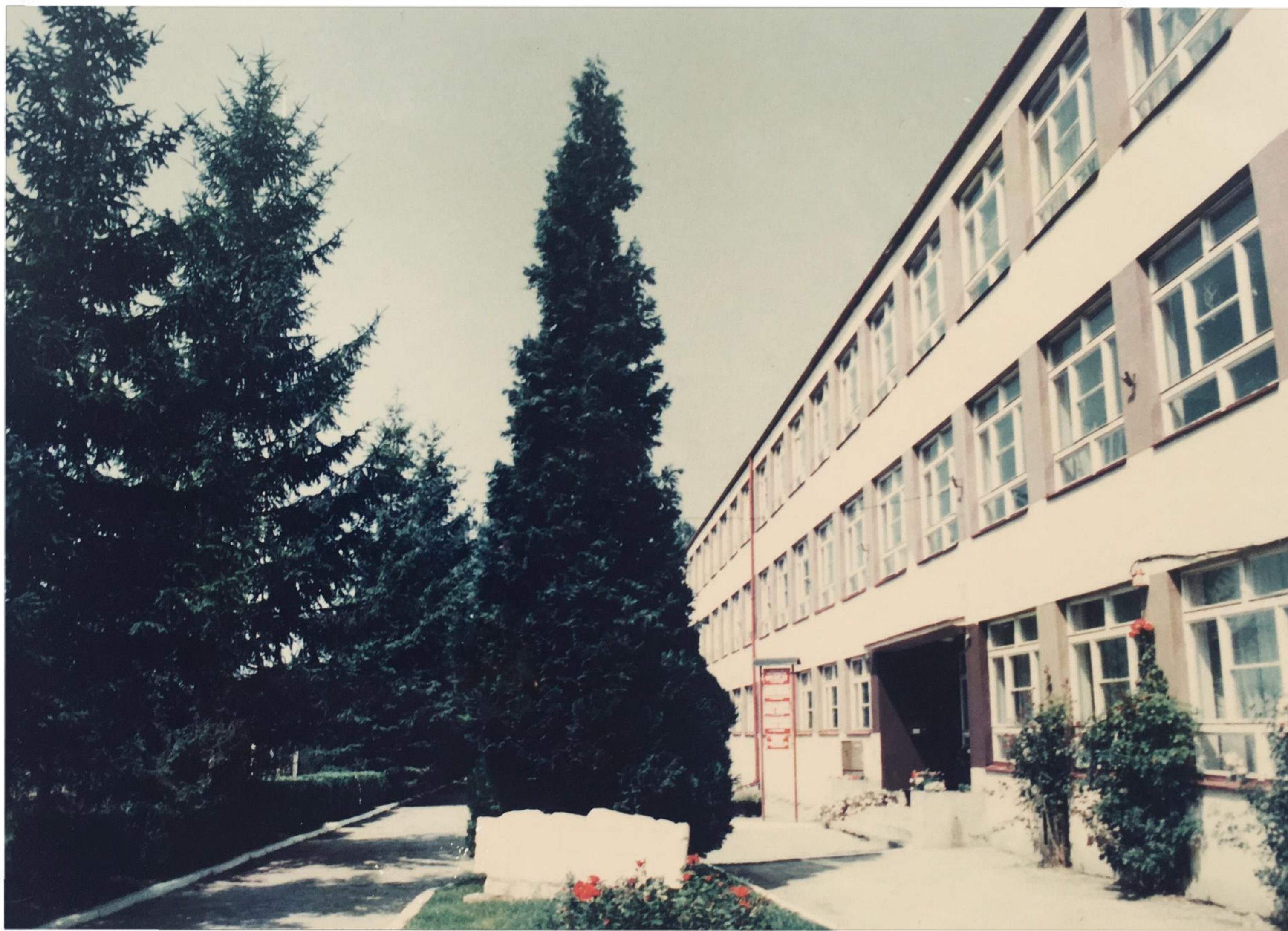
Budynek szkoły - lata 90.