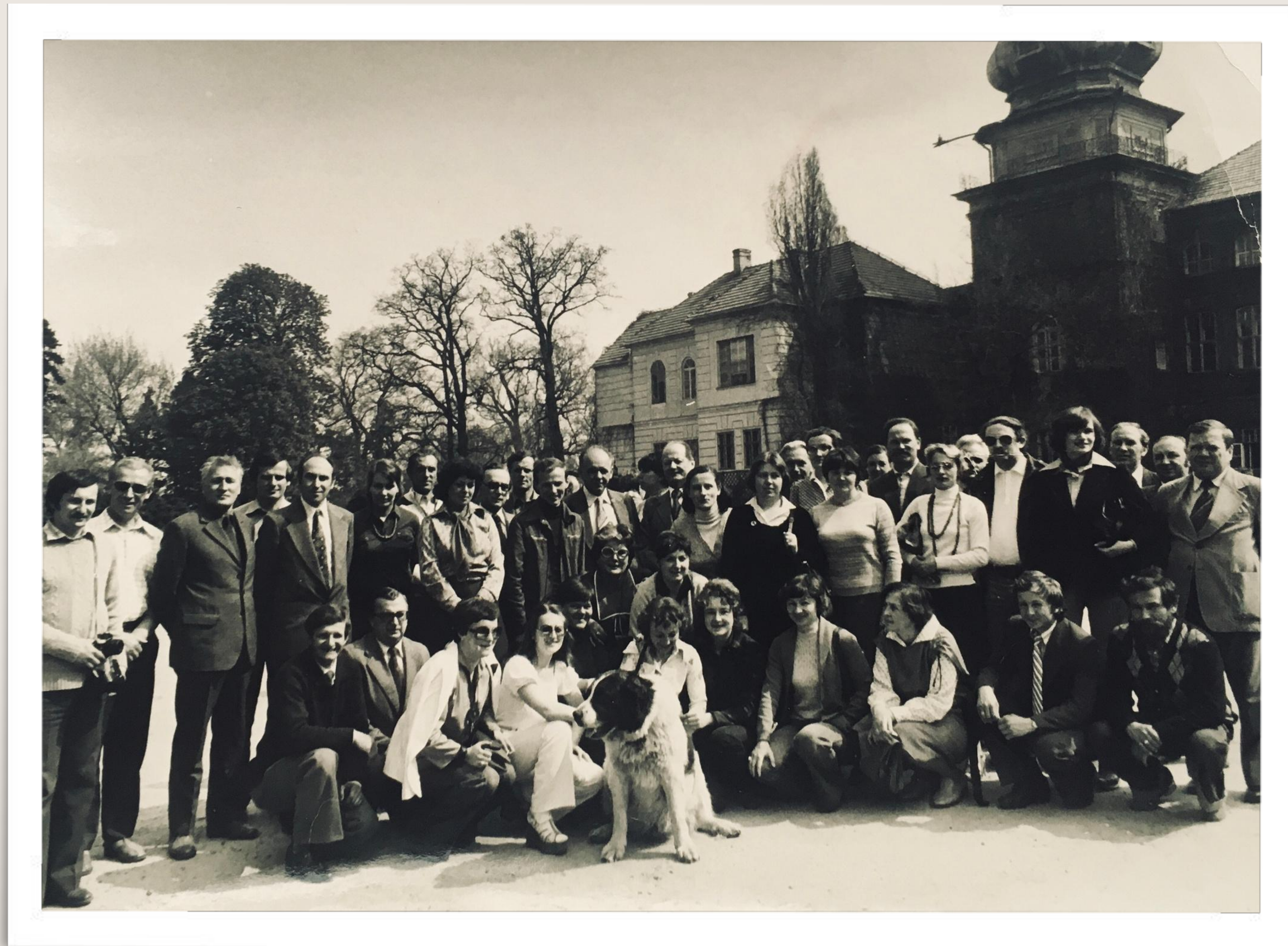
Konferencja wyjazdowa Rady Pedagogicznej - Łańcut 1979