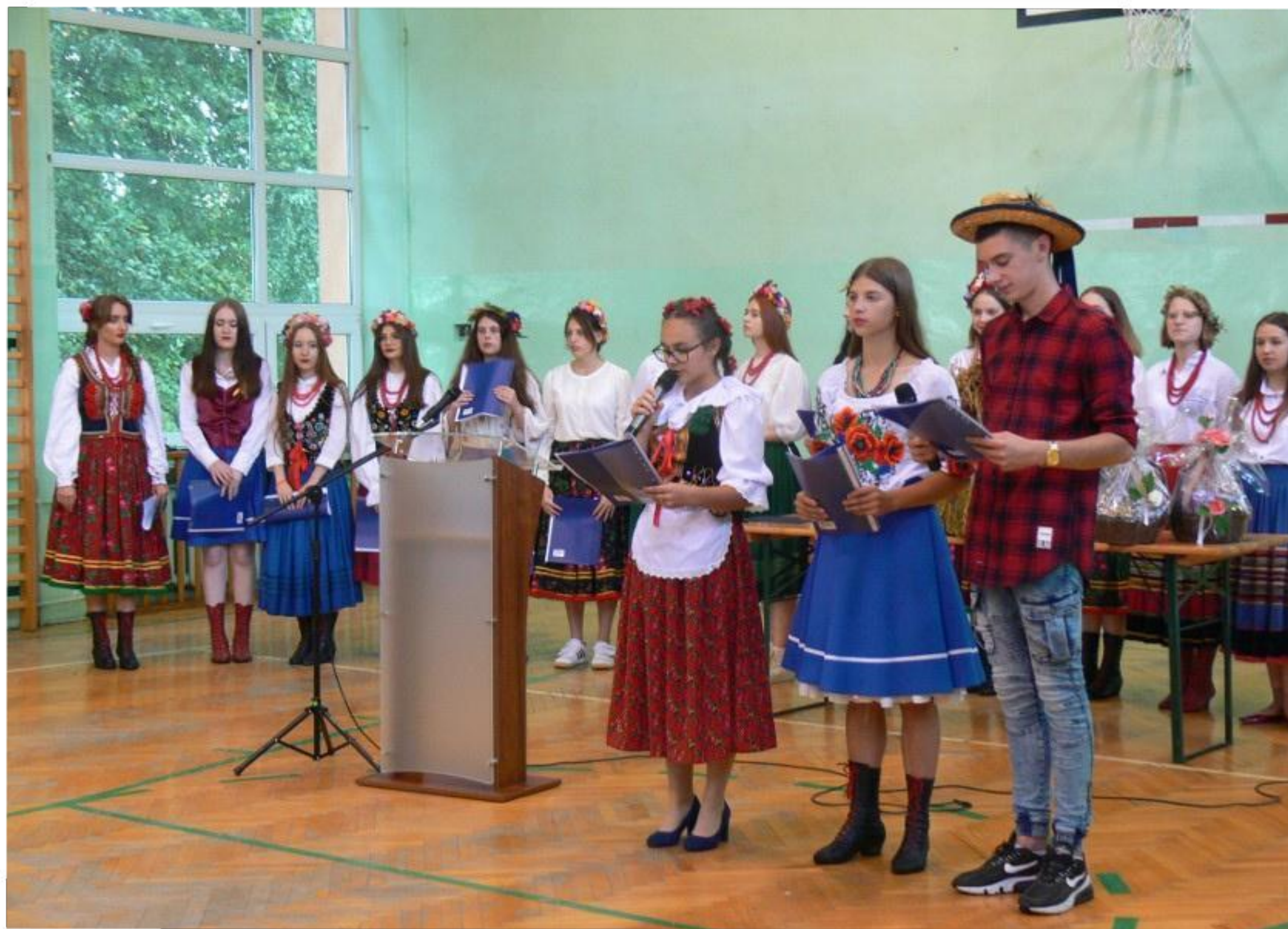
1 Mokozyńskie Święto Plonów - 12 września 2021 r.