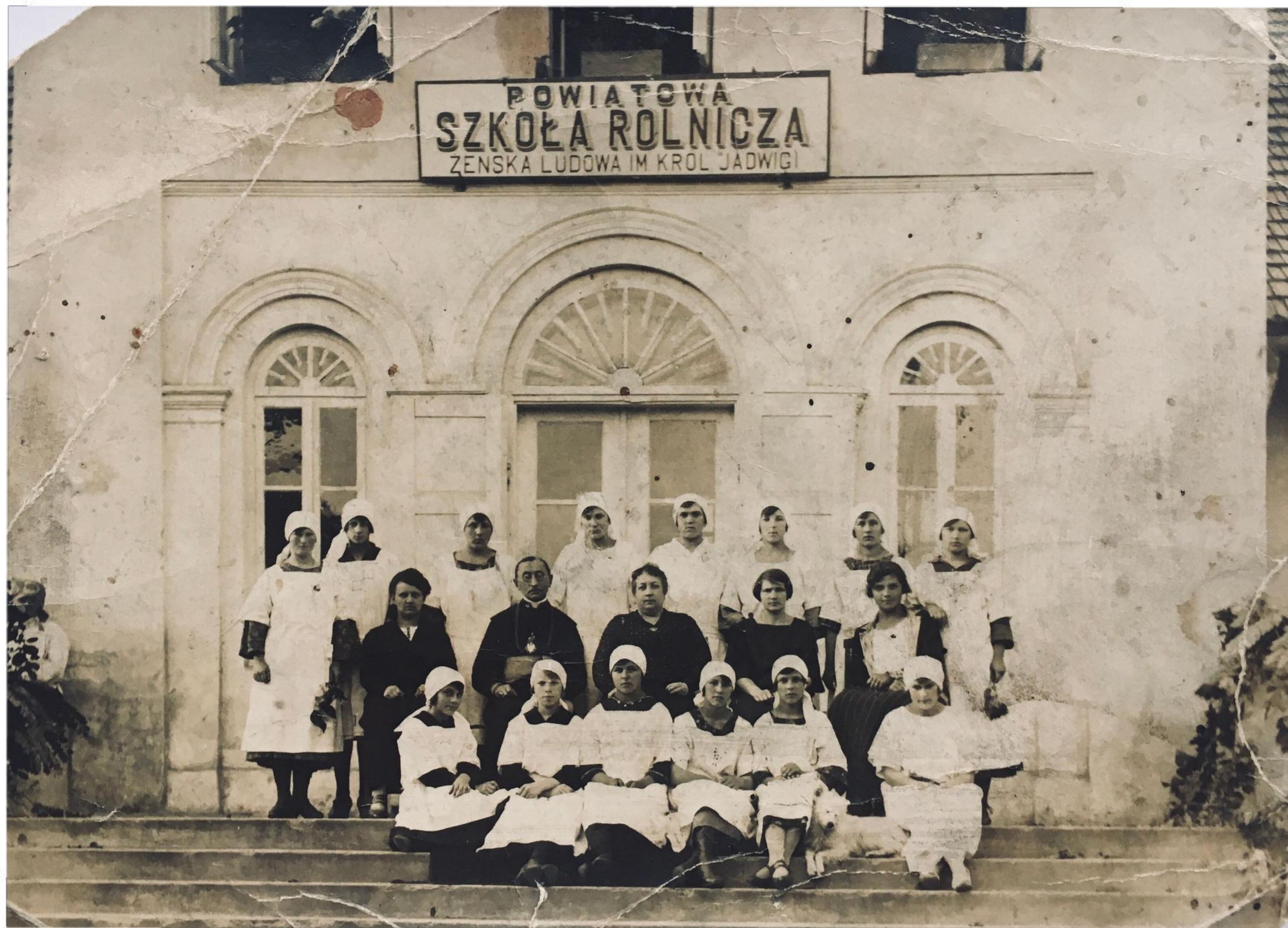
Powiatowa Szkoła Rolnicza