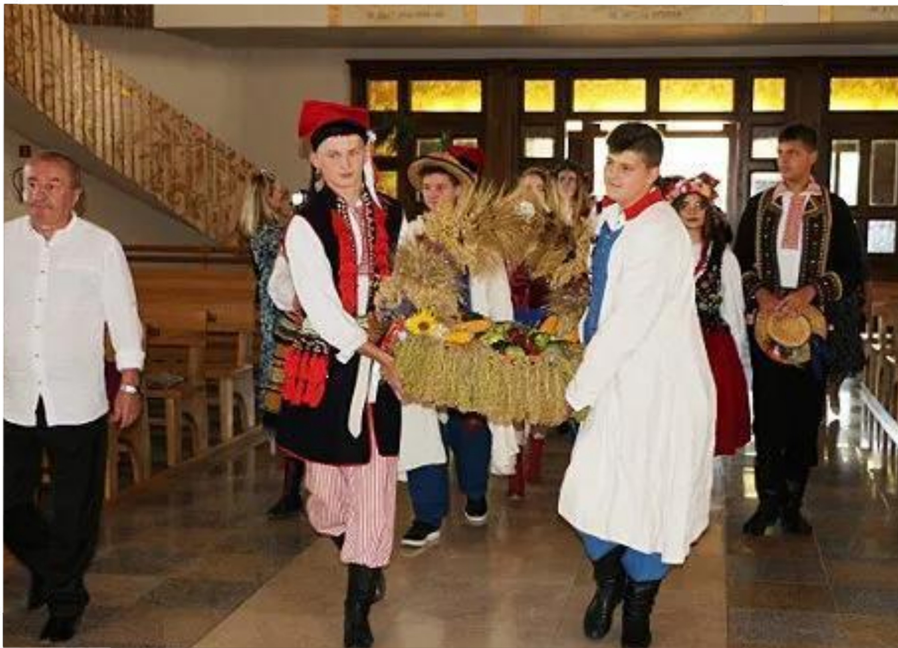
1 Mokozyńskie Święto Plonów - 12 września 2021 r.