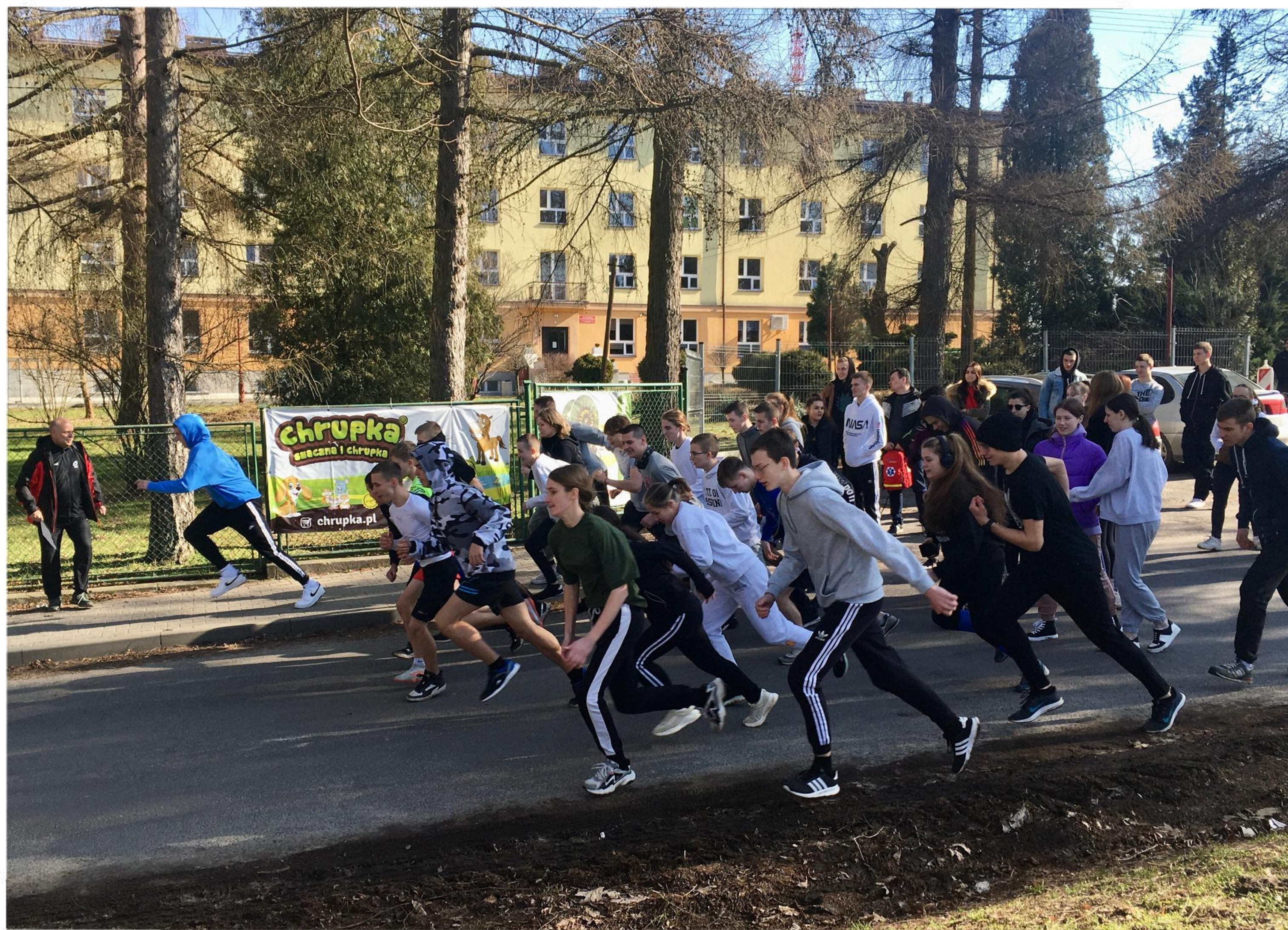
Narodowy Dzień Żołnierzy Wyklętych - bieg terenowy