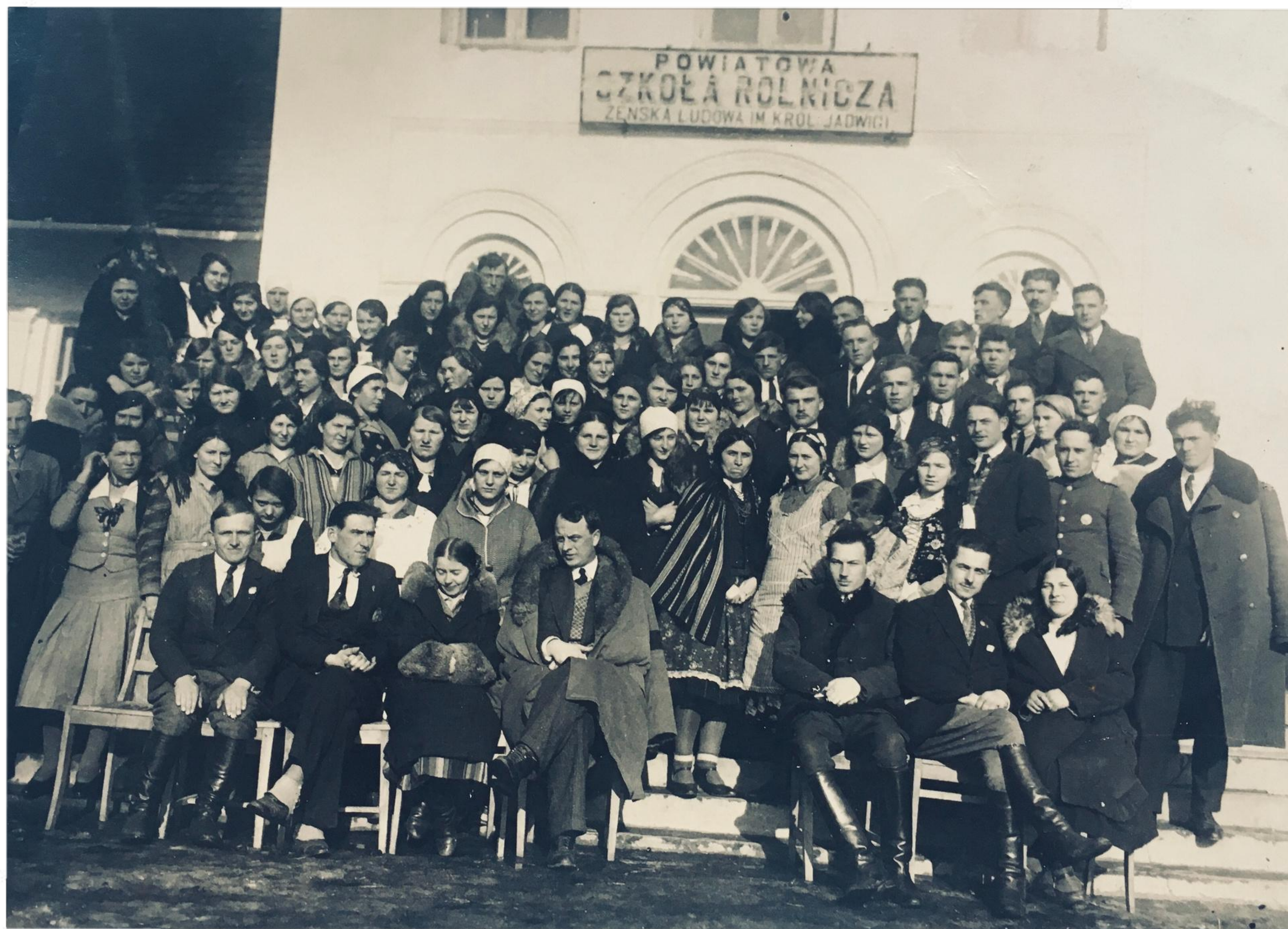
Uczestnicy kursu rolniczego - 1933