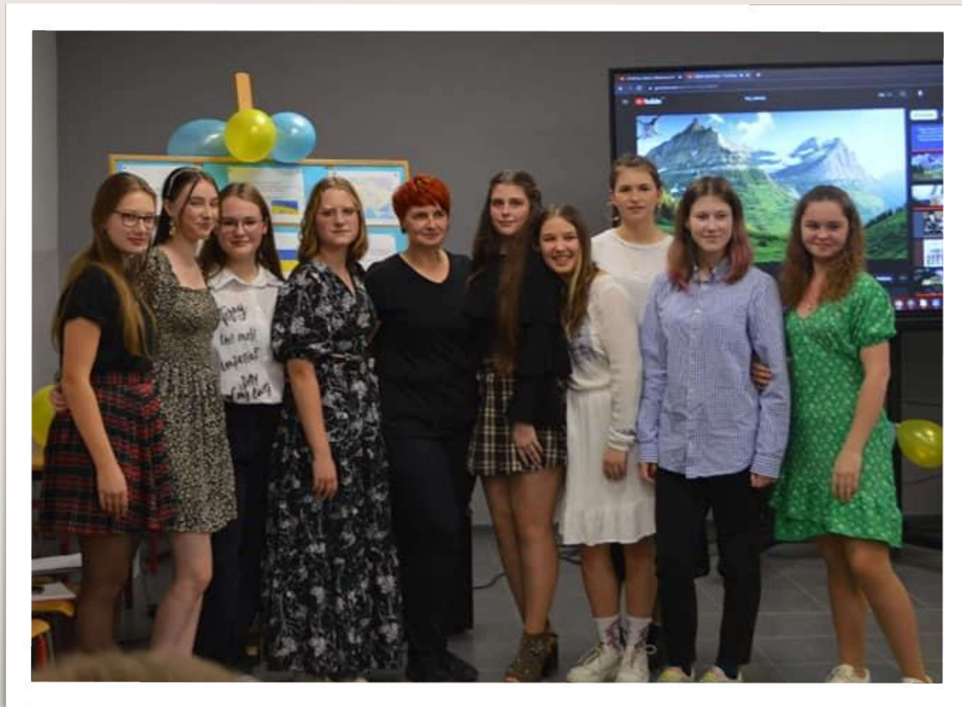
Projekt "Ukraina czy Polska - moje miejsce na ziemi"