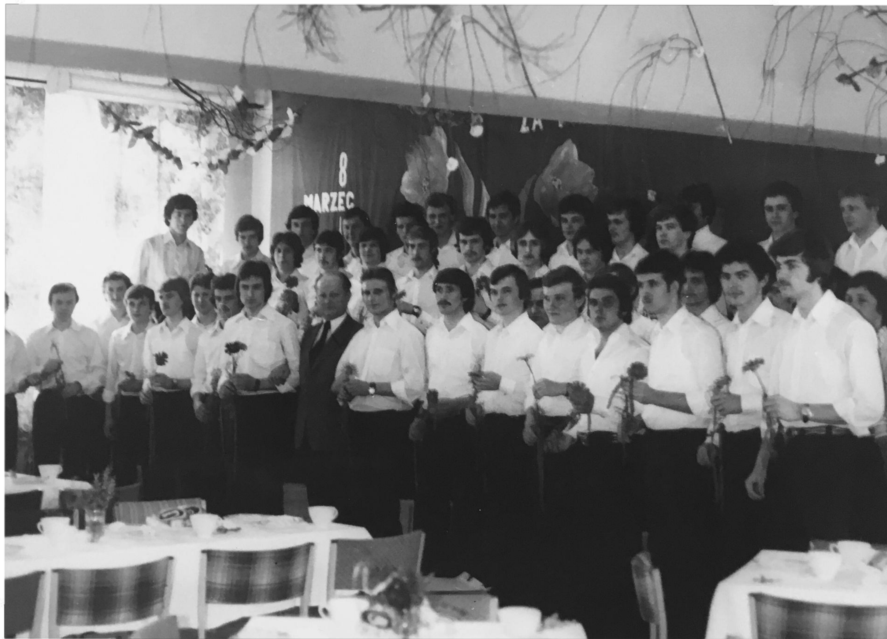
Akademia z okazji 8 Marca