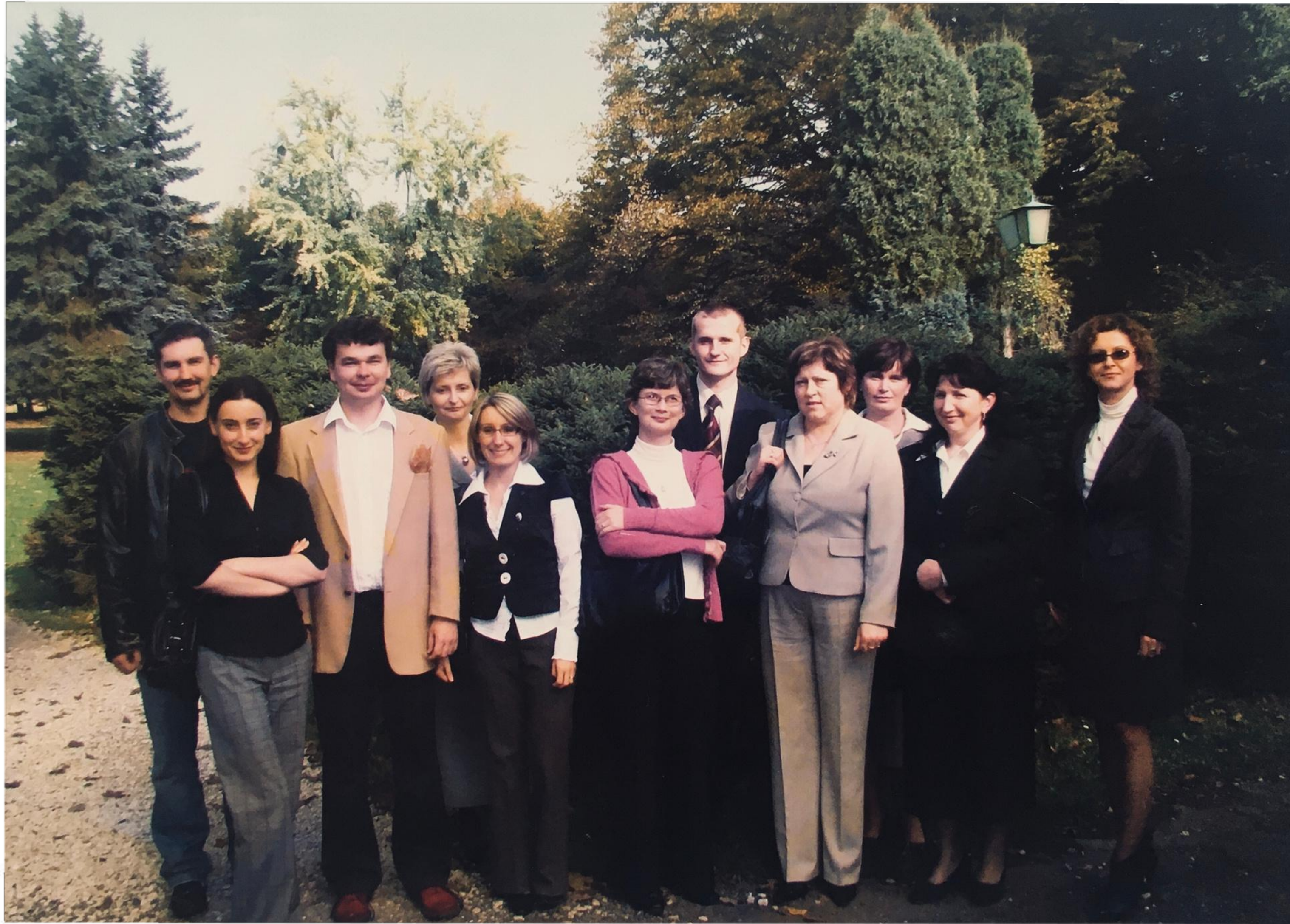
Nauczyciele i pracownicy administracji w Baranowie Sandomierskim - Październik 2008 r.