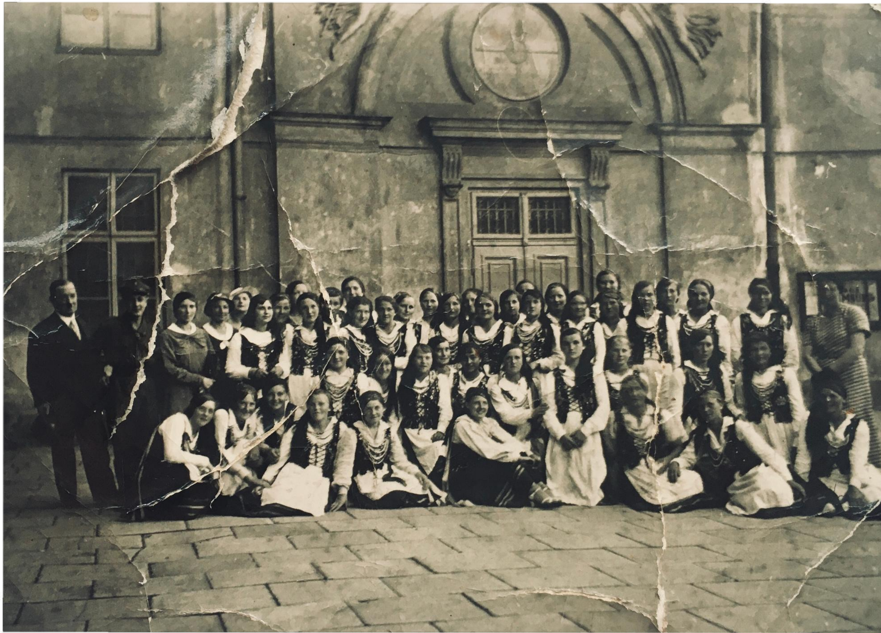
Uczennice na wycieczce w Warszawie - 1935 r.