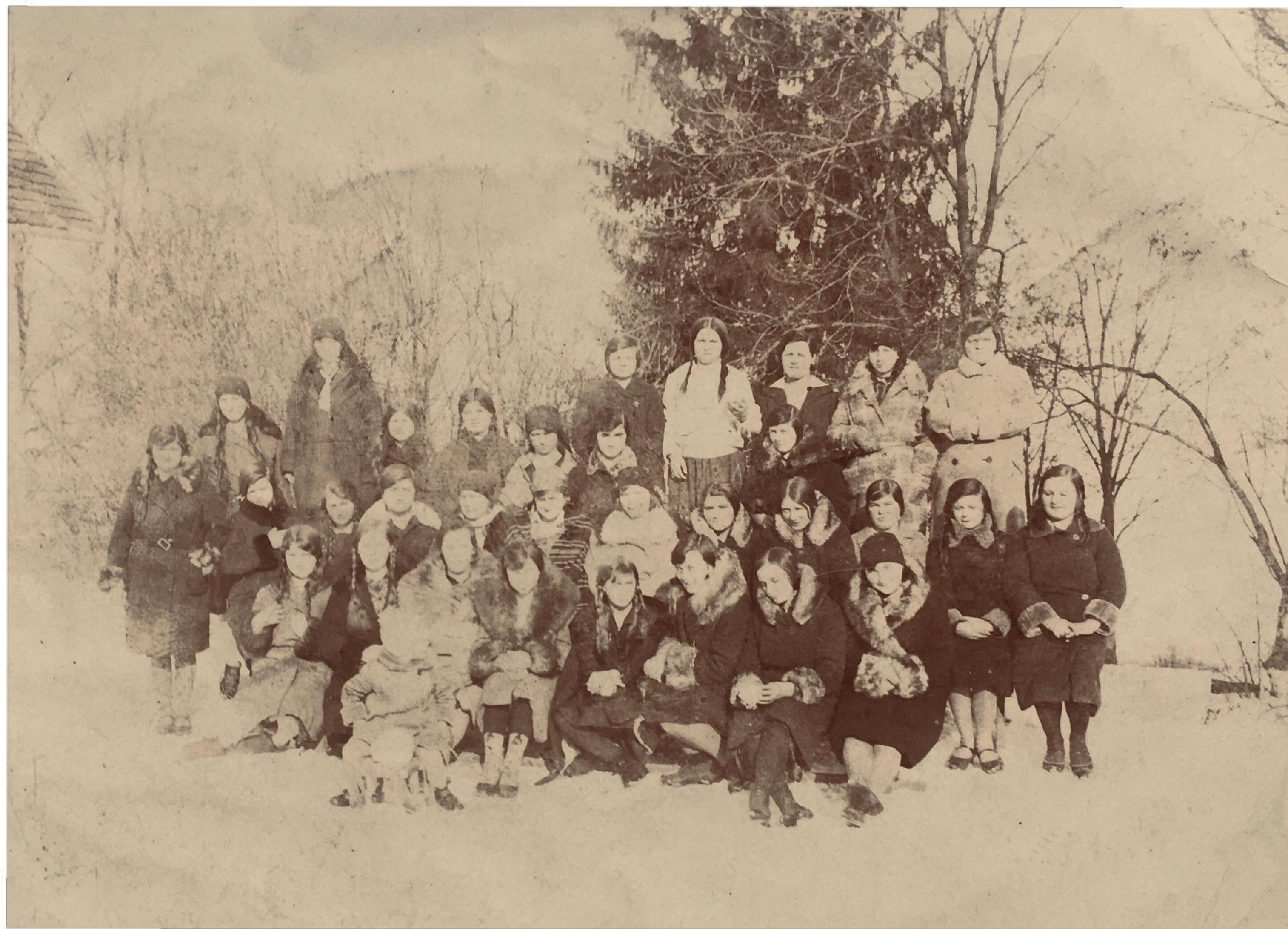
Uczennice i nauczyciele - lata 30.