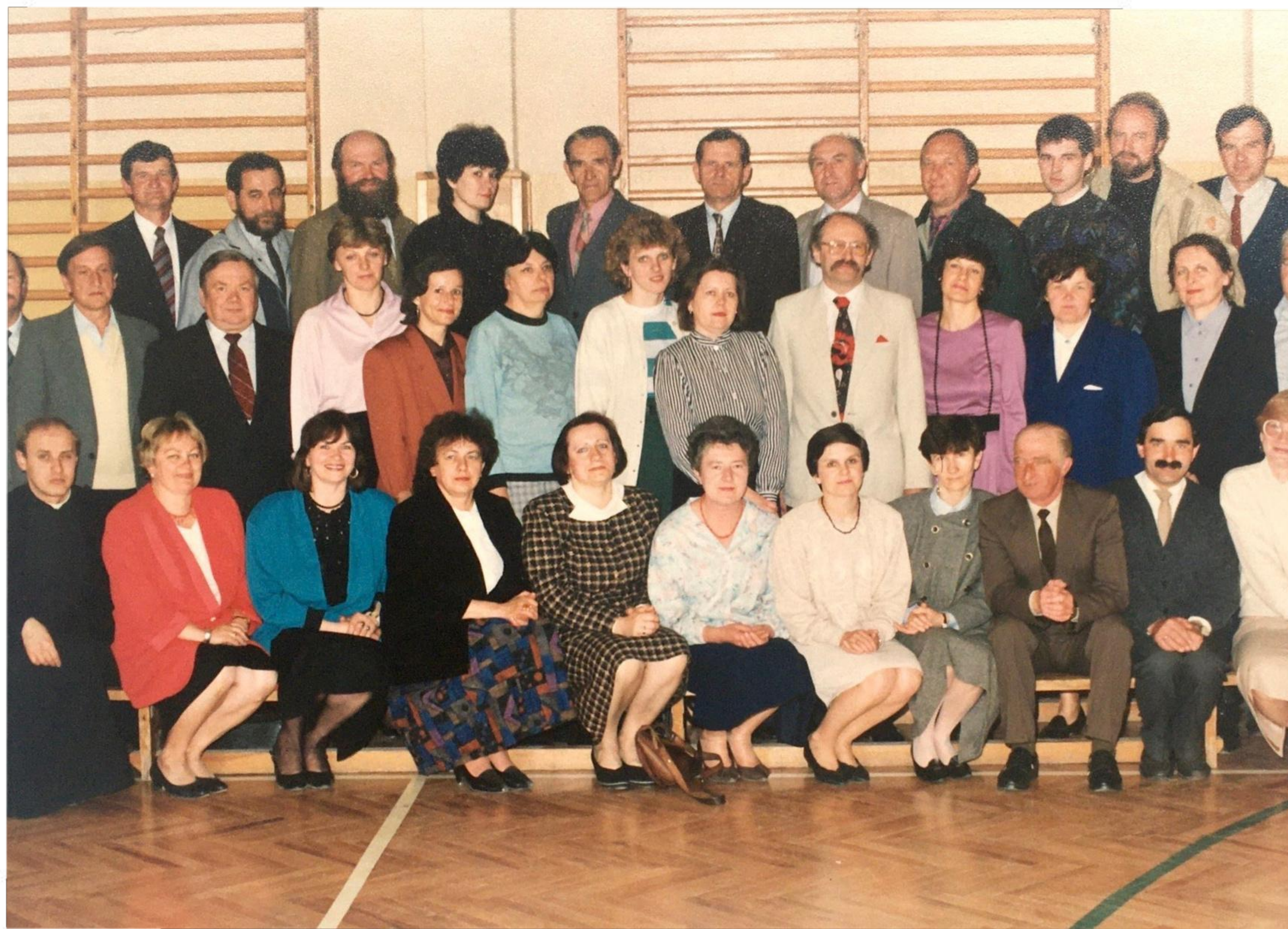
Rada Pedagogiczna - lata 90.