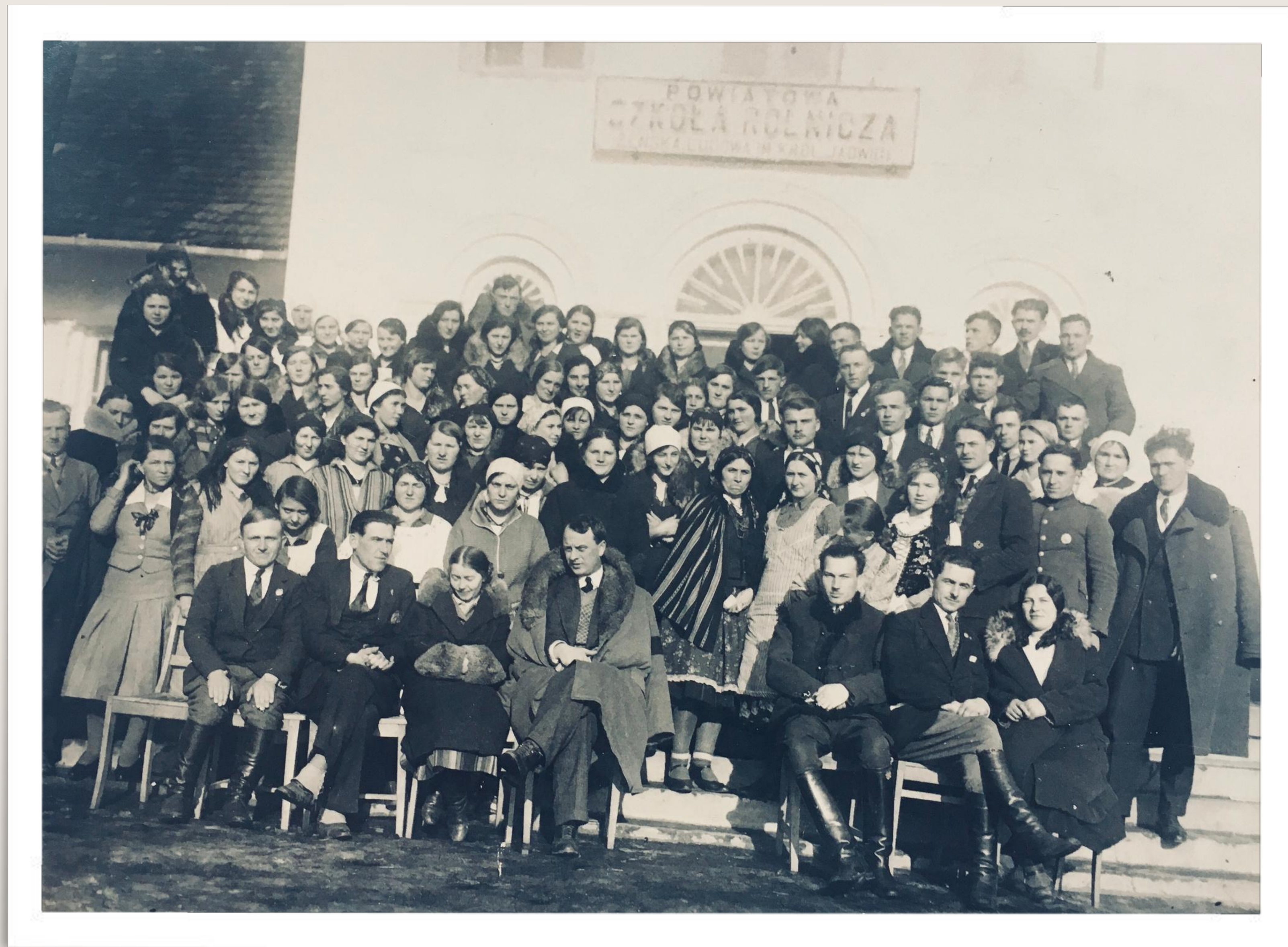
Zjazd wychowanków szkół rolniczych z powiatu sandomierskiego