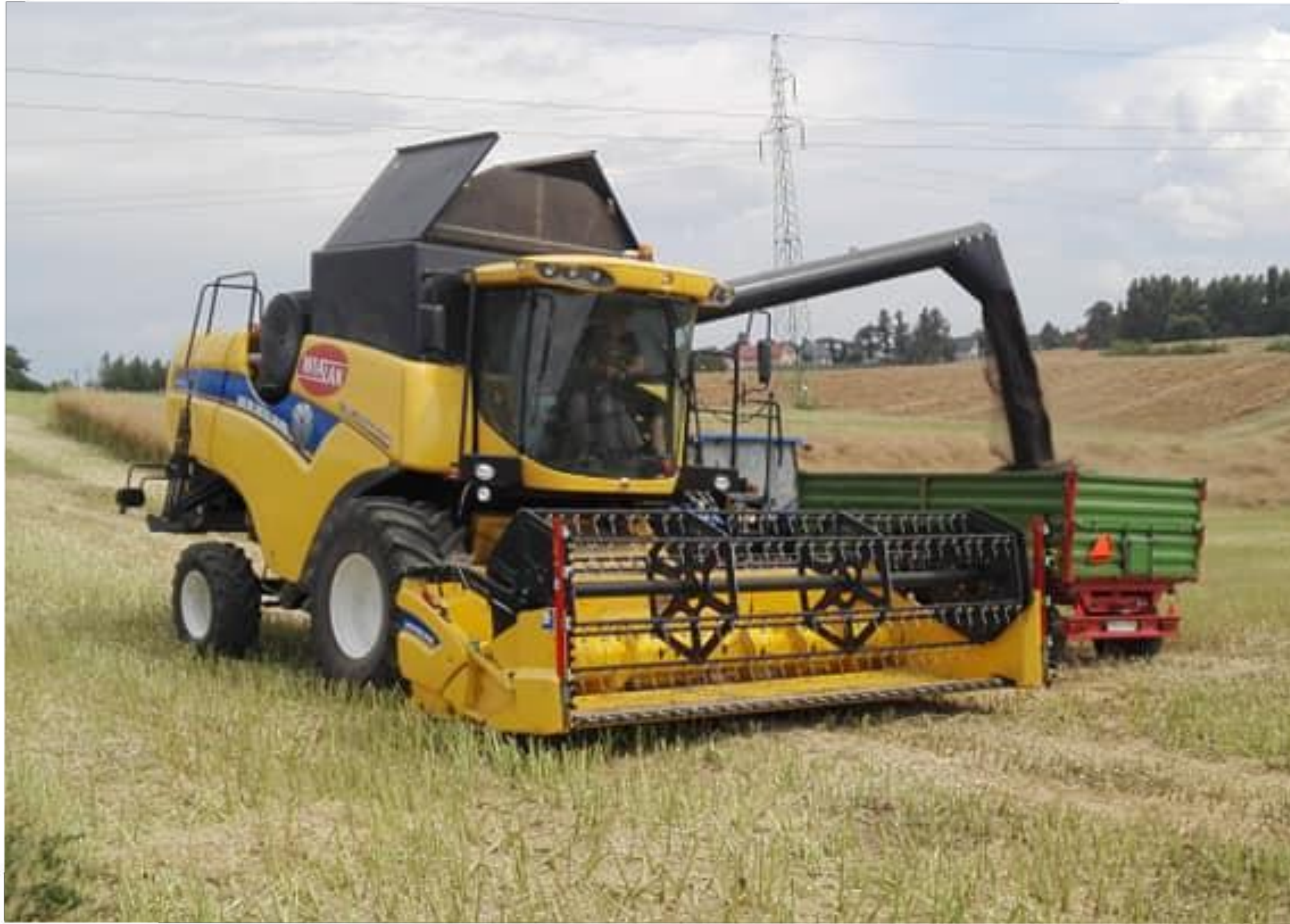
Kombajn New Holland CX 5080