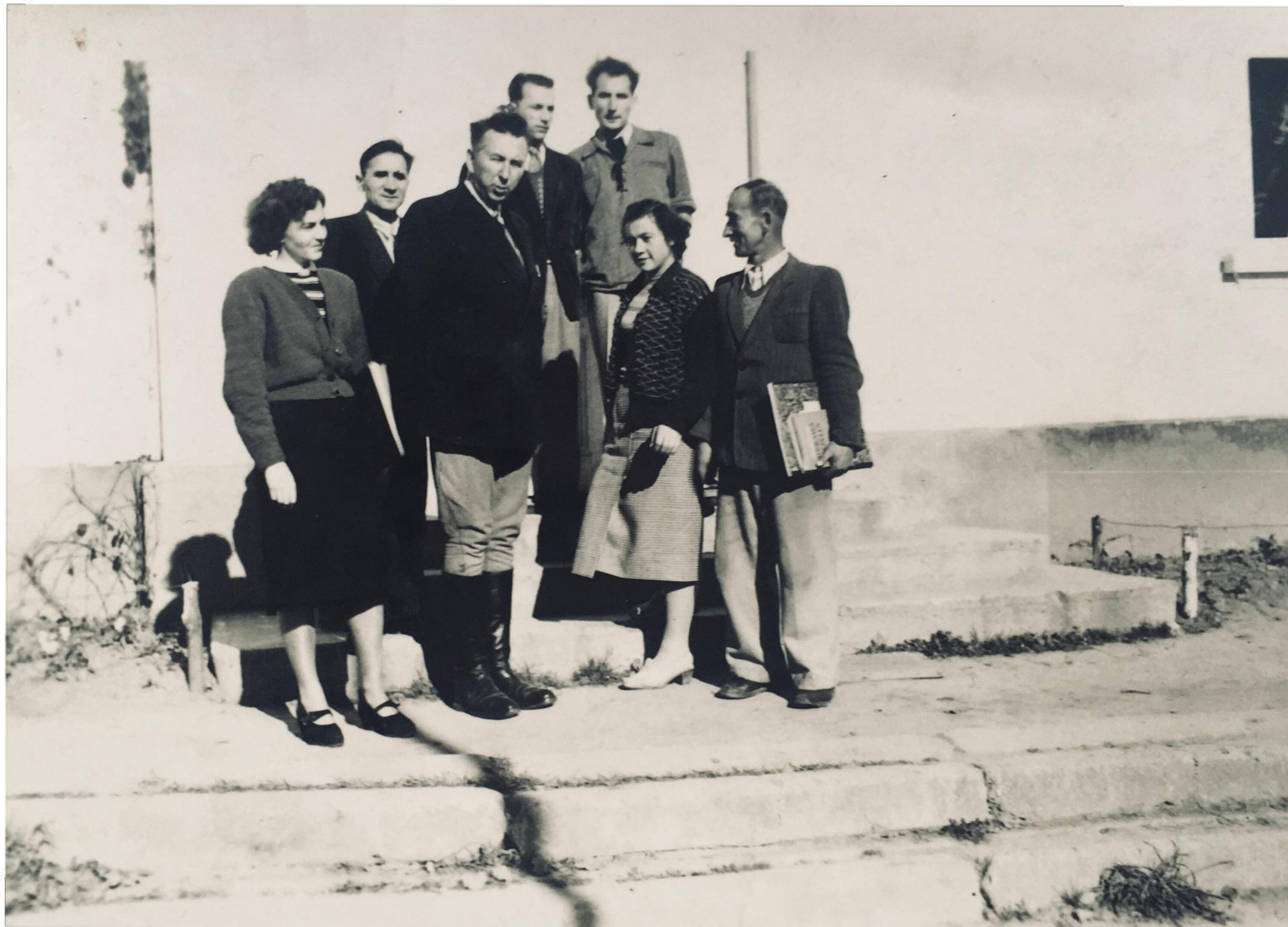
Nauczyciele - 1950 r.