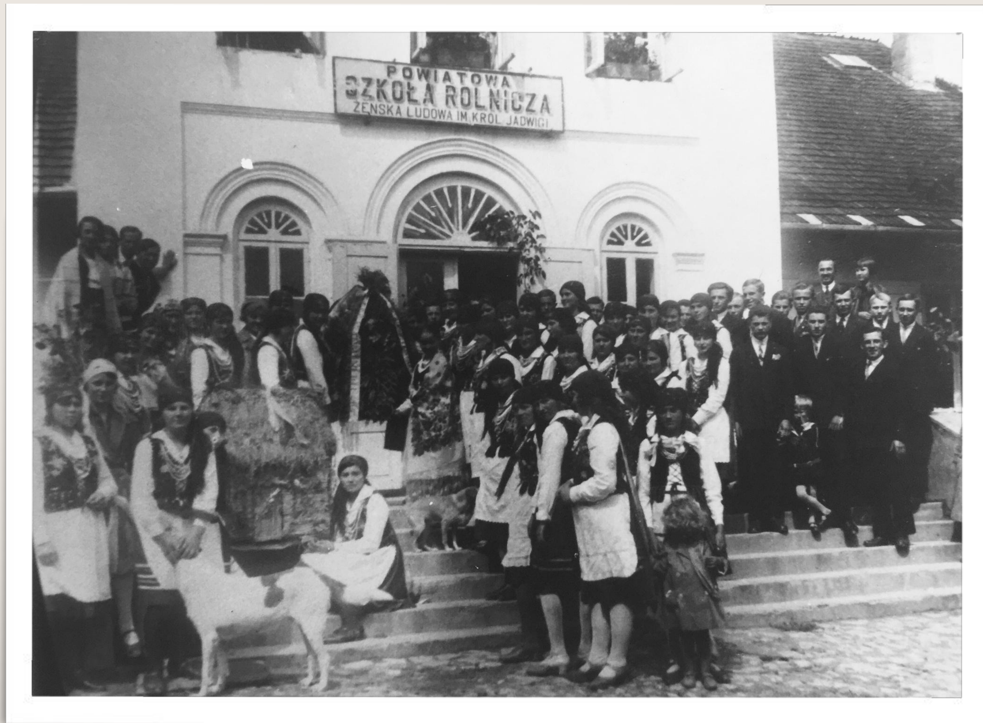
Wręczenie wieńca dożynkowego - 15 sierpnia 1930 r.