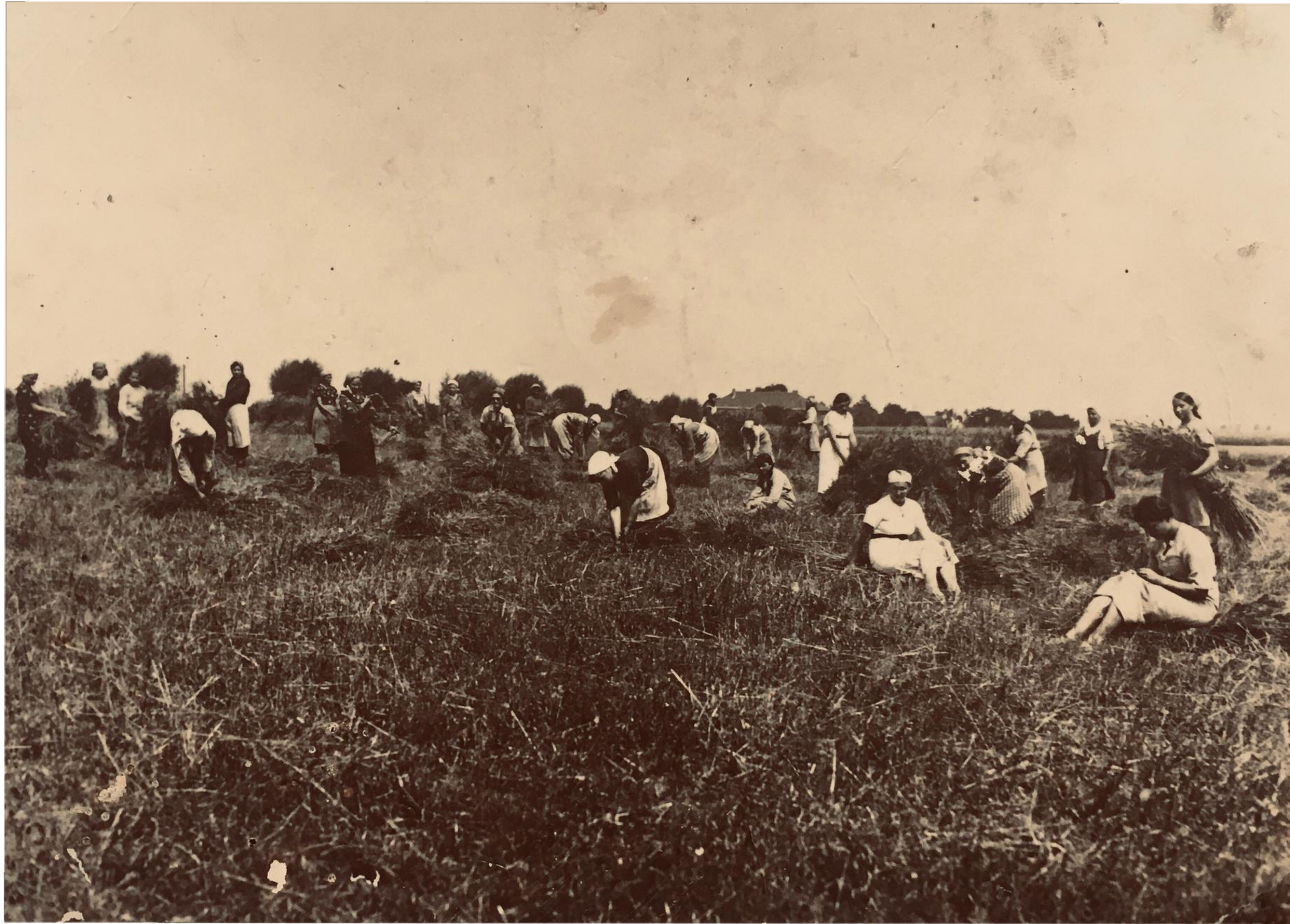
Zbiór pszenicy - 16 lipca 1937 r.