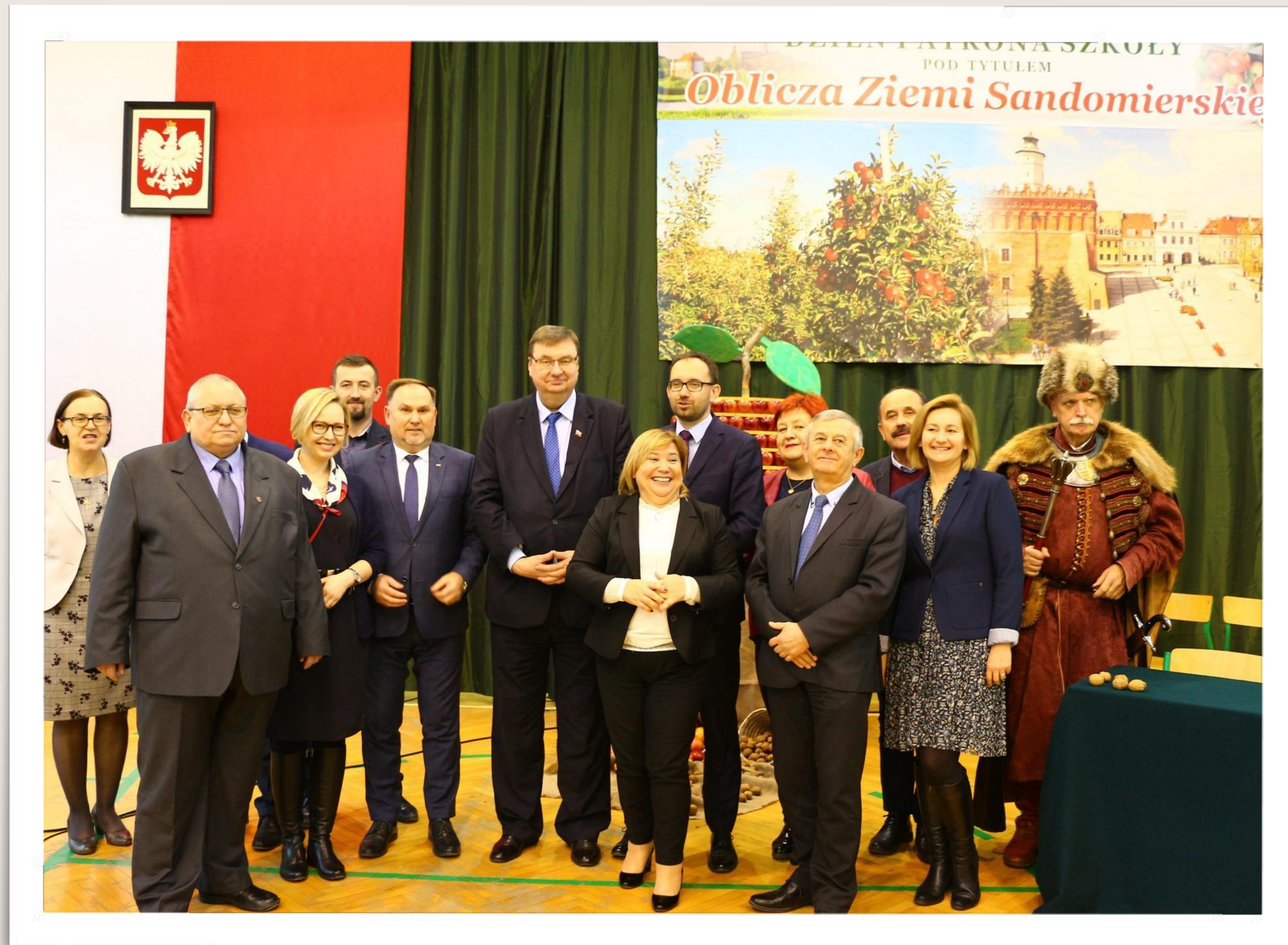
Pierwsze obchody Dnia Patrona Szkoły pod tytułem "Oblicza Ziemi Sandomierskiej" - 11 grudnia 2019 r.