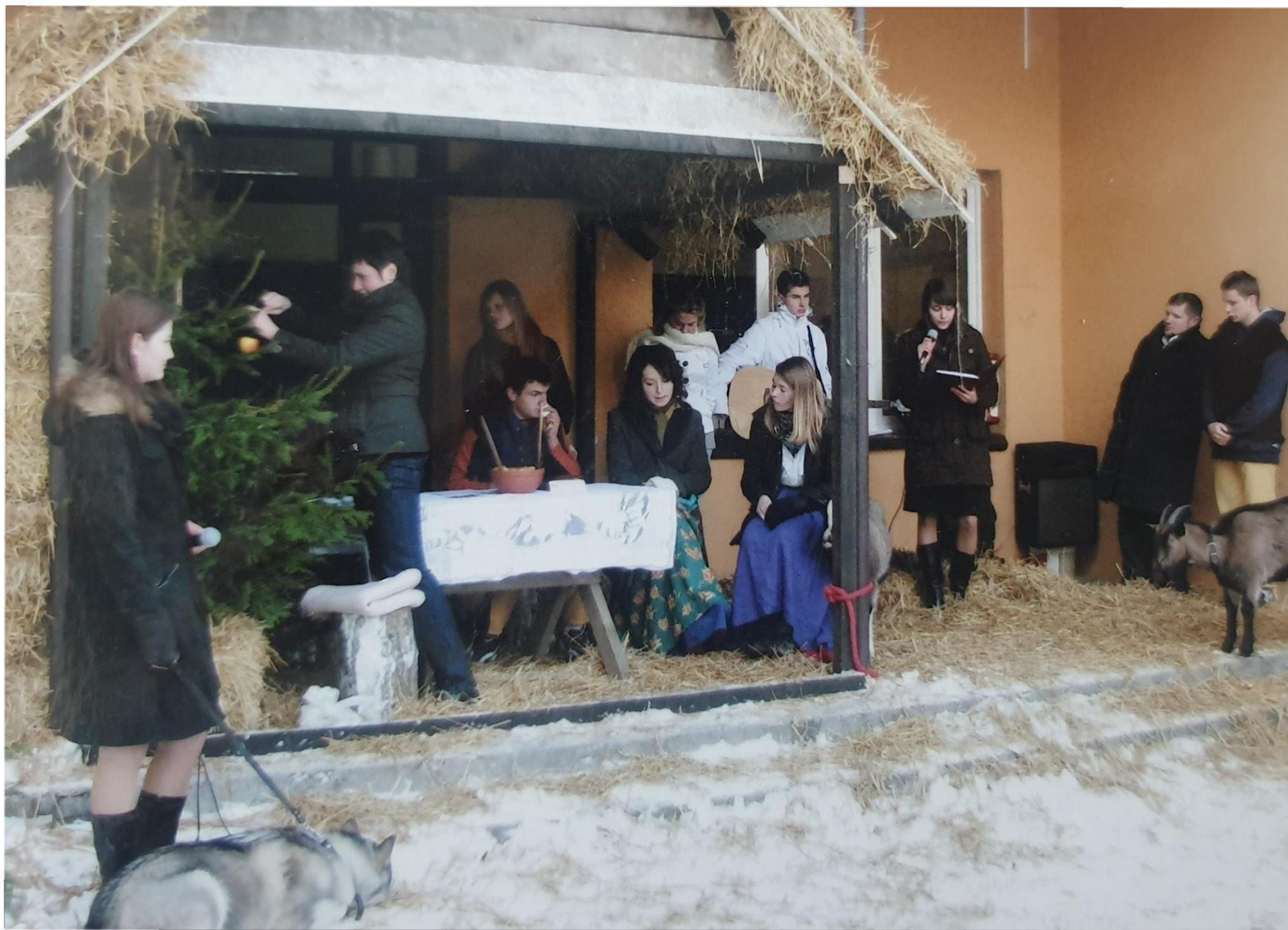
"Żywa szopka" - 2009 r.