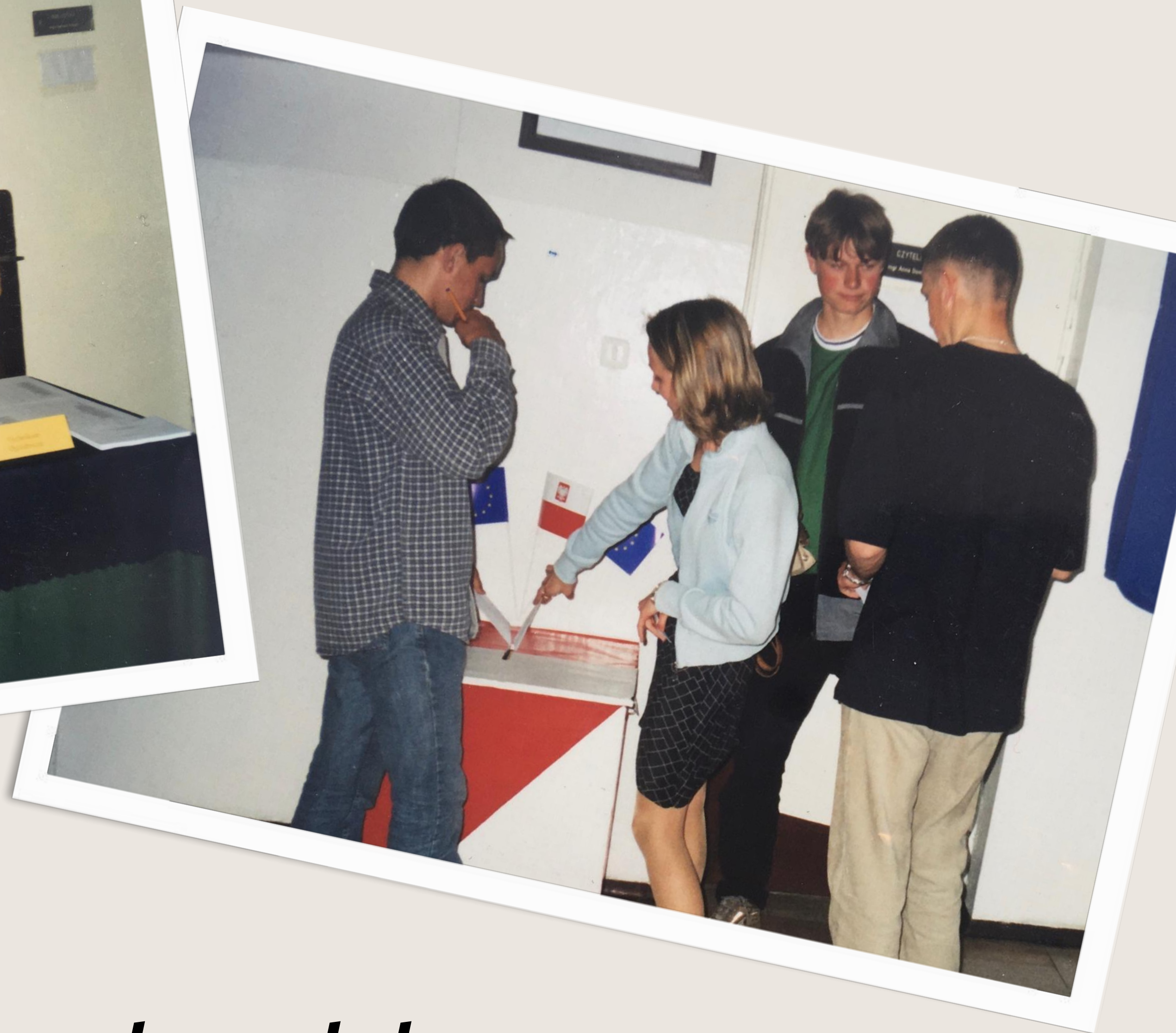
Prareferendum szkolne za przystąpieniem Polski do Unii Europejskiej