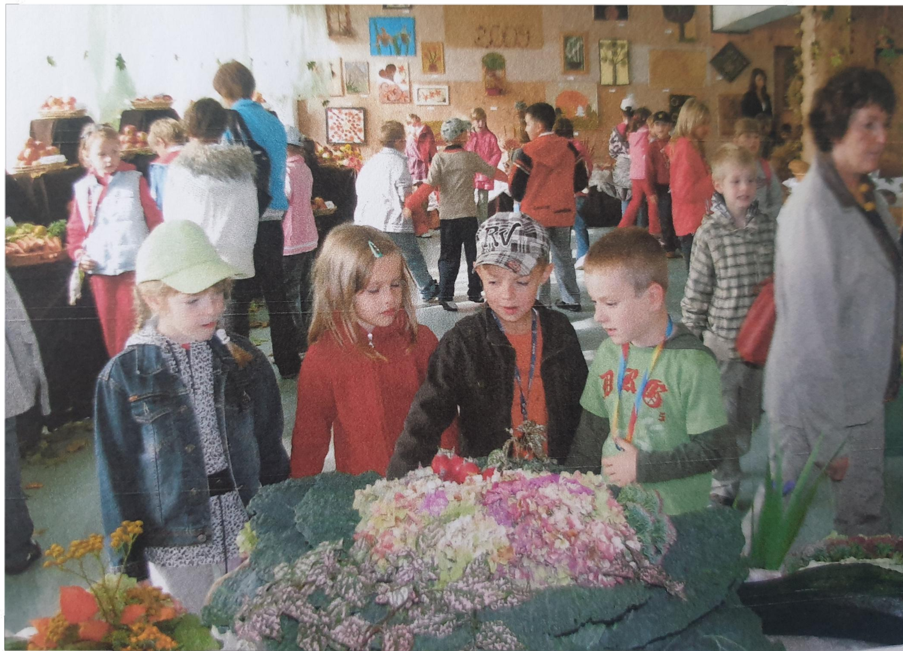
Dni Otwarte Szkoły - 2009 r.