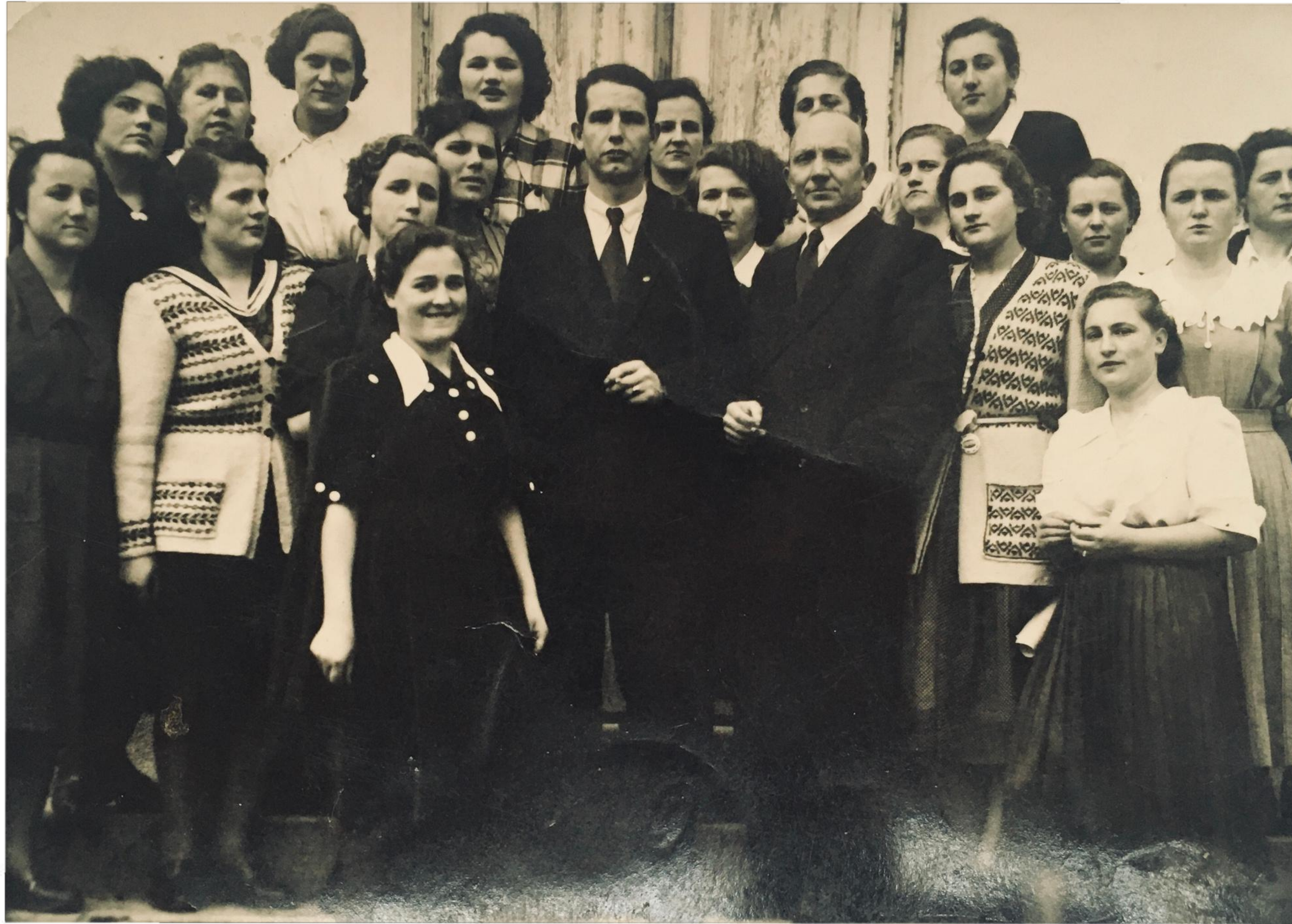
Nauczyciele - 1950