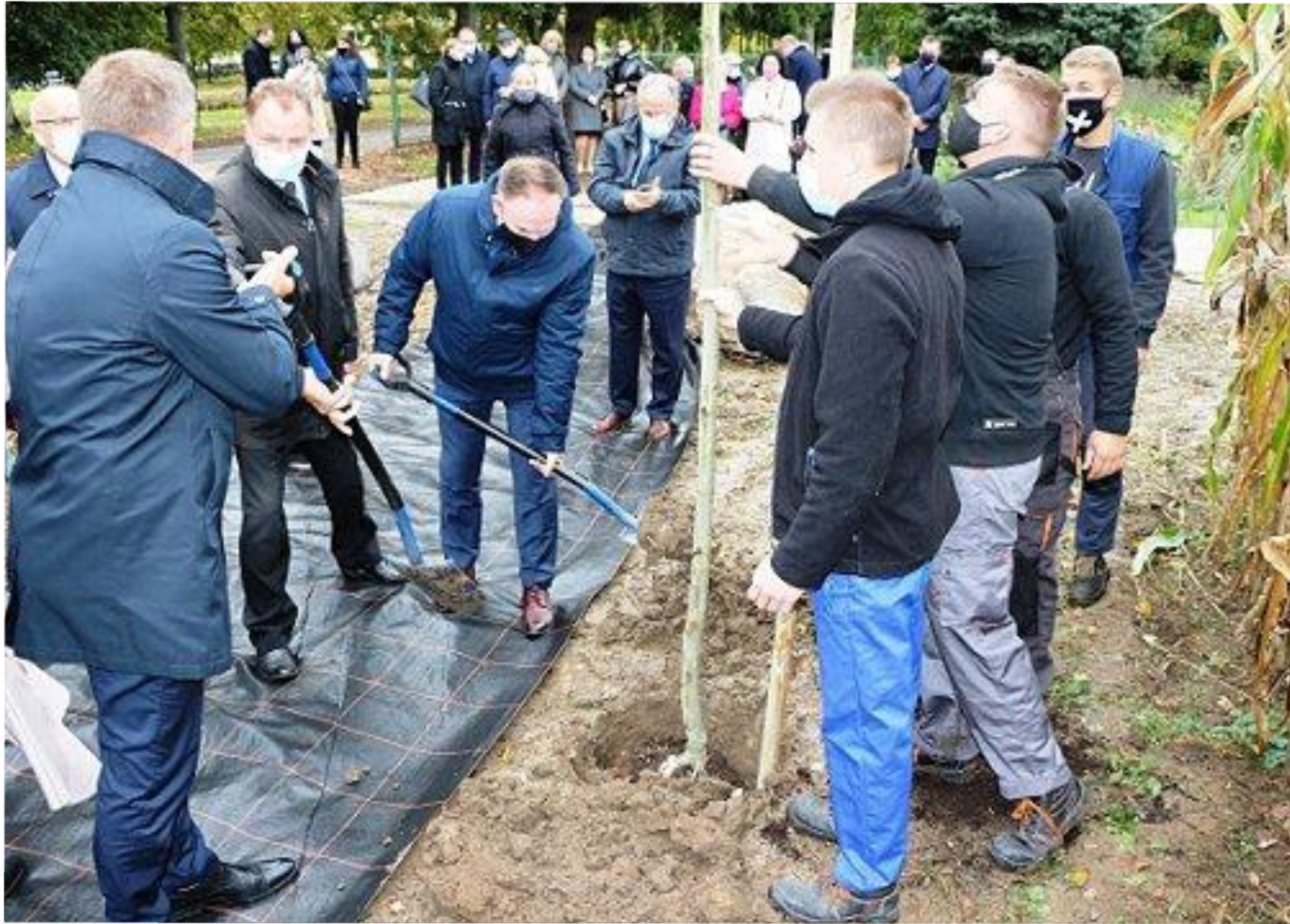
Zakładanie Alei Platanowej - zainicjowanie obchodów stulecia szkoły -