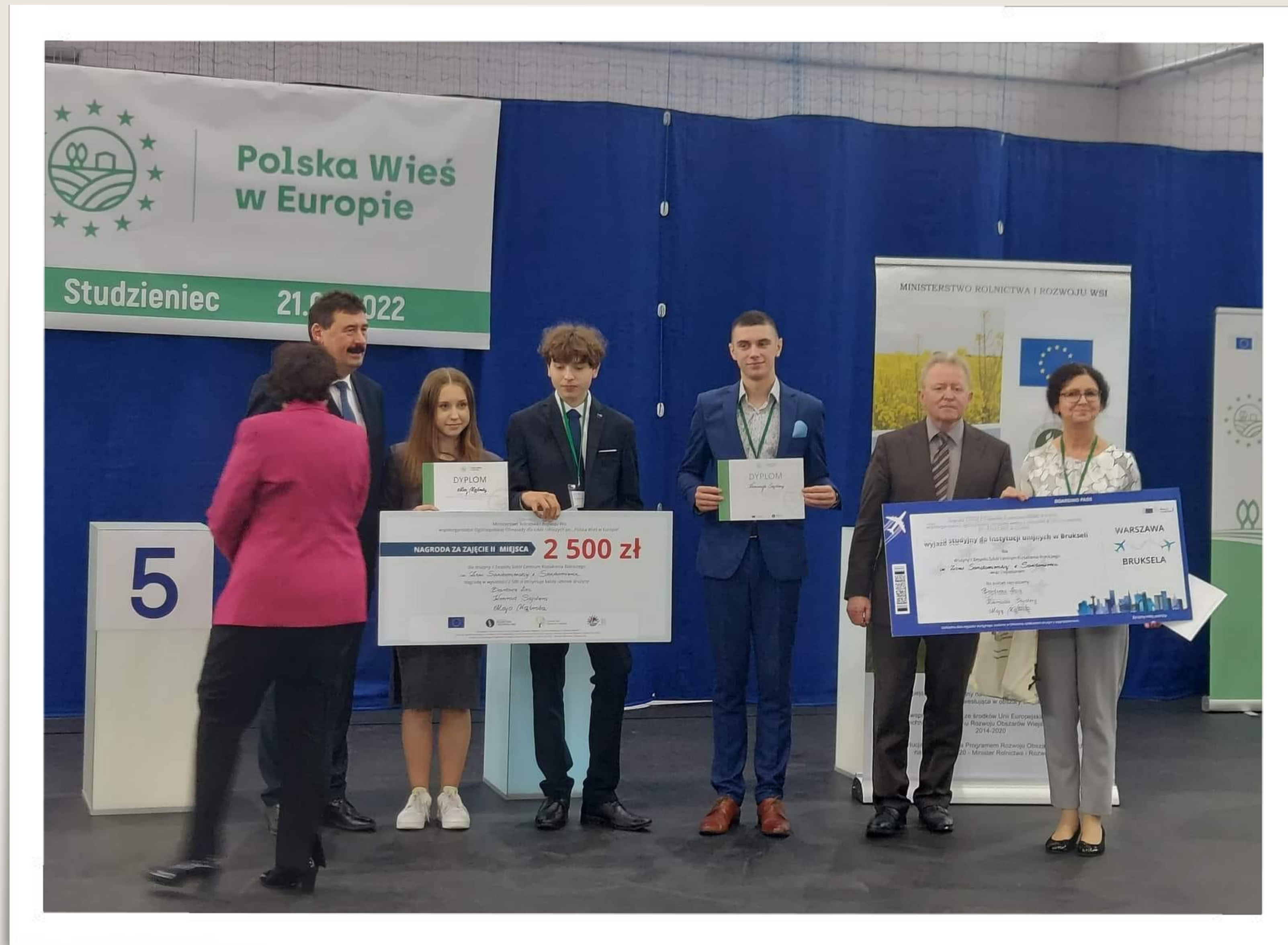
Opiekun i laureaci Ogólnopolskiej Olimpiady Szkół Rolniczych