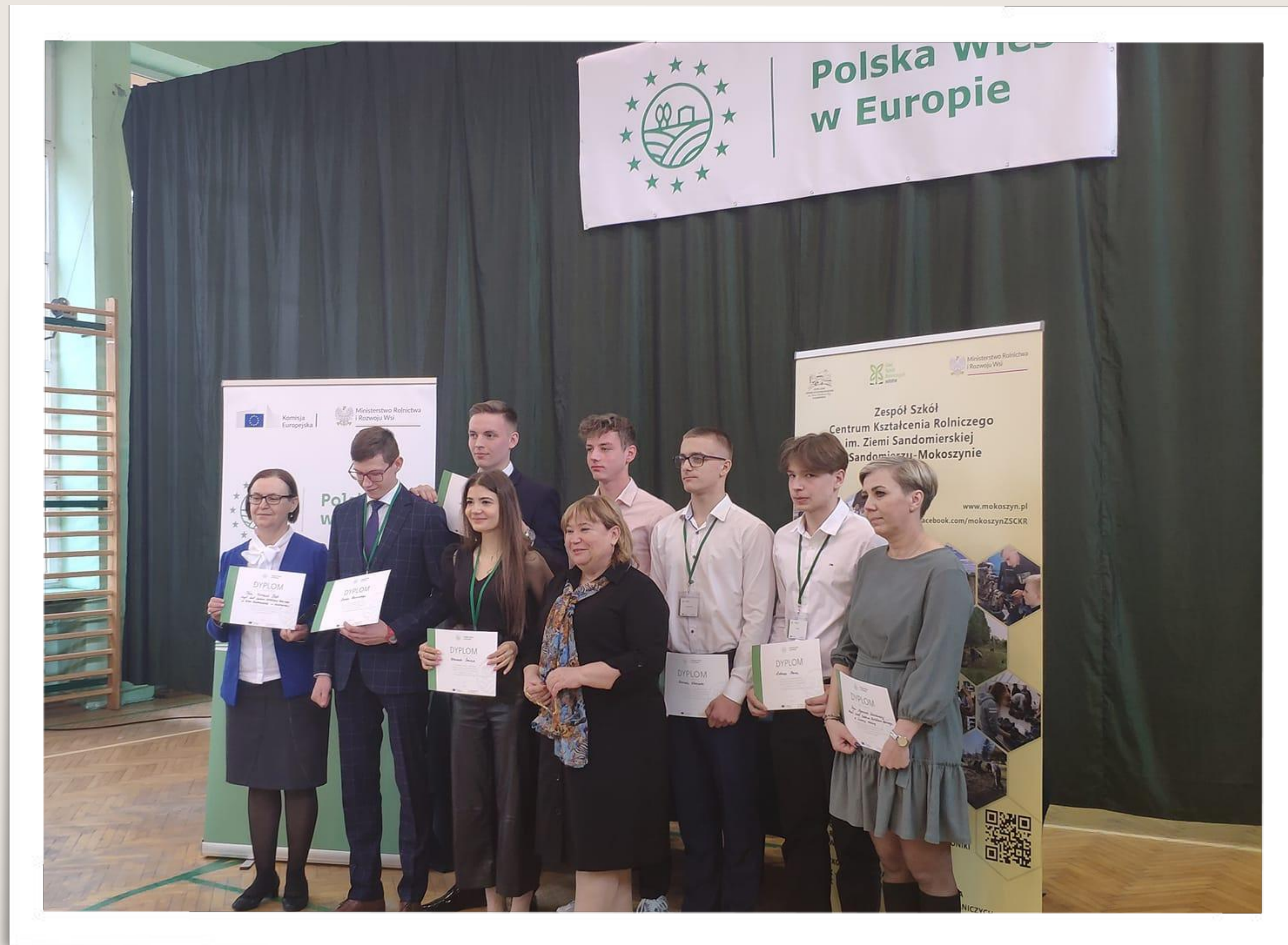
Opiekun i laureaci Ogólnopolskiej Olimpiady Szkół Rolniczych