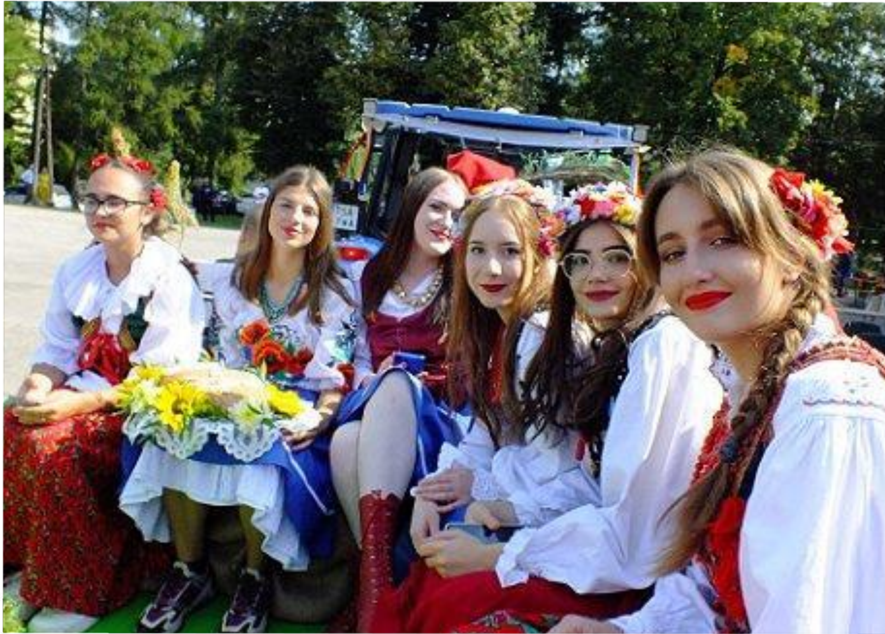
1 Mokozyńskie Święto Plonów - 12 września 2021 r.