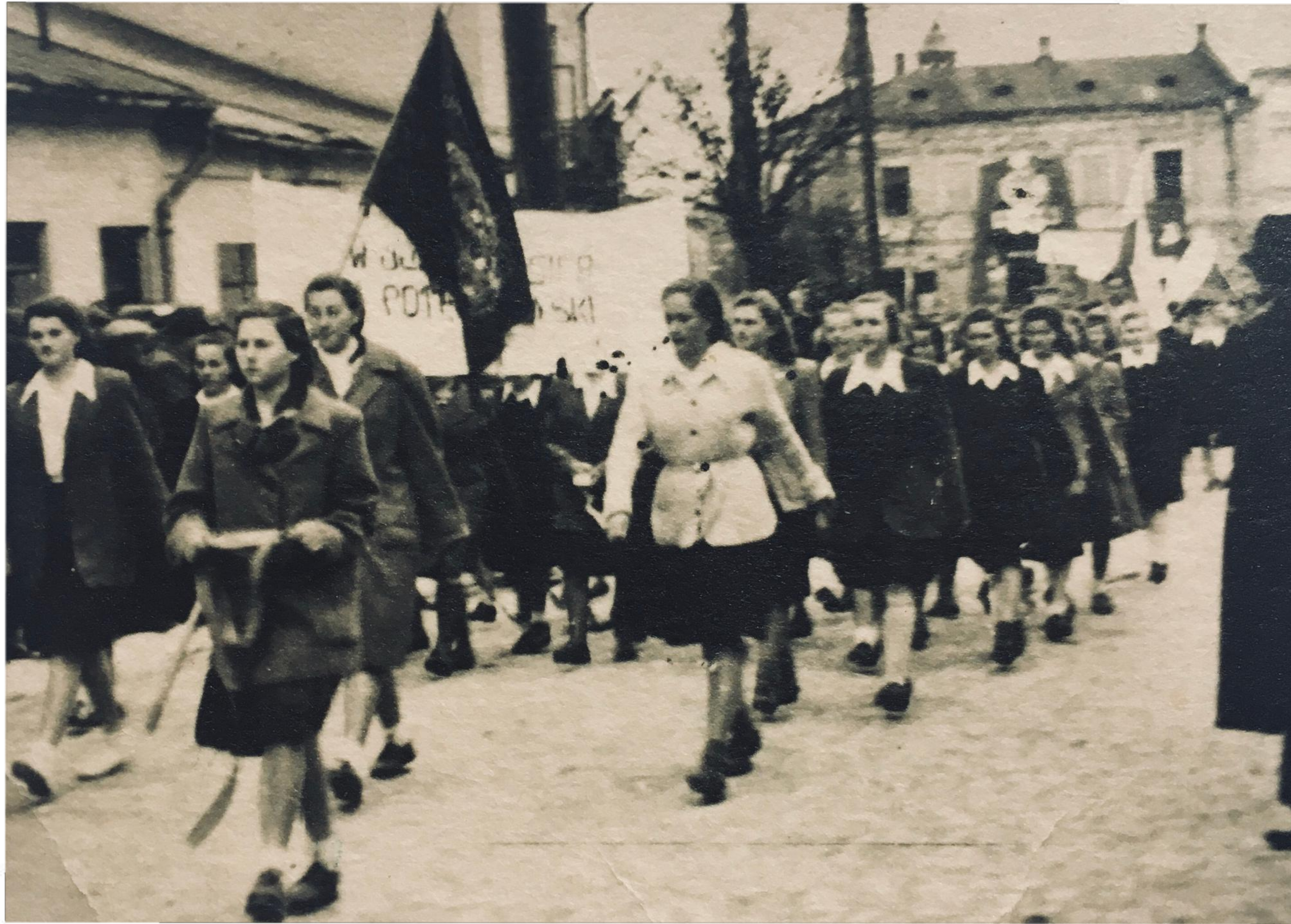
Uczennice idą do kościoła ze sztandarem szkoły - 1949