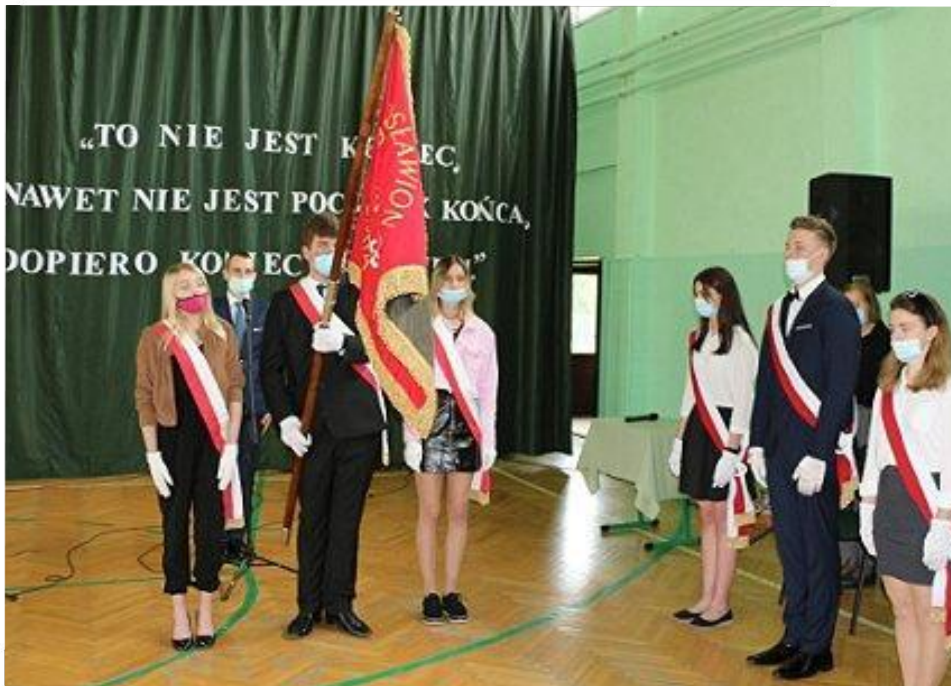
Początek nauki zdalnej z powodu pandemii koronawirusa