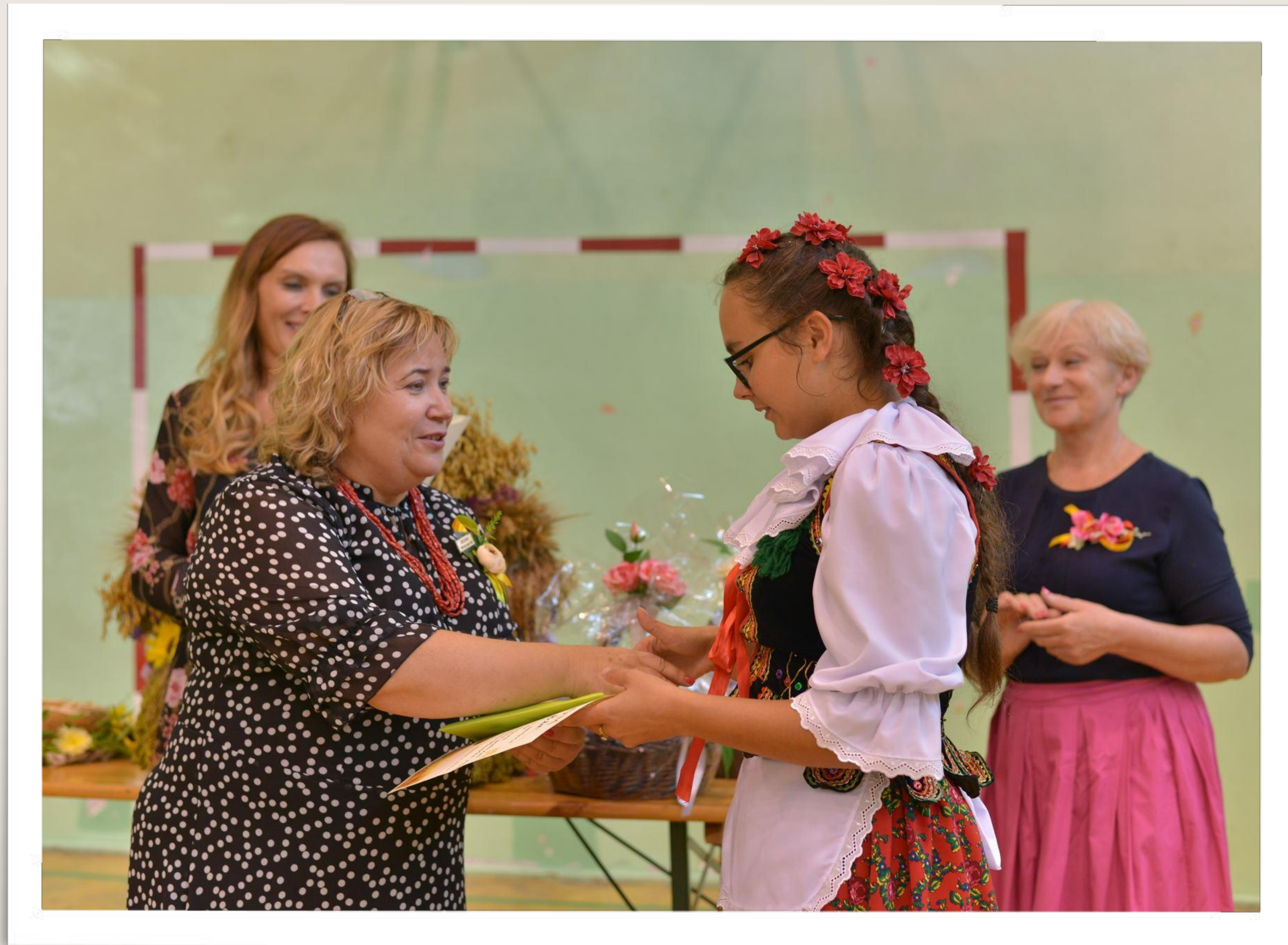
1 Mokozyńskie Święto Plonów - 12 września 2021 r.