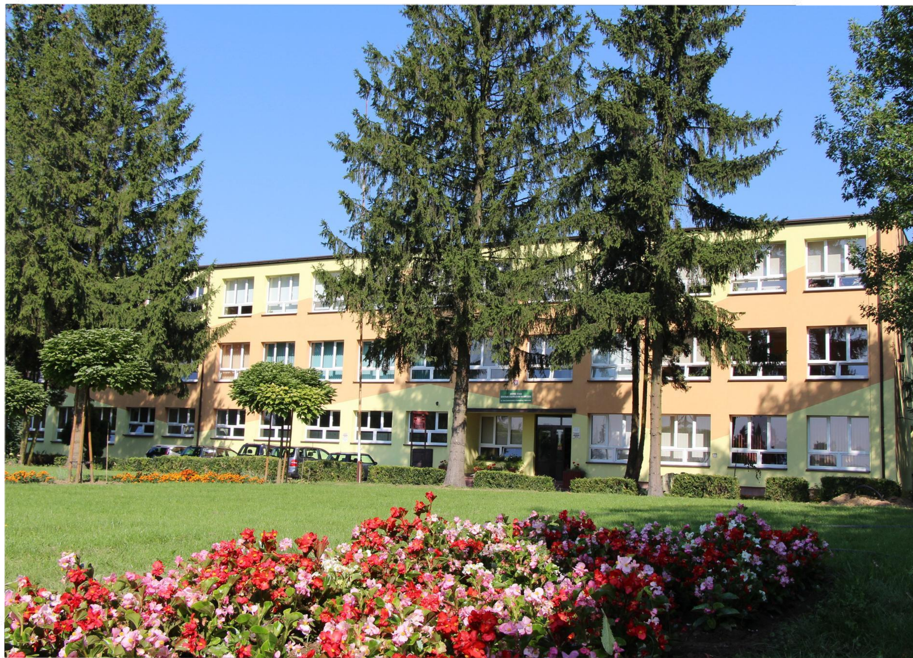
Obecny budynek szkoły