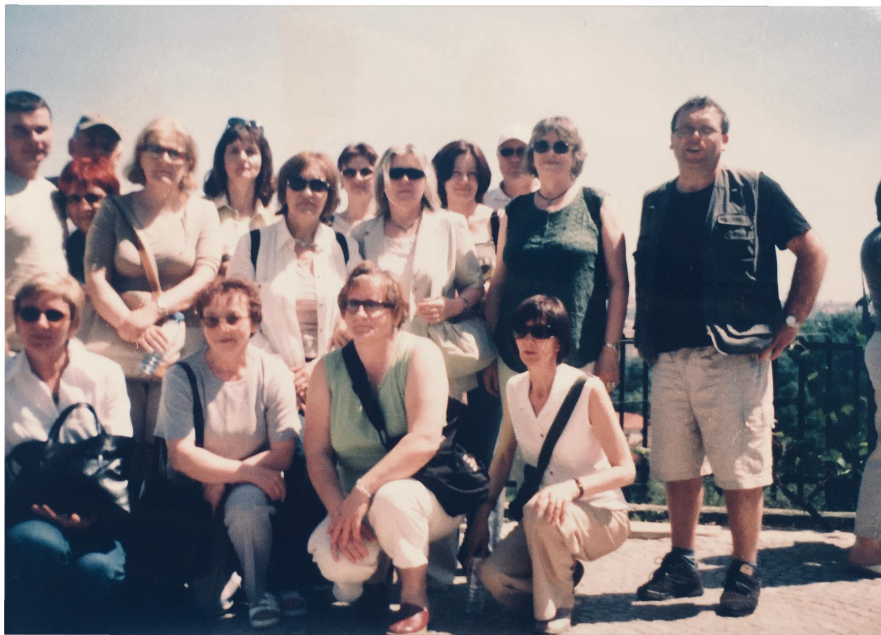
Nauczyciele na wycieczce w Pradze - 2005