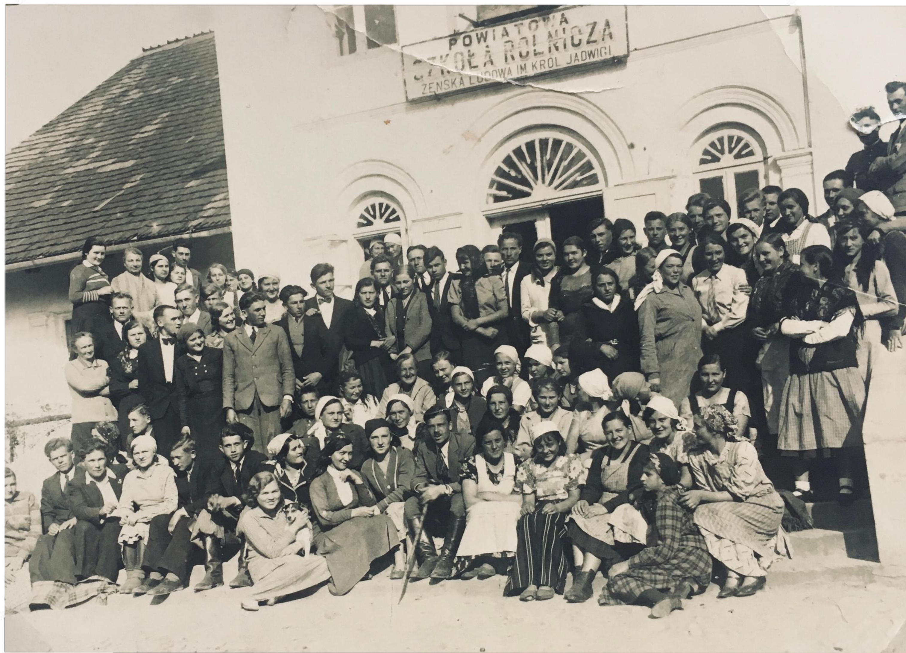
Młodzież szkolna z nauczycielami