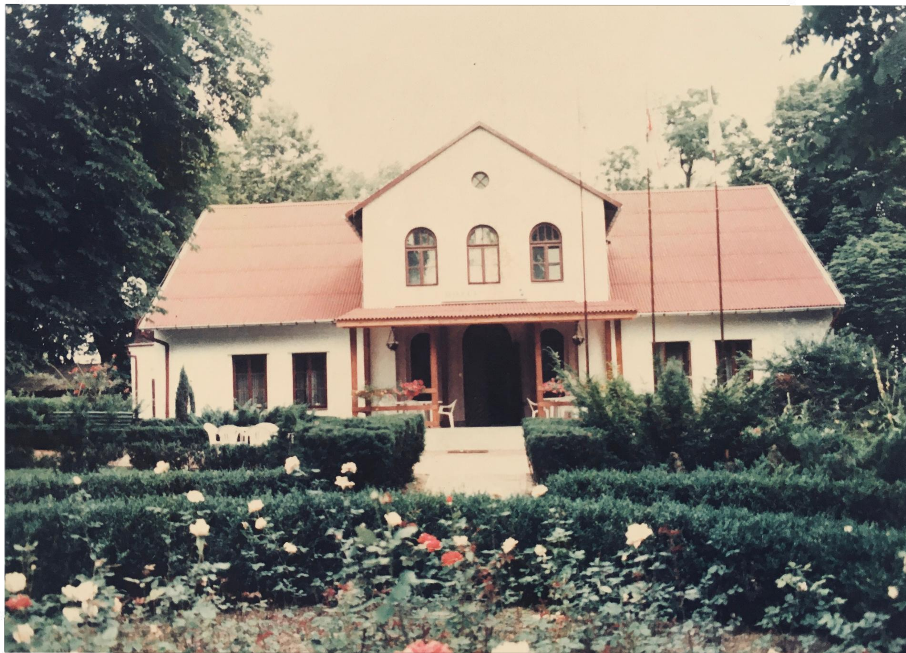
Pierwszy budynek szkoły - obecnie Hotel "Agro"