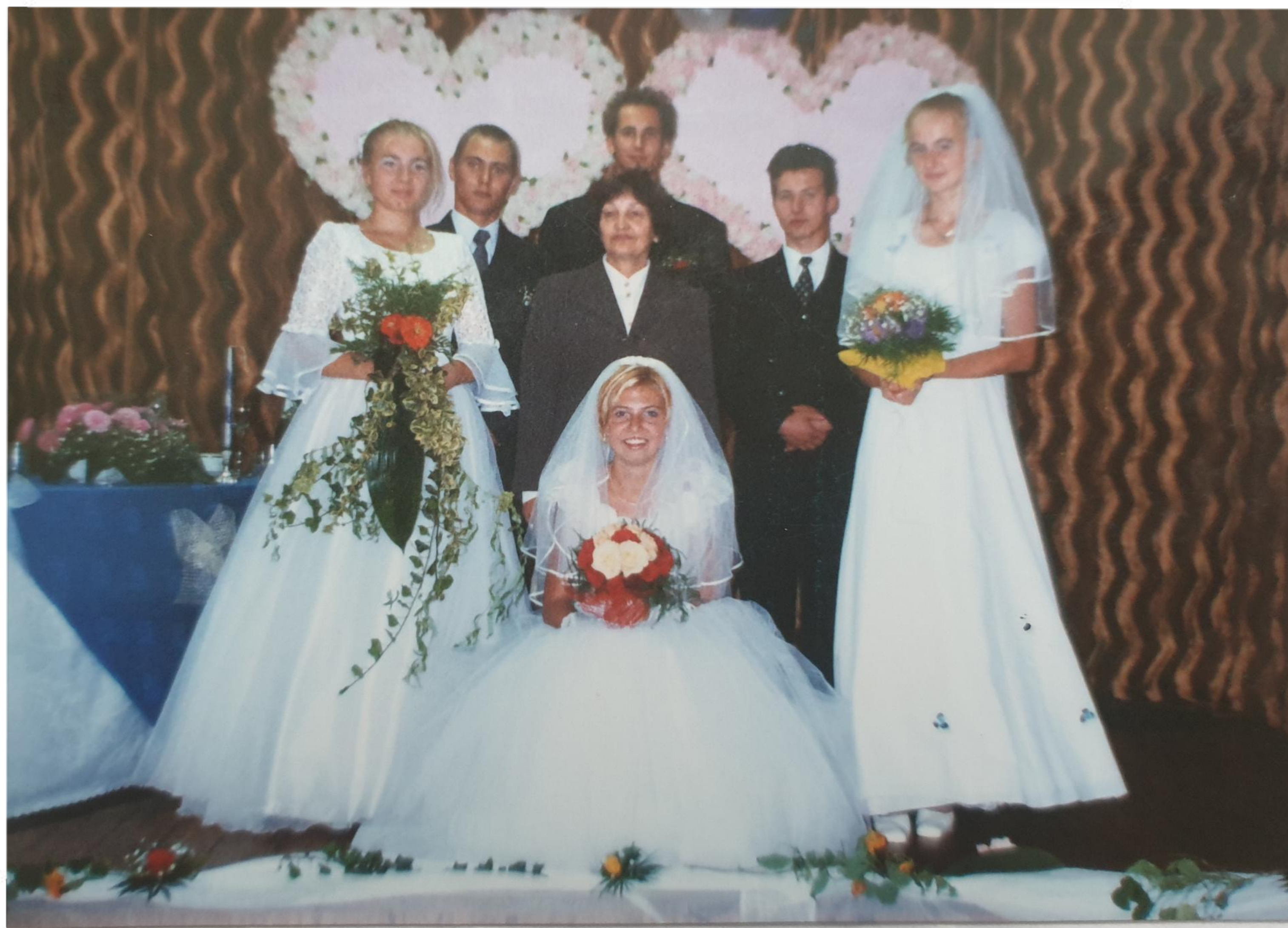
Prezentacja bukietów ślubnych - prace dyplomowe uczennic klasy V technikum