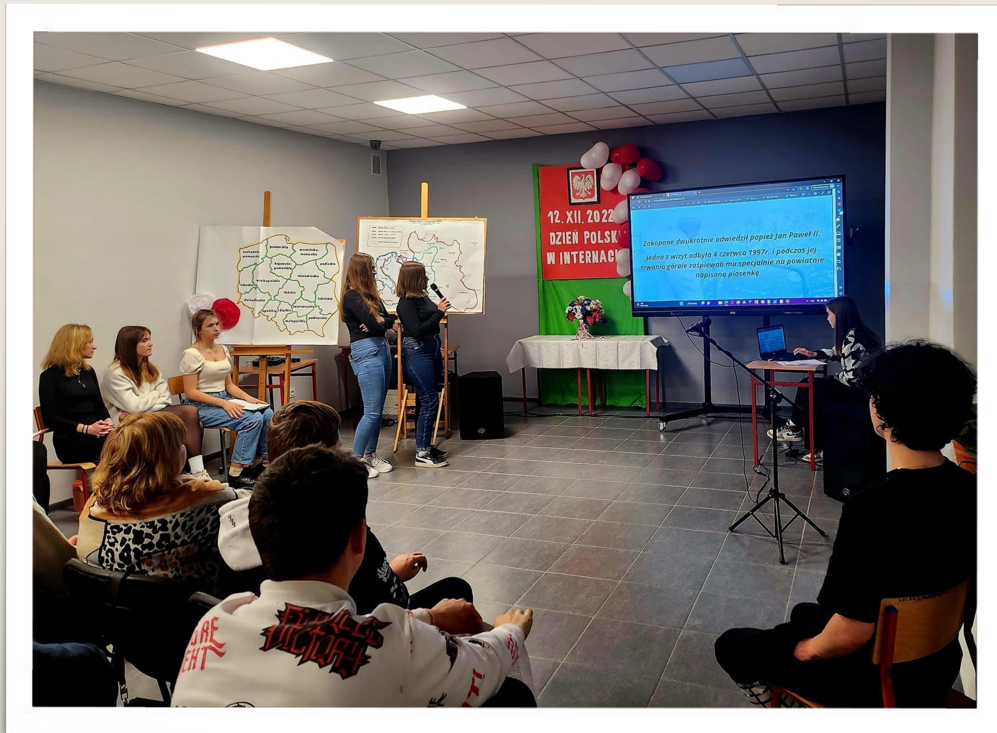
Projekt "Ukraina czy Polska - moje miejsce na ziemi"