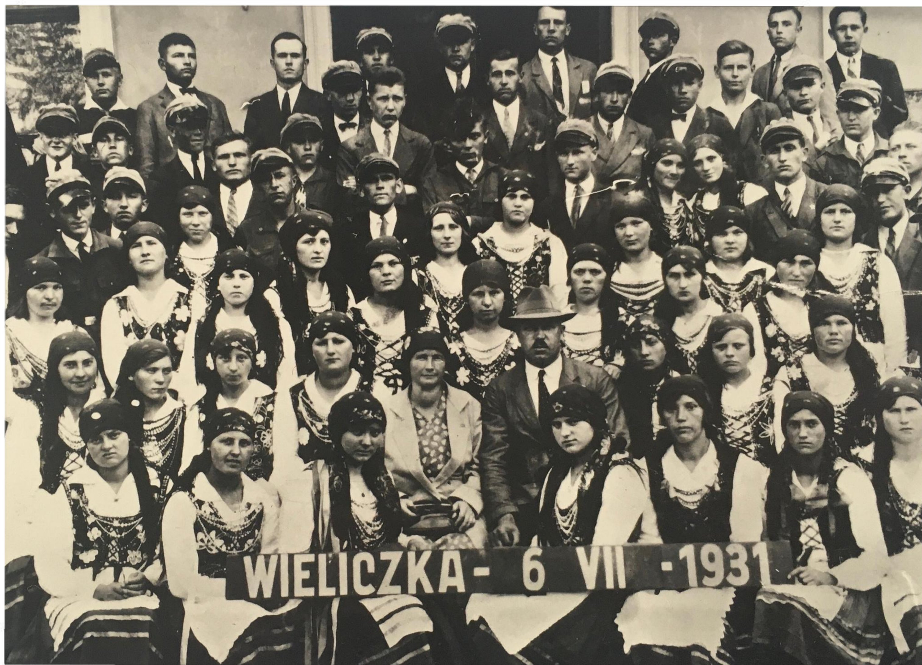
Uczniowie na 10-dniowej wycieczce po Polsce - 1931