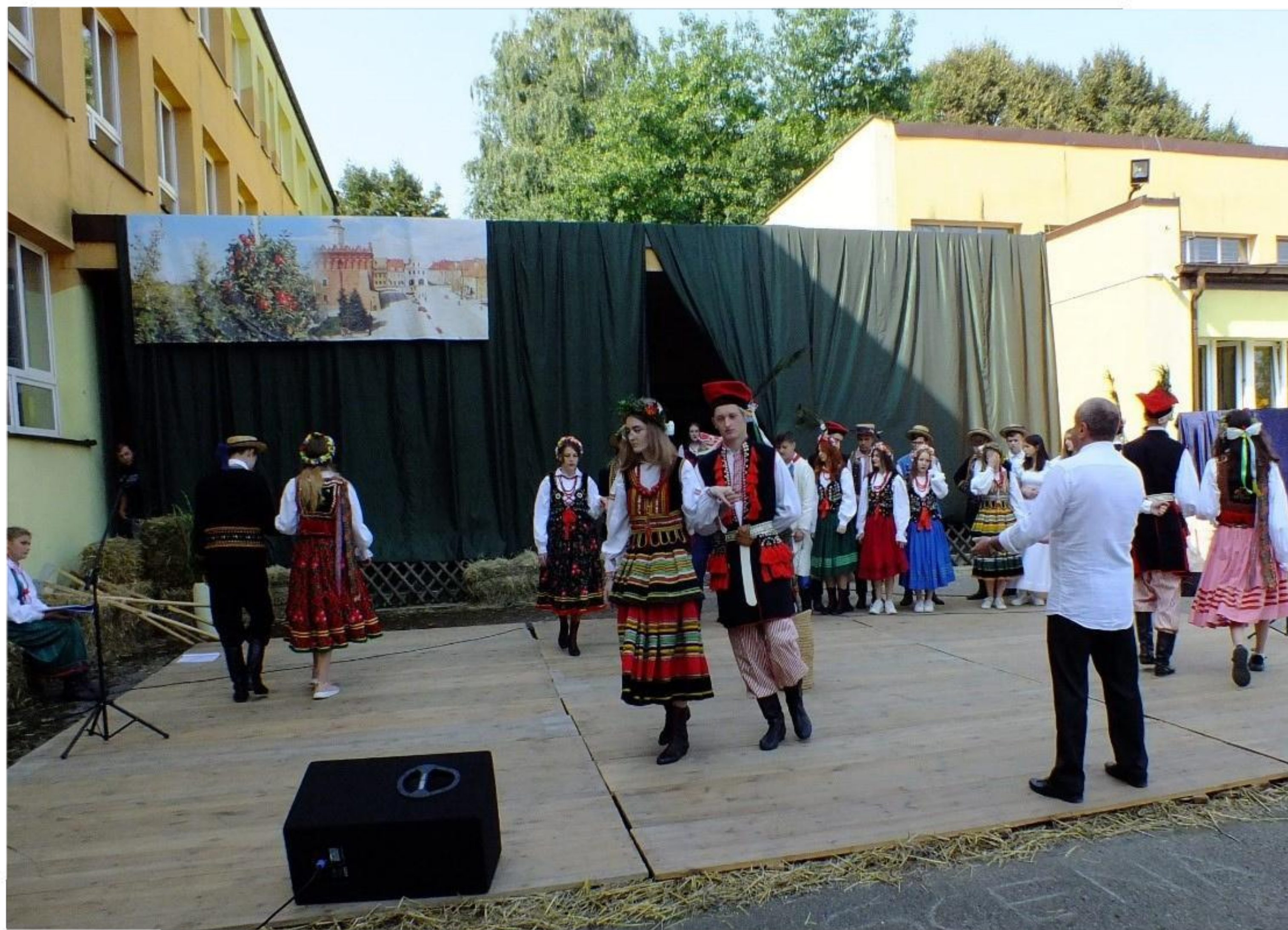
1 Mokozyńskie Święto Plonów - 12 września 2021 r.