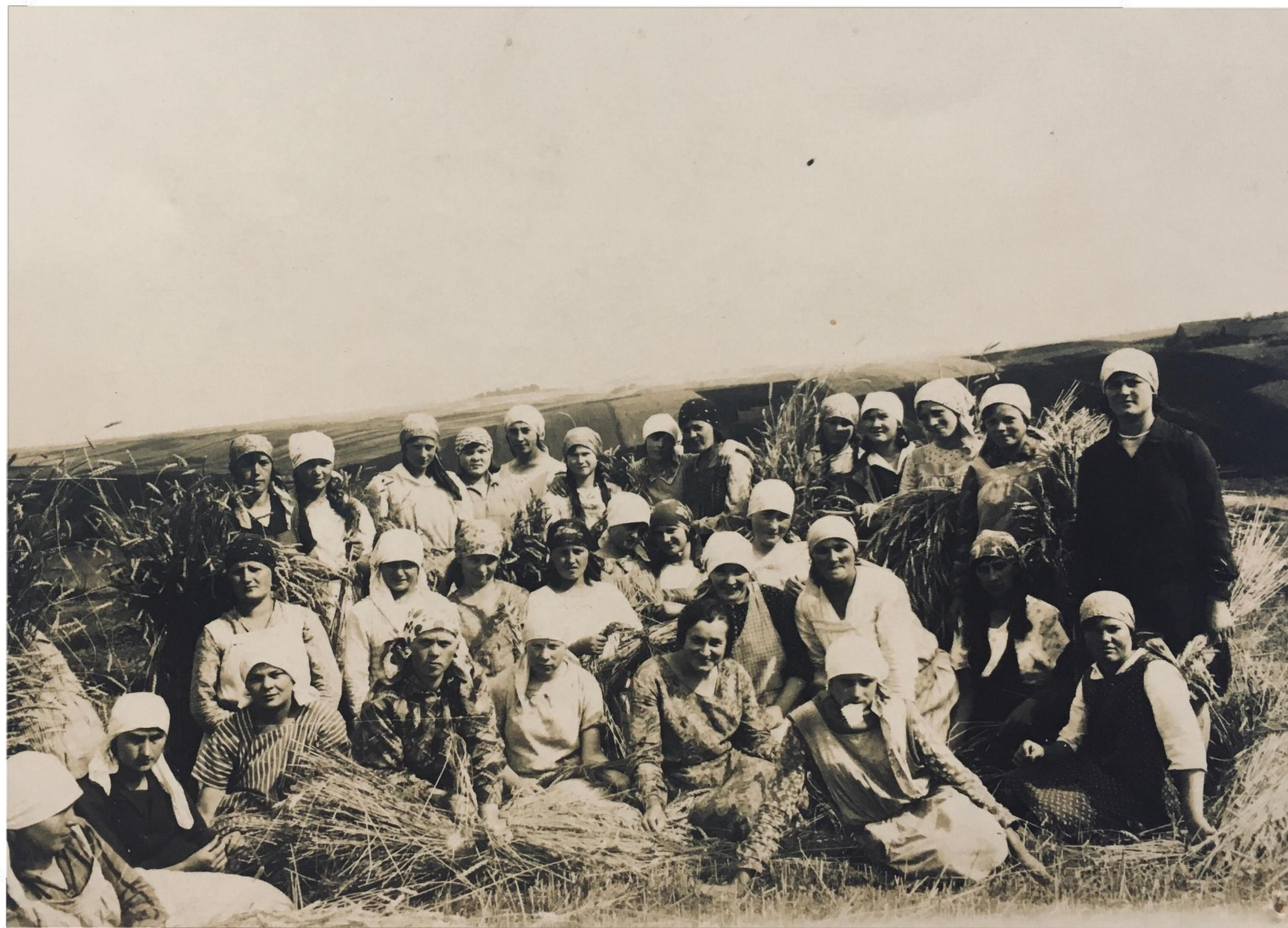
Uczennice przy żniwach - 1931 r.