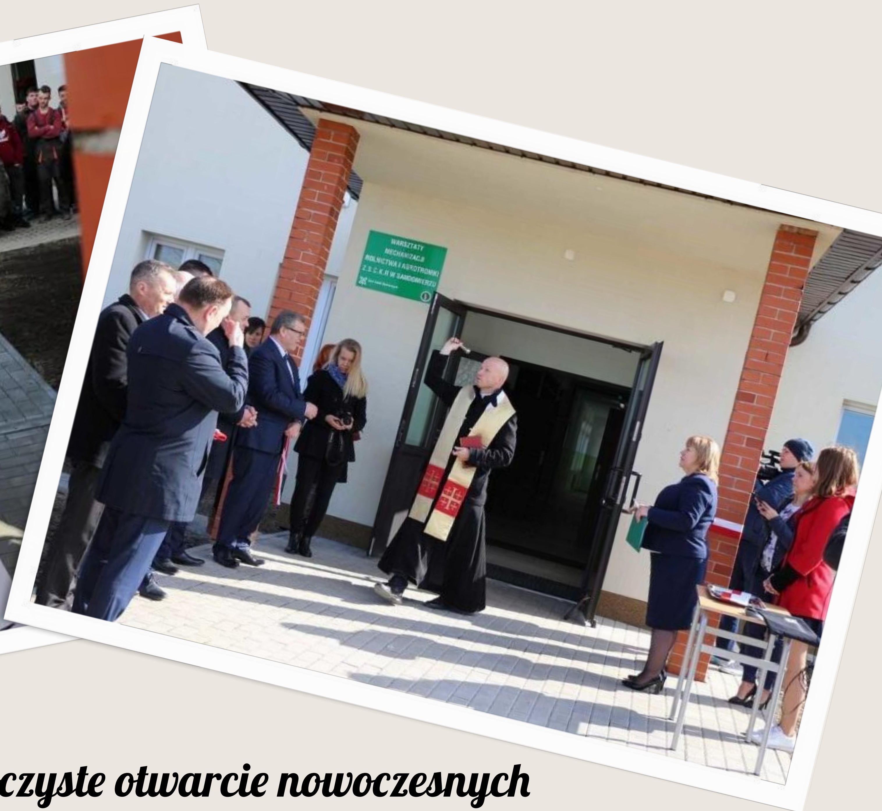
Uroczyste otwarcie nowoczesnych warsztatów mechanizacji i agrotroniki - 2019 r.