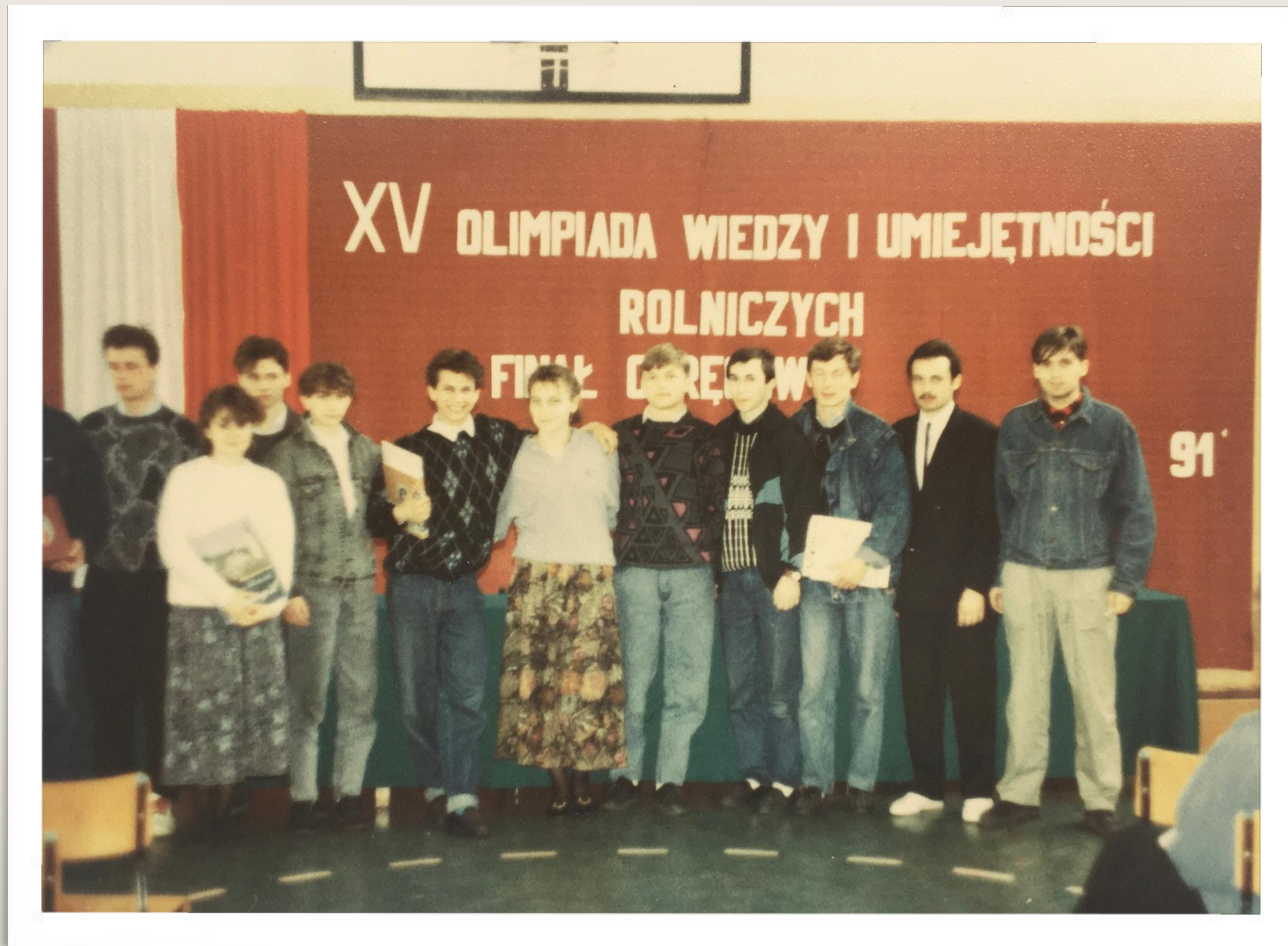
O W I U R - 1991 r.