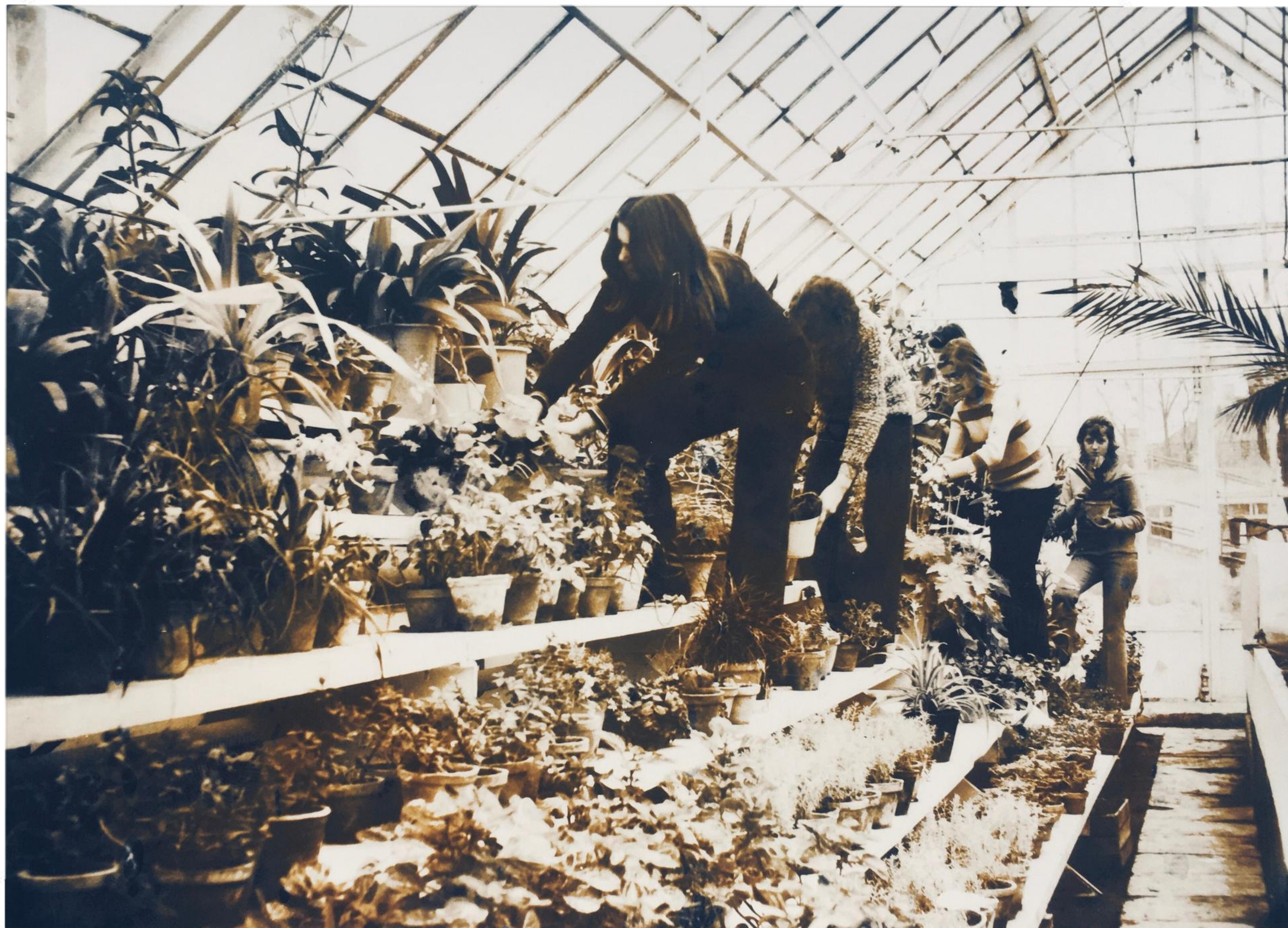
Młodzież w szklarni