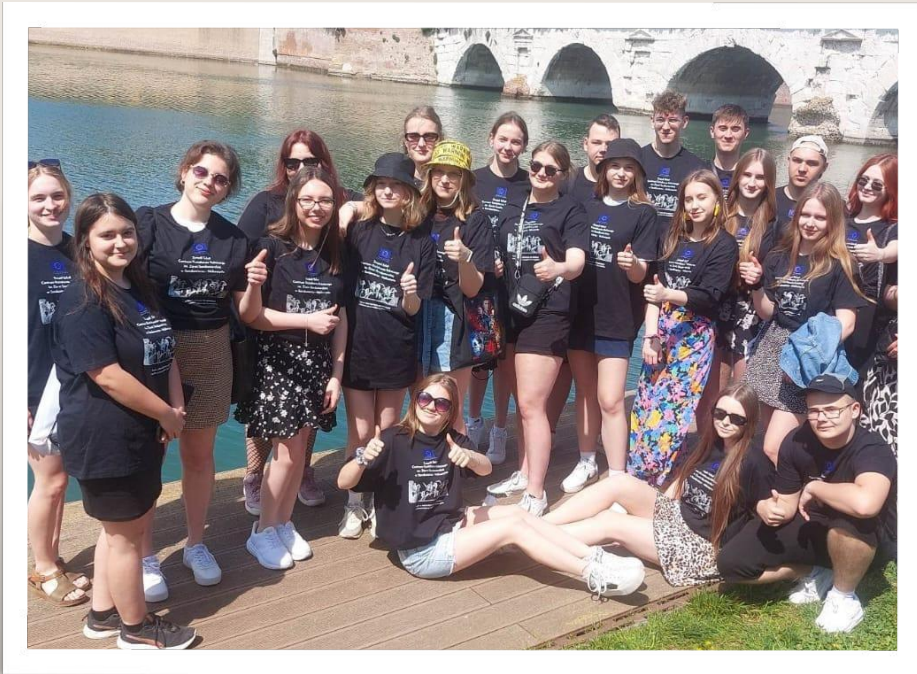
Praktyka zawodowa w ramach Erasmus+ we Włoszech