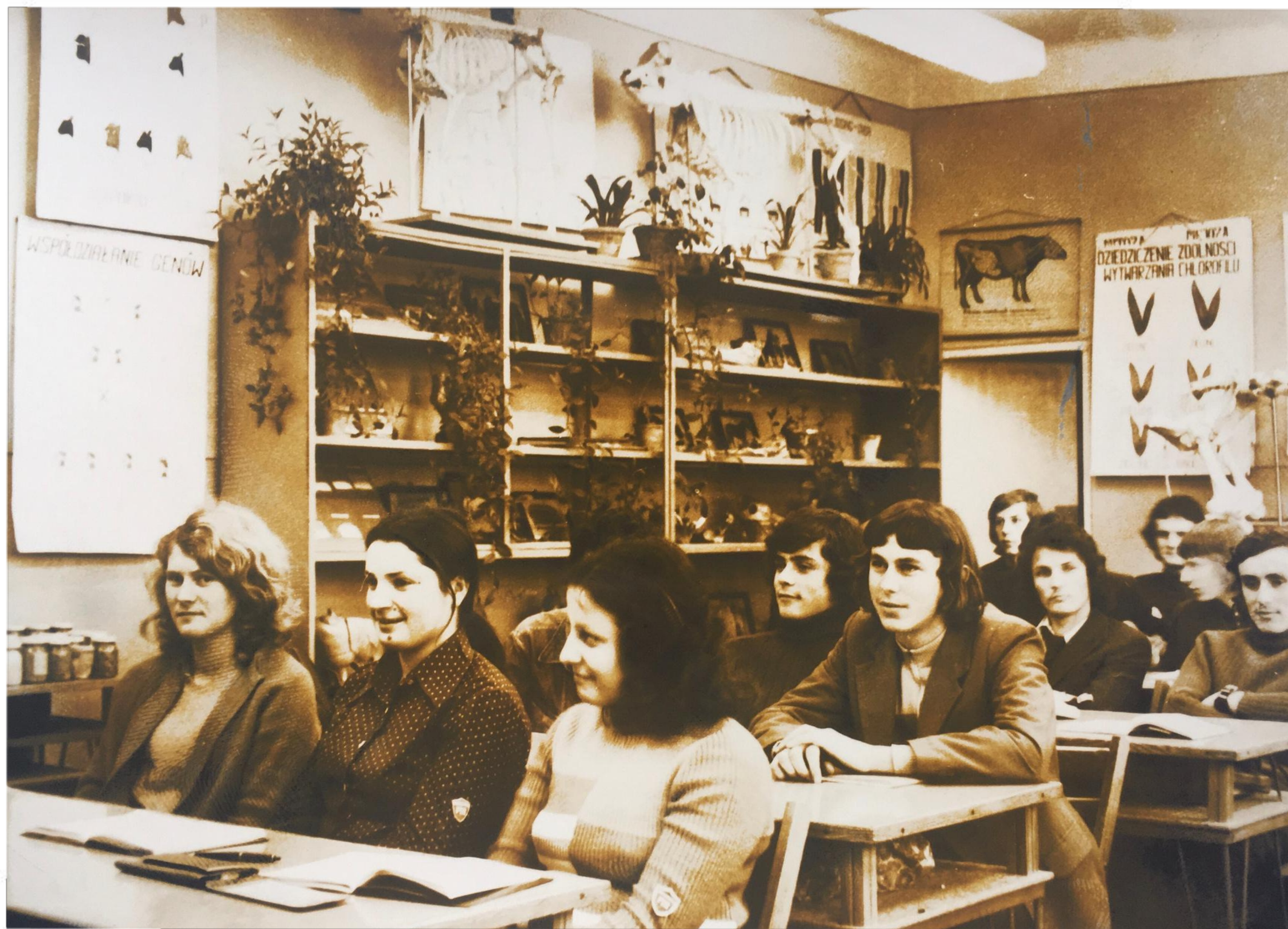
W pracowni produkcji zwierzęcej