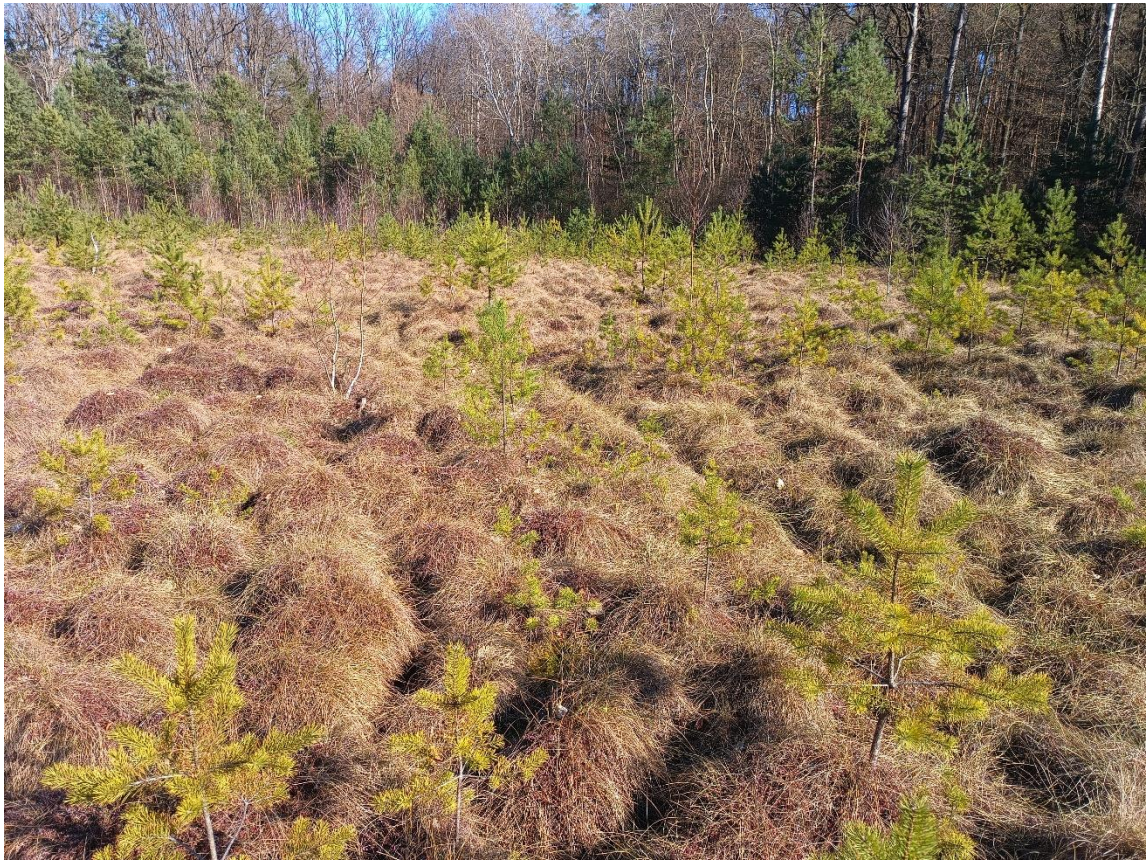
Fot. 2. Zdjęcie pogładowe powierzchni do wycinki