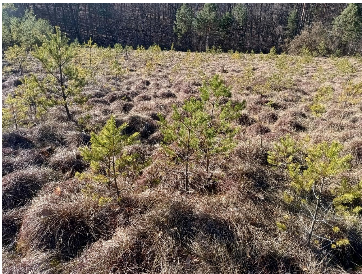
Fot. 1. Zdjęcie poglądowe powierzchni do wycinki

Stan powierzchni wskazanej do ochrony czynnej na terenie rezerwatu przyrody "Pawski Ług":