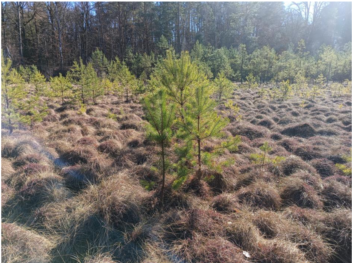
Fot. 3. Zdjęcie pogładowe powierzchni do wycinki