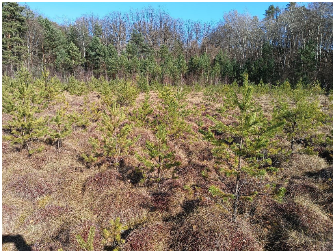
Fot. 4. Zdjęcie pogładowe powierzchni do wycinki