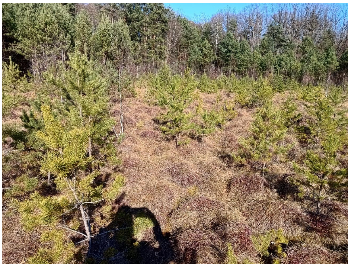
Fot. 5. Zdjęcie pogładowe powierzchni do wycinki