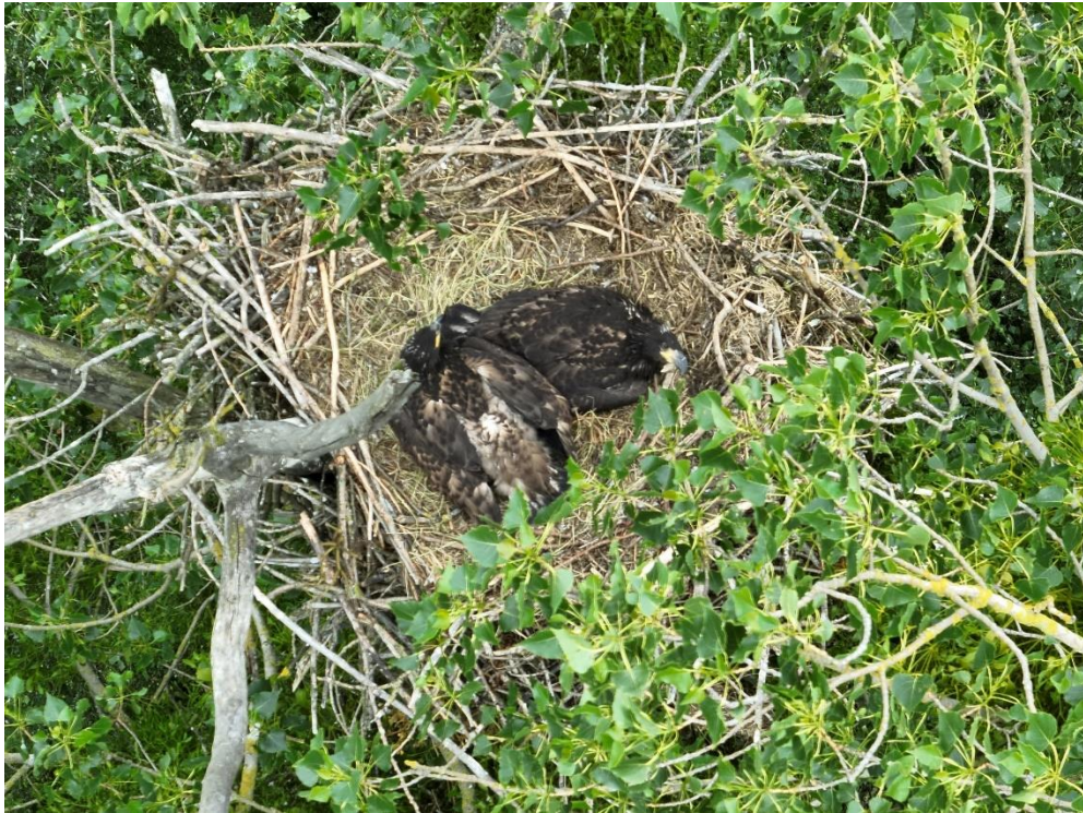
Fot. Dwa młode, opierzone bieliki w gnieździe w oddziale 322d w dniu 10.06.2025 r.

Według danych zebranych przez służbę terenową nadleśnictwa strefa w 2025 r. była zasiedlona a para bielików z sukcesem wyprowadziła 2 młode w gnieździe wybudowanym w 2022 r.