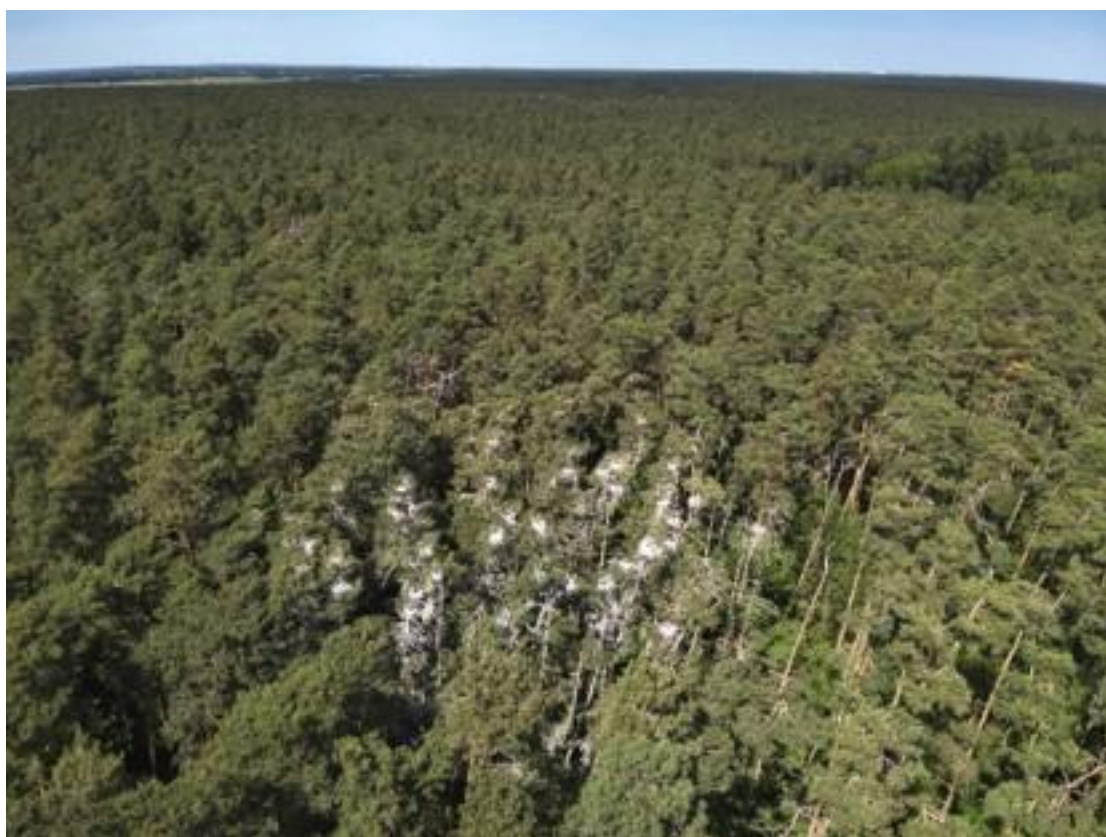
Fot. Widok na kolonię czapli siwych – oddział 145b, leśnictwo Ostrowo (2023 r.)