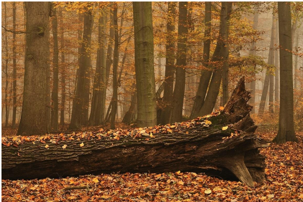
Fot. Powalony, martwy dąb w rezerwacie „Dęby Węgrzynowskie”.

Na terenie rezerwatu nie zidentyfikowano zagrożeń jednak w zamyśle Nadleśnictwa Miradz jest dążenie do poprawy stanu zachowania siedliska grądu środkowoeuropejskiego oraz poprawy warunków egzystencji dla kilkuset niemal dwu i pół wiekowych dębów poprzez ograniczenie ilości rozwijających się buków – gatunku niekorzystnie wpływającego na cel ochrony rezerwatu.