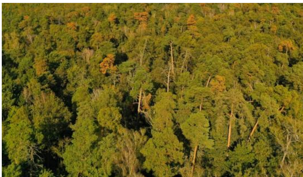
Fot. Zamierające sosny w rezerwacie Ostrowo – 2019 rok.

W związku ze zjawiskiem zamierania sosen (pogłębiające się susze) i gradacją kornika ostrożnego w 2019 r. w Nadleśnictwie Miradz, także w rezerwacie stwierdzono intensywne obumieranie najstarszych sosen liczących ok. 220 lat. Powyższe przyczyniło się do realizacji przedsięwzięcia zbioru szyszek z najstarszych, żywych sosen w rezerwacie celem zachowania zasobów genowych. Nadleśnictwo uzyskało zgodę RDOŚ na zbiór (Zarządzenie Dyrektora RDOŚ w Bydgoszczy z dnia 9 grudnia 2019 r.) a szyszki w ilości 25 kg zostały zebrane z wykorzystaniem metod alpinistycznych (arborystycznych). Wychodowane z wyłuszczonych z szyszek nasion sadzonki wykorzystane zostały do założenia upraw zachowawczych o łącznej pow. 4,43 ha.