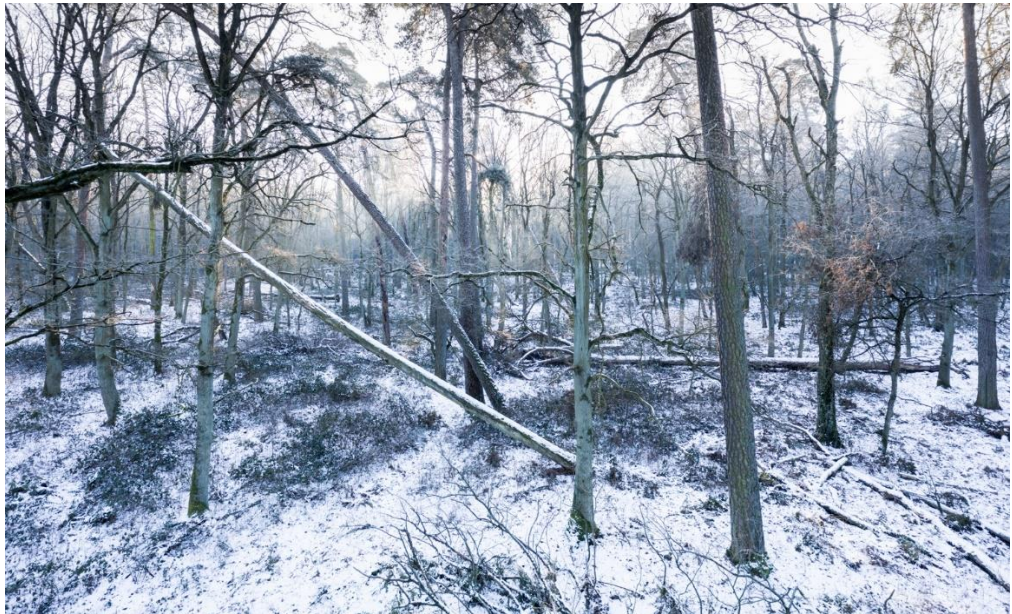
Fot. Zimowy las w rezerwacie Ostrowo