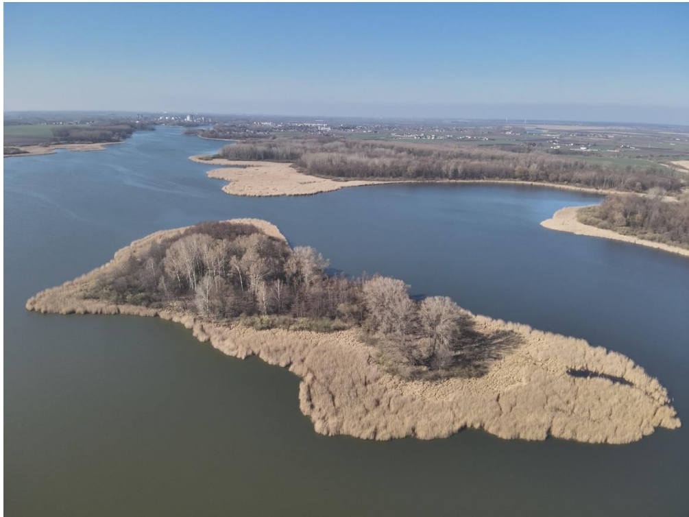
Fot. Wyspa Sucha Góra (oddz. 313c) – całoroczna strefa ochrony wokół gniazda bielika.

Dodatkowo na terenie gminy Kruszwica, obręb ewidencyjny Wróble dz. ewid. nr 162, w lesie niepaństwowym znajduje się strefa ochrony wokół miejsca lęgowego bociana czarnego ( Ciconia nigra ). Ustanowiona została w 2012 r. Według danych posiadanych przez nadleśnictwo gniazdo w strefie nie było zasiedlane przez bociany od 2016 r. a w 2021 r. stwierdzono, że gniazdo to w znacznym stopniu uległo rozpadowi (pozostała tylko podstawa złożona z grubszych gałęzi).