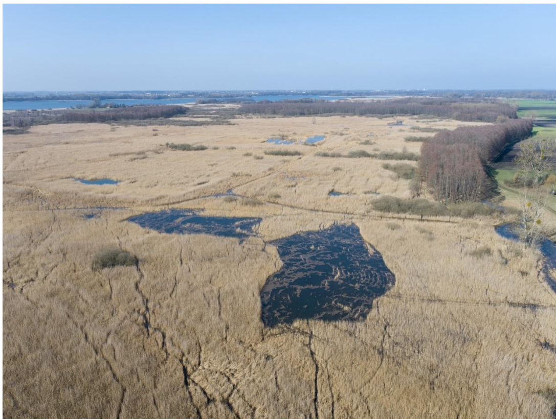
Fot. Widok na fragment rezerwatu Nadgoplański Park Tysiąclecia z powierzchniami (zalane miejsca), na których wykoszano trzcinę w ramach ochrony czynnej (marzec 2024 r.)

Od 2019 r. rezerwat posiada plan ochrony – Zarządzenie Regionalnego Dyrektora Ochrony Środowiska w Bydgoszczy z dnia 24 kwietnia 2019 r. W ramach ochrony czynnej wynikającej z zarówno z planu ochrony jak i z wcześniejszych planów zadań ochronnych Nadleśnictwo Miradz w okresie 2016 – 2025 wykonywało zabiegi polegające na wykaszaniu trzciny (w okresach od połowy listopada do połowy lutego roku następnego) (tworzeniu zatoczek, półwyspów, wysp, firanek trzcinowych wraz z korytarzami wodnymi na przeciętej łącznej pow. 8 – 10 ha. Zabiegi te wykonywane były na działkach ewidencyjnych o nr: 3328, 3329, 3330/1 oraz 3331/1 przez podmioty zewnętrzne (rolników) na podstawie stosownych umów. Dodatkowo w roku 2018 r. w ramach projektu z RPO dla woj. Kujawsko – pomorskiego na lata 2014 – 2020, na pow. zredukowanej ok. 1 ha (działka 3323) usunięty został nalot wierzbowy i wykoszony fragment obszaru z występującą tam chronioną kłocią wiechowatą w celu poprawy stanu wykazywanego tam chronionego siedliska torfowiska nakredowego (7210). Ochrona czynna wspomnianego torfowiska wraz z szuwarem kłoci realizowana była również w latach późniejszych już poza projektami a w ramach umów nadleśnictwa z lokalnymi rolnikami.