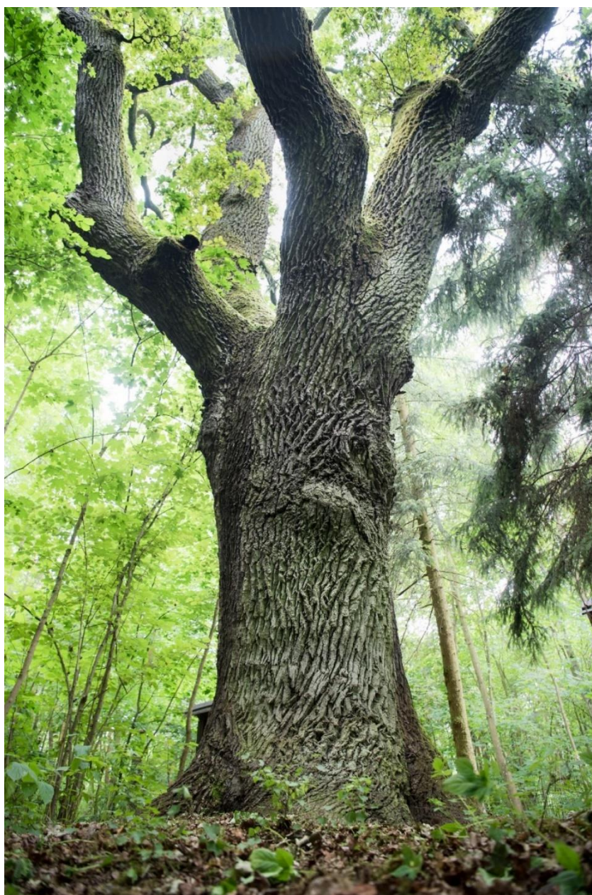
Fot. Pomnik przyrody – dąb szypułkowy w leśnictwie Młyny

Przedbórz, stwarzający potencjalne niebezpieczeństwo dla użytkowników drogi. Pomnik zniesiony został na wniosek nadleśnictwa mocą Uchwały nr XXVII/197/2017 Rady Miejskiej w Strzelnie z dnia 30.05.20217 r. Drzewo zostało ścięte i pozostawione do naturalnego rozkładu. W roku 2023 Nadleśnictwo Miradz wnioskowało do Gminy Strzelno o ustanowienie nowych pomników przyrody. Pracownicy służby leśnej kierując się względami naukowymi, zabytkowymi oraz kulturowymi wytypowali 16 okazów drzew spełniających kryteria pomnika przyrody. Pomniki owe zostały ustanowione Uchwałą nr LVIII/526/2023 Rady Miejskiej w Strzelnie z dnia 27 marca 2023 r.