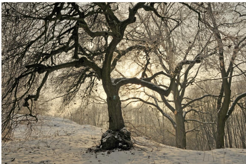
Fot. Pomnik przyrody – lipa drobnolistna o specyficznym pokroju – leśnictwo Rożniaty

W celach promocyjnych oraz edukacyjnych nt. ciekawostek przyrodniczych kryjących się w kujawskich lasach jednostka wydała w 2023 r. broszurę pt. MIRADZKIE SKARBY – Pomniki przyrody Nadleśnictwa Miradz w Gminie Strzelno.