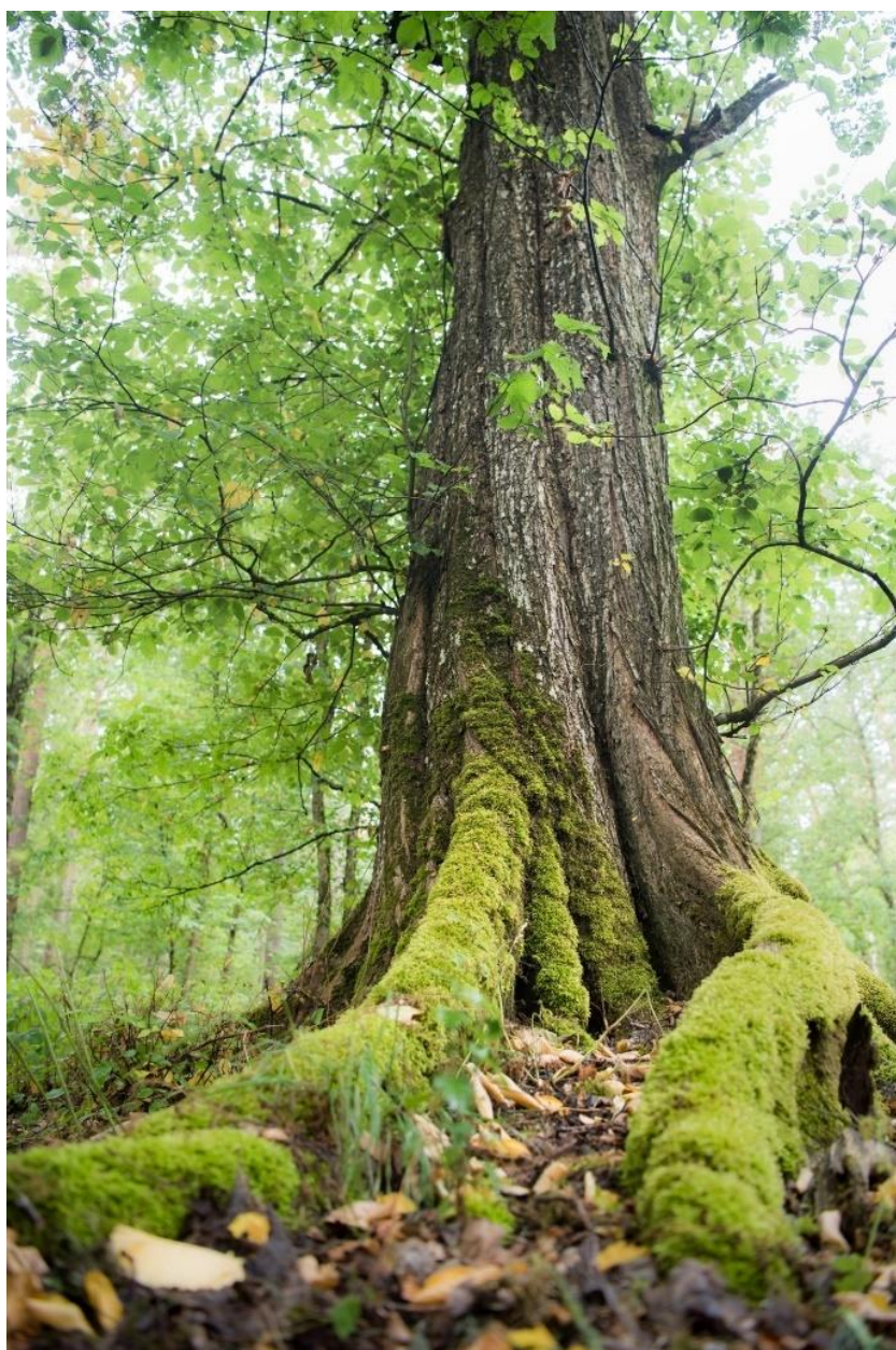
Fot. Pomnik przyrody – wiąz górski w leśnictwie Ostrowo

Ten ostatni to drzewostan dębu szypułkowego ( Quercus robur ) w wieku 240 lat o powierzchni 11,84 ha. Drzewostan ten został sklasyfikowany jako chronione siedlisko przyrodnicze w ramach sieci Natura 2000 – grąd środkowoeuropejski (9170) z wyszczególnieniem jako grąd typowy (9170-1) i w roku 2025 objęty dodatkową ochroną w formie rezerwatu przyrody. Chronione jako pomniki przyrody drzewa w Nadleśnictwie Miradz należą do gatunków: dąb szypułkowy ( Qercus robur ), cis pospolity ( Taxus baccata ), jawor ( Acer pseudoplatanus ), jarząb brekinia ( Sorbus torminalis ), wiśnia ptasia ( Prunus avium ), lipa drobnolistna ( Tilia cordata ), wiąz górski ( Ulmus glabra ), jesion wyniosły ( Fraxinus excelsior ) oraz kasztanowiec biały ( Aesculus hippocastani ).