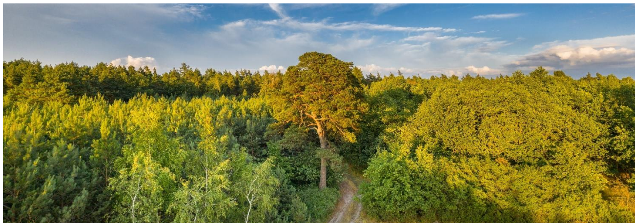
Fot. Ustanowiona w 2023 r. pomnikiem przyrody sosna w l-ctwie Kurzebiela – od 2024 obumarła.