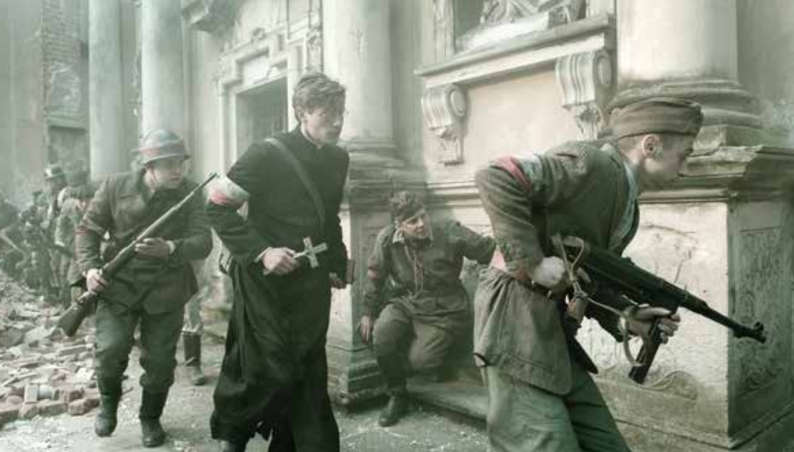
„Zieja”, reż. Robert Gliński