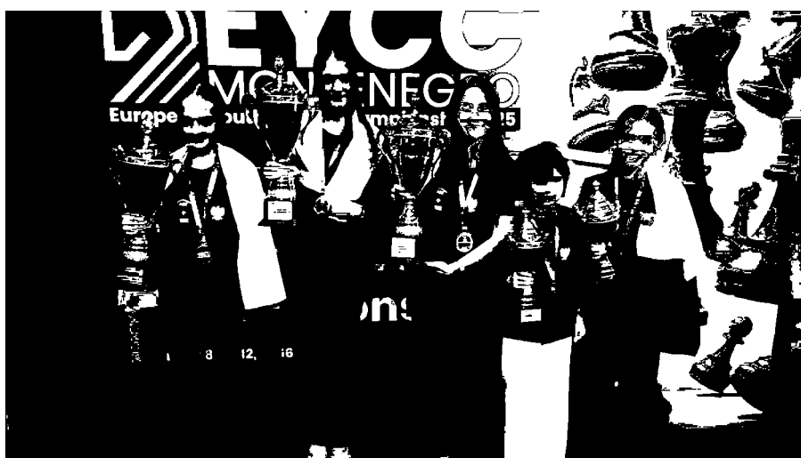
Polskie medalistki MEJ