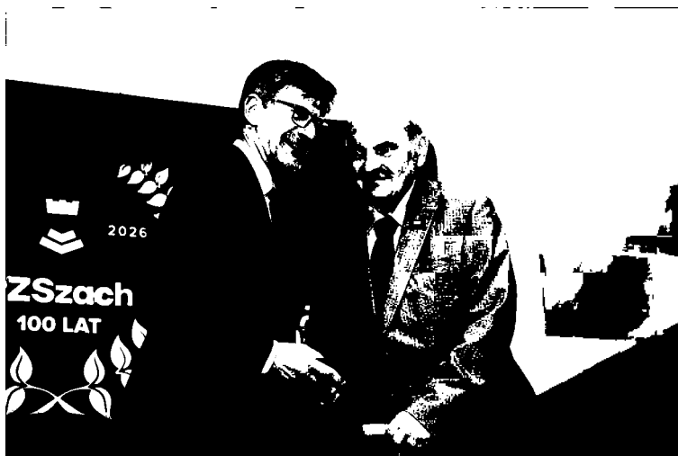
Wręczenie Krzyża Kawalerskiego Orderu Odrodzenia Polski.