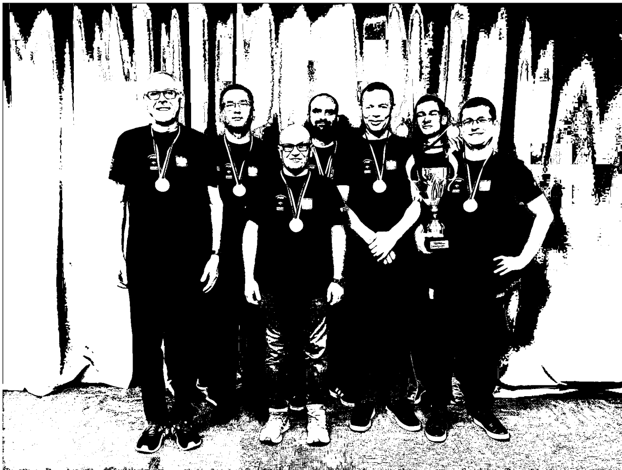
Polacy na Olimpiadzie Szachowej Osób Niewidomych i Słabowidzących IBCA