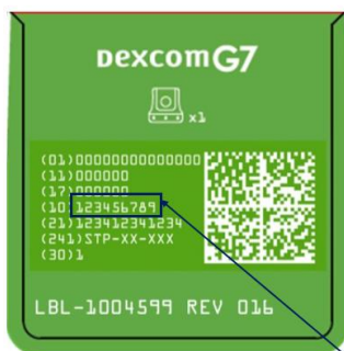
Figure 1: G7 Wearable Outer Box Label – Side 1