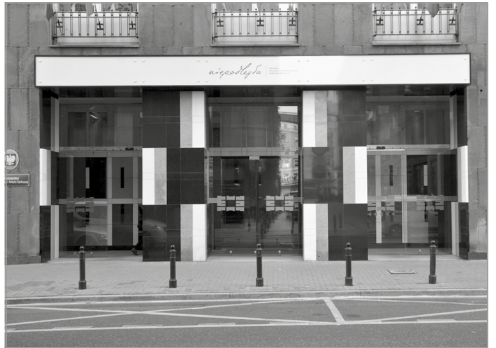
Siedziba Ministerstwa Rodziny, Pracy i Polityki Społecznej, ul. Nowogrodzka 1/3/5, Warszawa, 2018 r.

A wszystkim Państwa zapewniamy, że będziemy dalej pracować na rzecz poprawy sytuacji polskich rodzin, wszystkich Polaków.