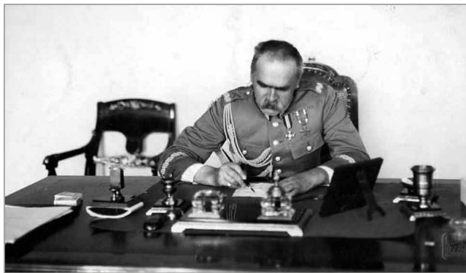
Dekret o obowiązkowym ubezpieczeniu na wypadek choroby z 11 stycznia 1919 r. podpisany przez Naczelnika Państwa Józefa Piłsudskiego.

Dzieci bez dostatecznej opieki rodzicielskiej, zaniedbane pod względem wychowawczym - mają prawo do opieki i pomocy państwa w zakresie oznaczonym ustawą (art. 103).