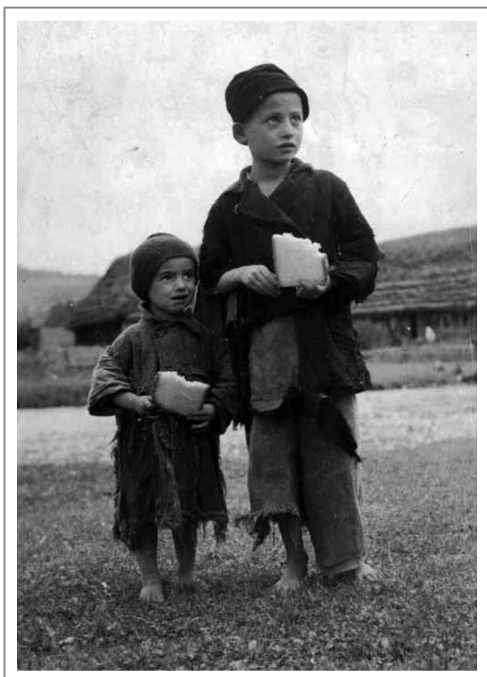
Dzieci ze wsi Sławsk w latach 20.

pomocy dzieciom jest działalność takich instytucji jak ochronki, sierocińce, domy dziecięce, pogotowia opiekuńcze, domy matki i dziecka, które tworzone są przez osoby prywatne, organizacje kościelne, stowarzyszenia społeczne oraz władze państwowe.