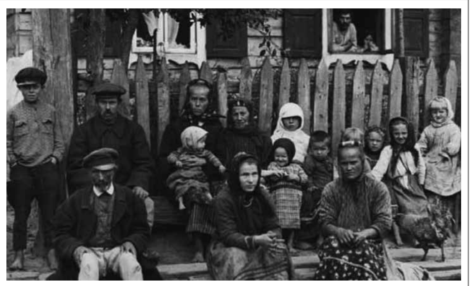
Kresowiaci ze wsi Morocz, 1929.

czenia społecznego, w tym ubezpieczeń społecznych.