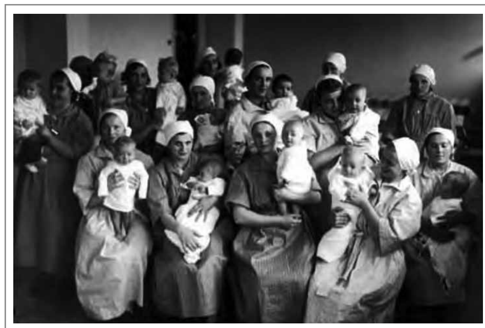
Otwarcie Domu Matki i Dziecka na Bielanach w Warszawie staraniem Towarzystwa Ratujmy Niemowlęta, 1938.