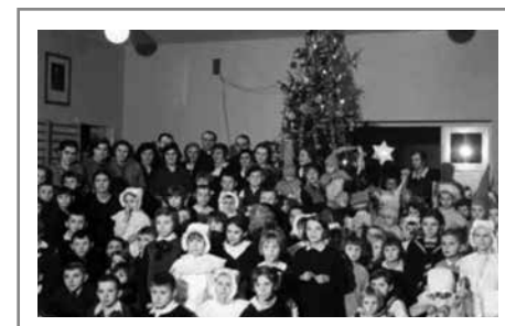
Gwiazdka urządzona dla najbardziej chorych dzieci przez Przychodnię Przeciwgruźliczą przy Ośrodku Zdrowia PCK w Świętochłowicach, 1930.

Z czasem polityka władz publicznych rozwija się obejmując nie tylko działania o charakterze ochronnym, ale również rozwojowym, takie jak: dostęp do nauki (wprowadzenie obowiązku szkolnego), organizacja