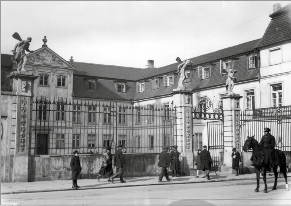
Siedziba Ministerstwa Pracy i Opieki Społecznej, ul. Długa 38/40, Warszawa, 1930 r.

Dzisiaj kontynuujemy to, co nasi poprzednicy zaczęli wiele lat temu. Rodzina, seniorzy, prawa pracowników, wsparcie najbardziej potrzebujących – to wszystko znajduje się w obszarze działań resortu, który od 2015 r. nosi dumną nazwę: Ministerstwo Rodziny, Pracy i Polityki Społecznej. Dlaczego dodaliśmy do niej człon „Rodzina”?