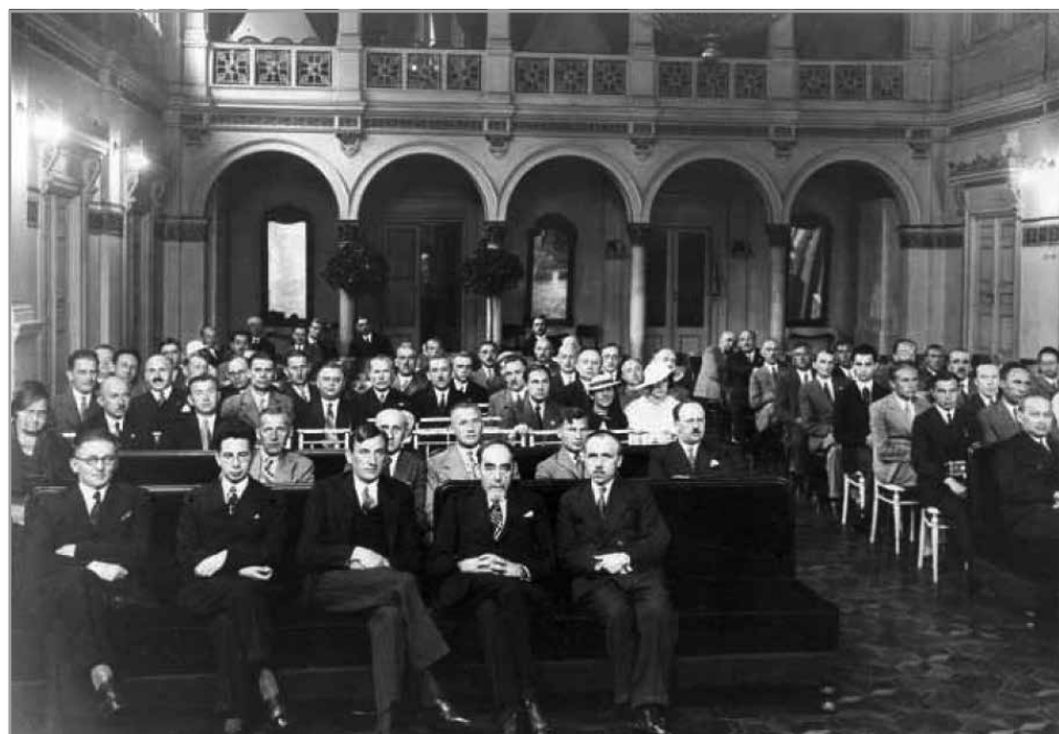
Zjazd zjednoczeniowy pracowników ubezpieczeń społecznych i dawnych kas chorych. Warszawa, 1 lipca 1934 r.