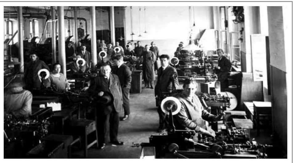
Państwowa Fabryka Cygar i Wyrobów Tytoniowych w Krakowie przy ul. Dolnych Młynów, 1926.