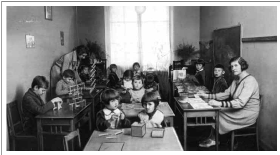
Przedszkole dla dzieci pracowników Państwowego Banku Rolnego w Łucku, 1932.