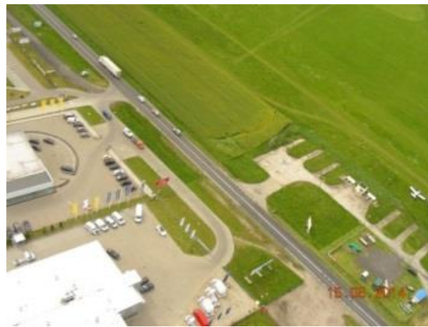
fot.1 i 2 Widok miejsca przyziemienia szybowca