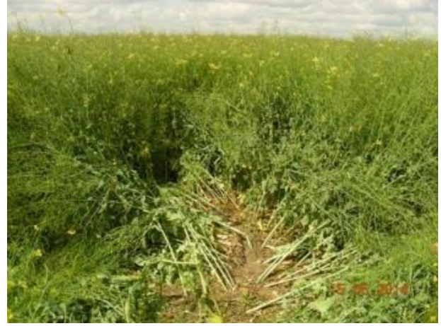
fot.4 Ślady w miejscu lądowania szybowca