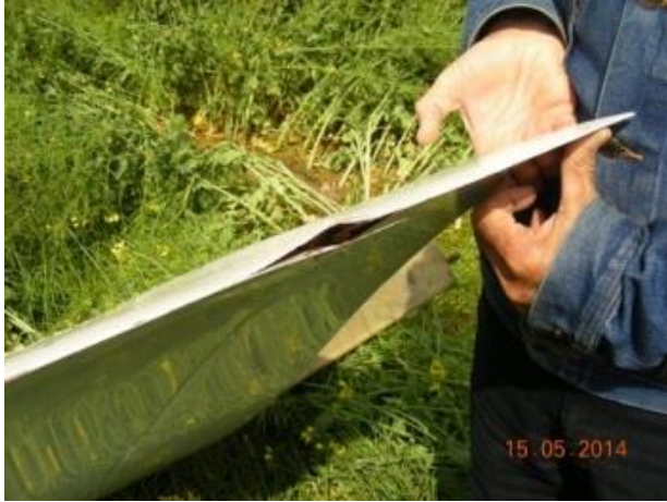
fot.3 Uszkodzenie krawędzi spływu skrzydła