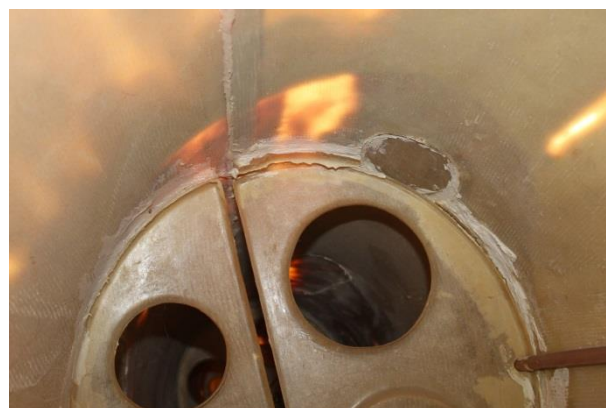
Fot. 3,4,5,8 Zdjęcia uszkodzeń kadłuba

Załoga: kobieta lat 33, nalot ogólny 131:38, nalot samodzielny 81:47, nalot w ostatnich 90 dniach 6:18 w tym samodzielnie 4:06. Nalot na szybowcu Junior 40:38 w 26 lotach. Licencja SPL wydana 19.06.2013. Srebrna Odznaka Szybowcowa. Orzeczenie lotniczo-lekarskie wydane 17.06.2015 ważne do 17.06.2020.