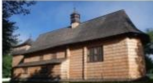
By Henryk Bielecki – Praca własna, CC BY-SA 4.0, https://commons.wikimedia.org/wiki/index.php?curid=47209989