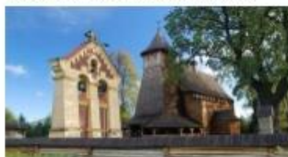
By Henryk Bielecki – Praca własna, CC BY-SA 4.0, https://commons.wikimedia.org/wiki/index.php?curid=47209989