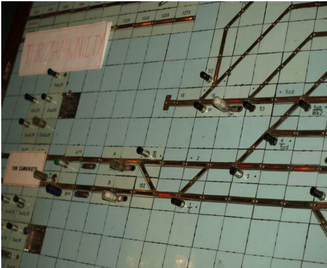
Zdjęcie pulpitu nastawczego w nastawni stacji Baby bezpośrednio po zaistnieniu poważnego wypadku – widok układu torowego od strony rozjazdów nr 101 i 102

Naruszenia obudów liczników nie stwierdzono.