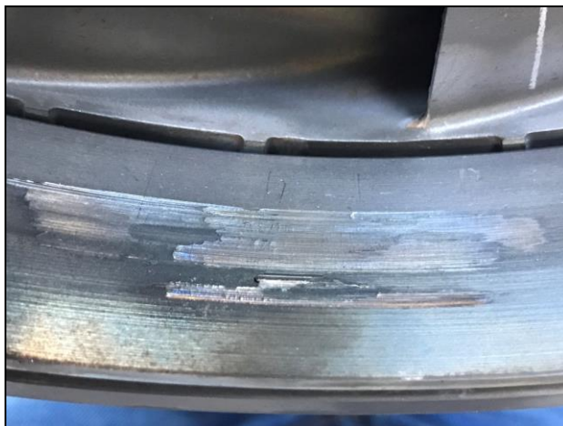
Zdj. 1. Uszkodzony korpus sprężarki.

w wyniku, którego stwierdzono obtarcia zewnętrznych górnych krawędzi łopatek oraz obtarcia wewnętrznych powierzchni korpusu sprężarki Zdj. 1-4.