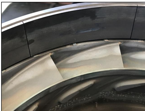
Zdj. 3. Uszkodzony korpus sprężarki.