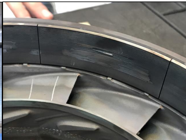
Zdj. 2. Uszkodzony korpus sprężarki.